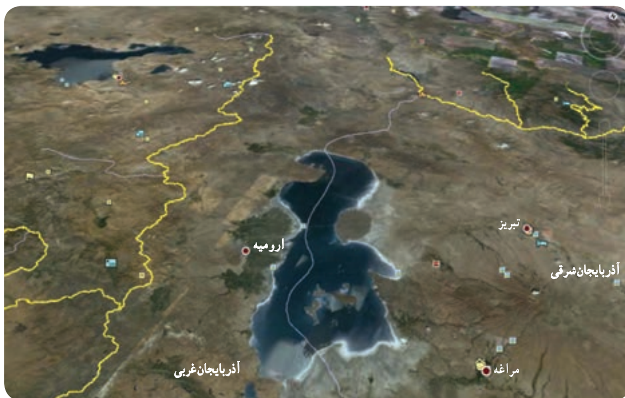
شکل ۲۴-۱- دریاچه ارومیه

حوضه آبریز دریاچه ارومیه که بزرگ‌ترین دریاچه داخلی کشور است، مساحتی حدود ۵۱۸۷۶ کیلومتر مربع دارد که ۳۸ درصد آن از نواحی کوهستانی ۲۱ درصد را تپه‌ها و ۲/۱۱ درصد را فلات‌ها و تراس‌های مرتفع و حدود ۹ درصد آن را دریاچه و مابقی شامل دشت‌ها و اراضی مخلوط و گوناگون را شامل می‌شوند. ارتفاع آن از سطح دریاهای آزاد ۱۲۷۵ متر و عمق متوسط آن ۵-۶ متر و حداکثر عمق آن ۱۶-۱۴ متر می‌باشد ۱ .