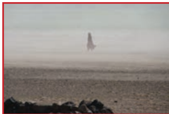
شکل ۳۰-۱ وقوع توفان‌های همراه با ماسه در منطقه بورالان ماکو

۱- آلودگی هوا: استان آذربایجان غربی در مقایسه با استان‌های بزرگ صنعتی کشور، تقریباً استان پاک‌تری از نظر هوا محسوب می‌شود. اگر نفوذ بعضی از عوامل برون استانی چون ورود ریزگرد و غبار از بیابان‌های عراق و سوریه و توده هوای غرب که مواد آلوده‌کننده کشورهای صنعتی و غرب را با خود به همراه می‌آورد، استثنا کنیم، آلودگی هوا فقط در شهر ارومیه به علت وجود صنایع تبدیلی و واحدهای صنعتی که از سوخت‌های فسیلی استفاده می‌کنند، مصرف سوخت وسایل نقلیه و مصارف خانگی نمود پیدا کرده است.