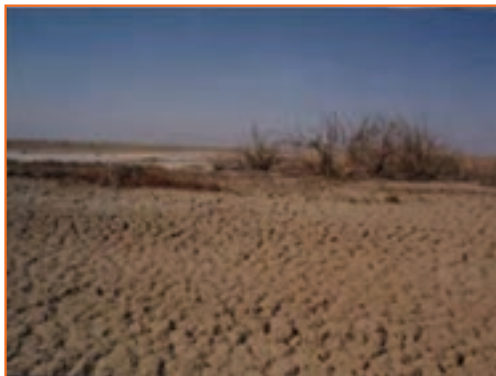
شکل ۲۶-۱ چشم اندازی از زمین های در معرض خشکسالی شمال استان (بورالان ماکو)