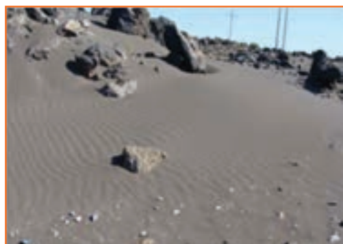
شکل ۲۷-۱ گسترش بیابان شمال استان (بورالان ماکو)