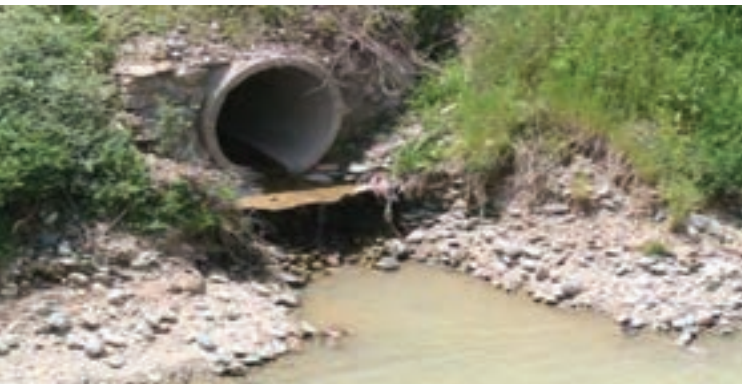
شکل ۳۱-۱- تخلیه فاضلاب در مسیر رودخانه شهرچای

امروزه روش‌های تصفیه مختلفی برحسب نوع فاضلاب و شرایط محل و استفاده مجدد از پساب در کشور گسترش پیدا کرده است که از میان آن‌ها سه روش لجن فعال، لاگون هوادهی و برکه تثبیت بیشتر در کشور توسعه داده شده‌اند. روش تصفیه فاضلاب غالب شهرهای استان لجن فعال (در شهر ارومیه) و لاگون هوادهی (در شهرهای مهاباد، خوی و میاندوآب) می‌باشد.