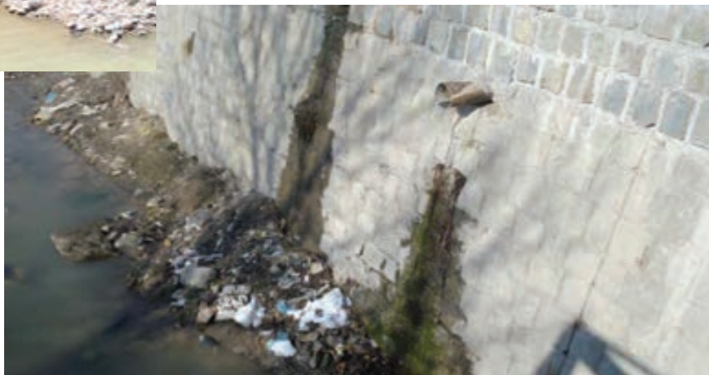
شکل ۳۲-۱- تخلیه فاضلاب‌های شهری و خانگی