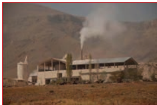
شکل ۲۸-۱ آلودگی هوا از طریق دود حاصل از کارخانه‌ها

آیا می‌توانید با مراجعه به تقویم بگویید روز هوای پاک کدام روز از سال است؟