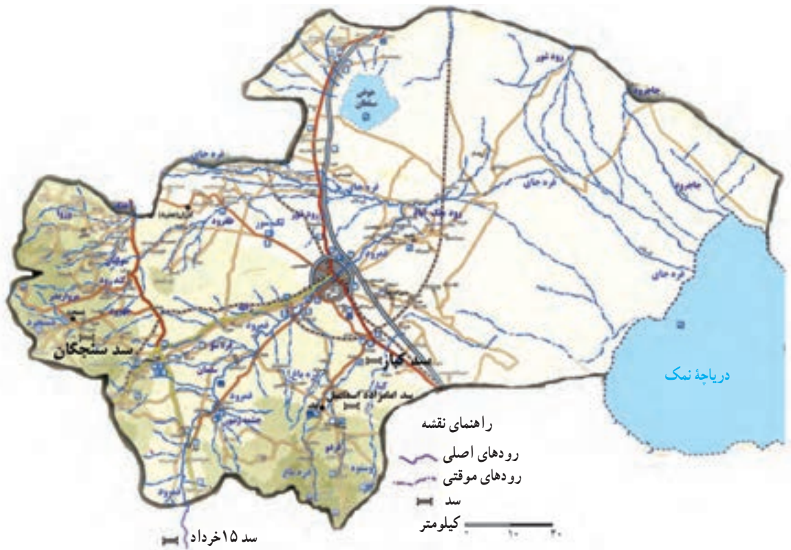
شکل ۱۴-۱- نقشه پراکندگی دریاچه‌ها، سدها و رودهای استان قم