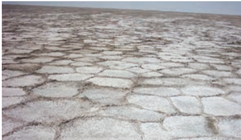
شکل ۱۷-۱- سطح دریاچه نمک قم در فصل تابستان

۱- دریاچه نمک (قم) : دریاچه نمک از نظر موقعیت جغرافیایی در شرق استان قم و در بین سه استان قم، سمنان و اصفهان قرار دارد. تبخیر زیاد سبب شوری شدید آب و ایجاد لایه ضخیمی از نمک در دریاچه شده است. قسمت غرب و شمال غرب دریاچه نمک که رود کرج و جاجرود به آن وارد می‌شود، باتلاقی است. مساحت این دریاچه در حدود ۱۸۰۶ کیلومتر مربع است.