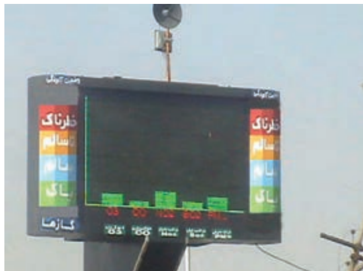
شکل ۳۱-۱- ایستگاه سنجش آلودگی هوا در شهر قم