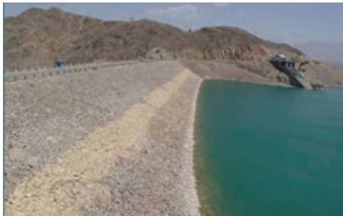
شکل ۱-۱۵- سد ۱۵ خرداد

سد ۱۵ خرداد: این سد در فاصله ۶۵ کیلومتری جنوب غربی شهر قم و در خارج از محدوده سیاسی استان قم روی قمرود ساخته شده است. هدف از ساخت این سد، تأمین آب آشامیدنی شهر قم، تأمین آب مورد نیاز زمین‌های کشاورزی و نیز مهار سیلاب است. این سد از دو قسمت، سد اصلی و بازوی خاکی تشکیل شده است. آب دریاچه سد به دلیل ورود برخی رودهای فرعی شور به قمرود و تبخیر زیاد سد، تا حدودی شور است (شکل ۱-۱۵).