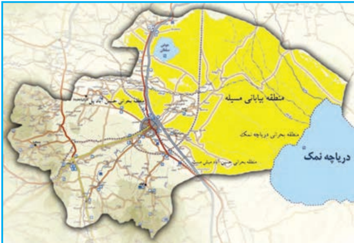
شکل ۱-۳۴- پراکنندگی جغرافیایی مناطق بیابانی استان