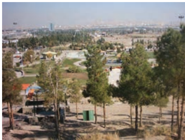
شکل ۱۹-۱- پارک جنگلی علوی

۱- جنگل‌های دست کاشت: جنگل‌هایی اند که منشأ طبیعی نداشته و به دست انسان ایجاد شده‌اند. مساحت جنگل‌های دست کاشت در استان قم ۴۱۳۶ هکتار است. جنگل‌های دست کاشت شامل پارک‌های جنگلی دست کاشت و تاغزارهای استان می‌باشند. الف) پارک‌های جنگلی دست کاشت: به مناطقی گفته می‌شود که با جمع‌آوری گونه‌های گیاهی متنوع و مناسب و به منظور بازسازی محیط‌های تخریب شده و با ایجاد محیط‌های جنگلی تحت مدیریت تفریحی قرار می‌گیرد. مهم‌ترین پارک‌های جنگلی استان قم عبارت‌اند از: ۱- پارک جنگلی علوی (کیلومتر ۵ جاده قم - نيزار) پارک جنگلی غدیر (کیلومتر ۱۰ جاده قم - نيزار) و پارک جنگلی اسلام‌آباد (کیلومتر ۱۰ جاده قم - سلفچگان)