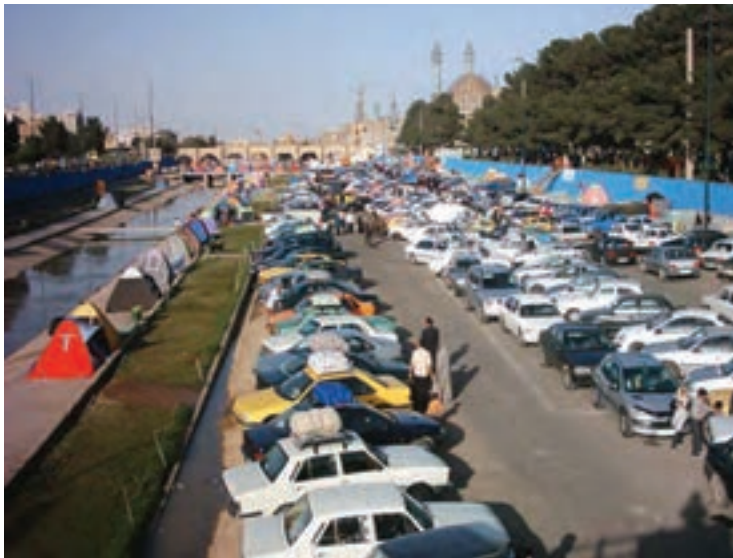
شکل ۲۹-۱- روز ۹ فروردین ۱۳۸۸

– برای کاهش خسارات خشک‌سالی در استان چه راهکارهایی را مناسب می‌دانید؟