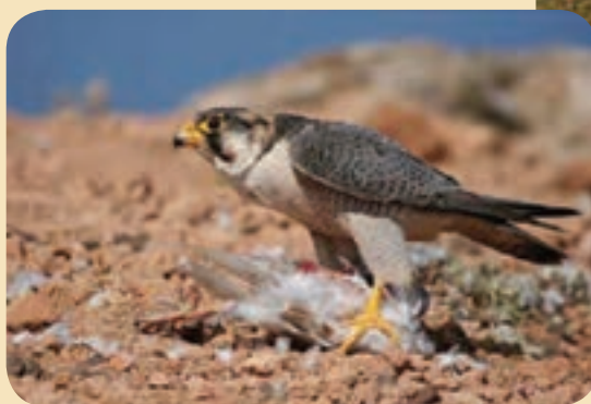
شکل ۲۷-۱- شاهین نماد محیط زیست استان قم