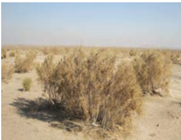
شکل ۲۰-۱- تاغزارهای اطراف حسین‌آباد میش مست

ب) تاغزارها: به منظور جلوگیری از حرکت ماسه‌های روان در منطقه شرق استان قم اقدام به کاشت گونه‌های گیاهی تاغ شده است که بیشتر در اطراف روستای حسین‌آباد میش مست قرار دارند.