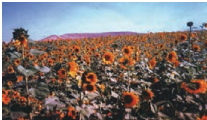
شکل ۳۳-۱- کشت آفتابگردان با استفاده از پساب فاضلاب در منطقه حصار سرخ