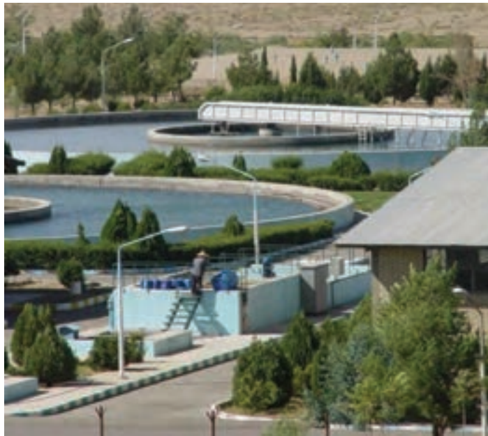
شکل ۳۲-۱- تصفیه‌خانه سد ۱۵ خرداد

«دودهک» احداث شده است. آب تصفیه‌خانه قم از سد ۱۵ خرداد تأمین و توسط لوله به تصفیه‌خانه منتقل می‌شود. در این تصفیه‌خانه، سالانه حدود ۷۰ میلیون مترمکعب آب تصفیه شده به شهر قم منتقل می‌شود (شکل ۳۲-۱).