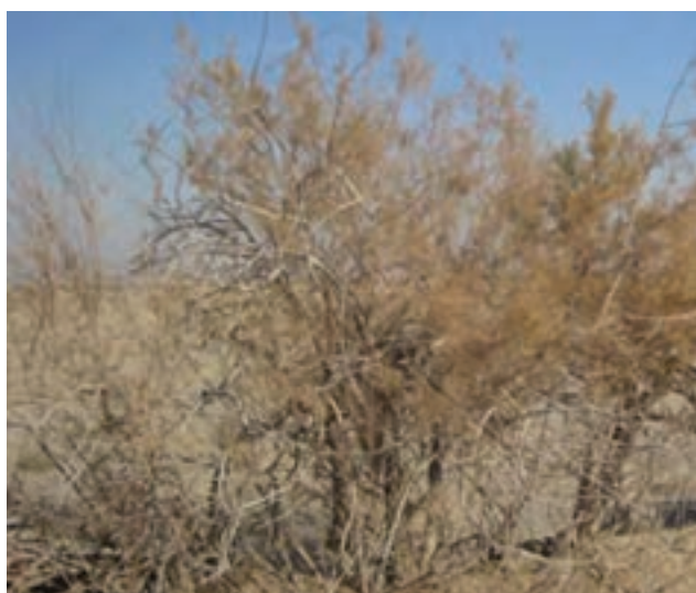
شکل ۲۱-۱- درختچه گز در بستر رود قمرود

۲- بیشه‌زارها و درختچه‌زارها: این مناطق با وسعت ۹۱۲۵ هکتار در سطح استان پراکنده‌اند و شامل رویش‌گاه طبیعی گز است. درختچه‌های گز بیشتر در منطقه مسیله و اطراف رودخانه قره‌چای و رود شور قرار دارند.