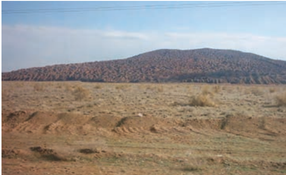
شکل ۳۵-۱- منطقه بیابانی کوه نمک

روش‌های مبارزه با بیابان‌زایی در استان قم