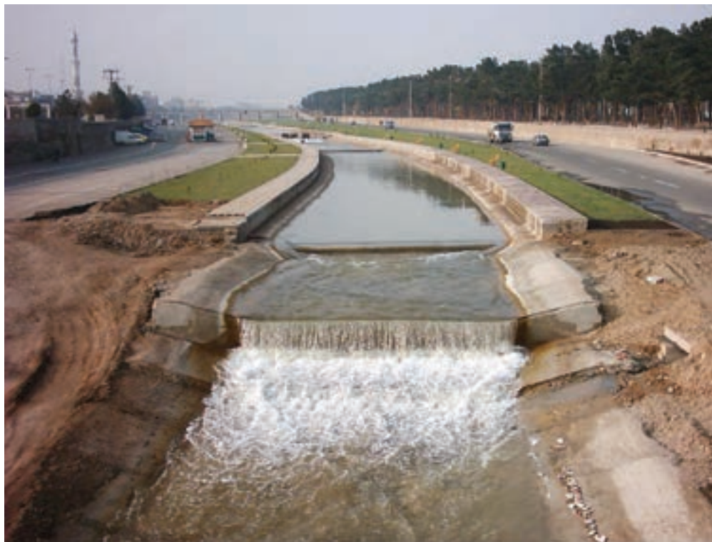
شکل ۱۳-۱- قمرود؛ از وسط شهر قم عبور می‌کند.

۲- قره‌چای : این رود از ارتفاعات جنوب شازند اراک سرچشمه می‌گیرد و پس از عبور از استان‌های مرکزی و همدان و دریافت شعباتی از این استان‌ها، از طرف شمال غربی وارد استان قم (بخش جعفرآباد) می‌شود و پس از دریافت شعباتی گوناگون در محل پل دلاک به قمرود می‌پیوندد. این رود پس از عبور از دشت خشک و بیابانی مسیله وارد دریاچه نمک می‌شود (شکل ۱۴-۱).