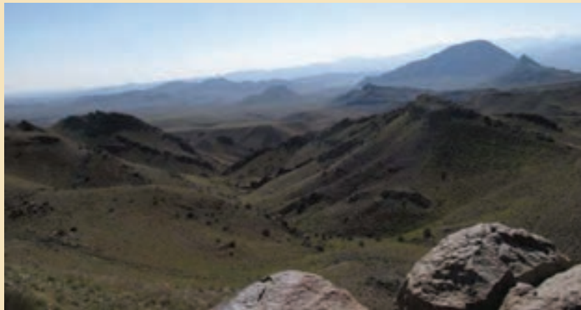
شکل ۱-۲۴- منطقه پلنگ دره

۱- منطقه حفاظت شده پلنگ دره : به شکل ۱-۲۴ توجه کنید. منطقه حفاظت شده پلنگ دره با وسعتی در حدود ۳۲۰۰۰ هکتار در جنوب غربی استان و در فاصله ۵۰ کیلومتری جنوب غربی شهر قم قرار دارد. وجود ارتفاعات از جمله کوه آله و سخت حصار از ویژگی‌های توپوگرافی منطقه محسوب می‌شود. وجود چشمه‌سارهای زیبا و مناظر طبیعی بدیع از ویژگی‌های گردشگری منطقه به حساب می‌آید. پوشش گیاهی غالب منطقه بیشتر شامل گز، بادام کوهی (بادامچه)، گون، ریواس و... می‌توان اشاره کرد. همچنین وجود گونه‌های متنوع جانوری مانند کبک، تیهو، بلدرچین، کل و بز، قوچ و میش، گرگ، گراز، شغال، روباه و زیستگاه پلنگ در سال‌های نه‌چندان دور از جاذبه‌های منطقه است که در صورت حفاظت بیشتر می‌تواند در زمره مناطق خاص از نظر تنوع زیستی کشور باشد.