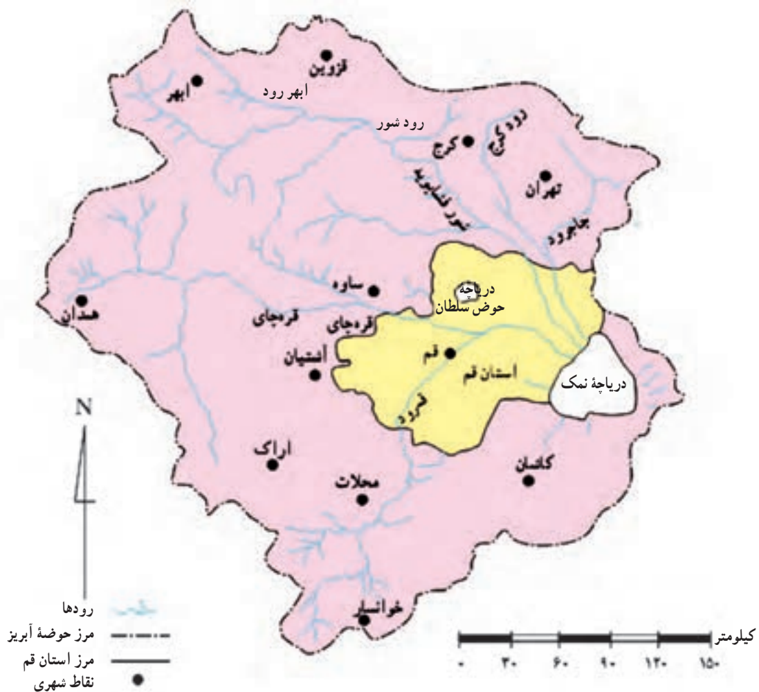
شکل ۱۲-۱- نقشه حوضه آبریز دریاچه نمک

به شکل ۱۲-۱ توجه کنید. در استان قم، دو رود اصلی قمرود و قره‌چای و چندین رود فرعی جریان دارد. رودهای فرعی به طور مستقیم یا غیرمستقیم به رودهای اصلی استان وارد می‌شوند. در اینجا به بررسی رودهای اصلی می‌پردازیم: ۱- قمرود: این رود از دامنه کوه‌های قلعه خلیل واقع در شهرستان فریدن واقع در ۴۰ کیلومتری غرب خوانسار سرچشمه می‌گیرد و پس از عبور از استان‌های اصفهان و مرکزی، به استان قم وارد می‌شود. این رود پس از عبور از دشت سلفچگان و نیزار، رودهای فرعی زواریان، قره‌سو، سلمان و درّه‌باغ به آن می‌پیوندند. قمرود پس از عبور از وسط شهر قم، (شکل ۱۳-۱) در ۲۲ کیلومتری شمال شرق شهر قم در محلی به نام پل دلاک به رود قره‌چای می‌پیوندد. اگر به شکل ۱۲-۱ نگاه کنید، متوجه می‌شوید که قمرود شعبه‌های متعددی در استان قم دارد. اغلب این رودها از ارتفاعات اردهال و سخت حصار سرچشمه می‌گیرند. طول قمرود ۲۸۸ کیلومتر است.