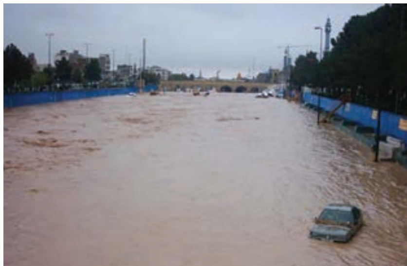
شکل ۳۰-۱- وقوع سیل در روز ۱۱ فروردین ۱۳۸۸

پ) سیل: به دلیل تخریب حوزه‌های آبخیز استان خسارات ناشی از سیل در استان در چند دهه اخیر در حال افزایش است به طوری که مردم بیشتر نواحی استان از سهم اندک خود از بارش‌های استان حداکثر خسارت را متحمل شده‌اند. قابل ذکر است بعد از سال ۱۳۷۰ انجام فعالیت‌های آبخیزداری و سایر اقدامات امنیتی نقش مؤثری در کاهش خسارات ناشی از سیل داشته است. شکل ۳۰-۱ وقوع سیل در شهر قم و طغیان آب رودخانه قمرود در فروردین ۱۳۸۸ را نشان می‌دهد.