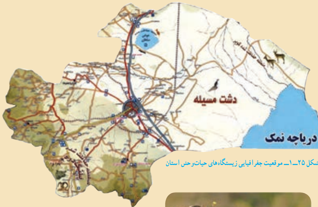
شکل ۲۵-۱- موقعیت جغرافیایی زیستگاه‌های حیات وحش استان

۴- تالاب شکار ممنوع حوض سلطان: این تالاب در شمال استان واقع شده و گونه‌های گیاهی و حیوانی متنوعی دارد. در شورابه‌های این تالاب نوعی میگو به نام «آرمیا» دیده می‌شود.