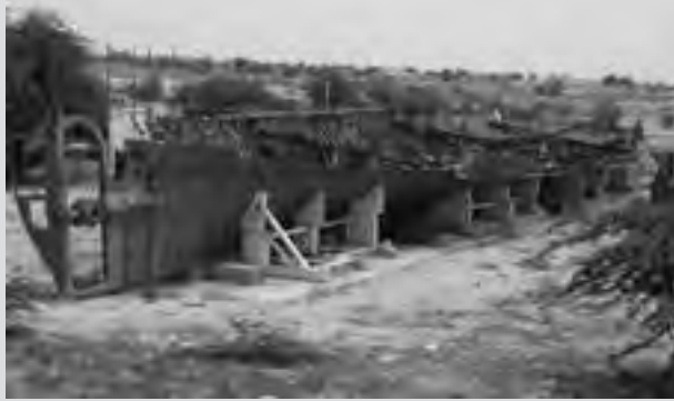
بیکره کشتی پرسبولیس در موزه دریانوردی استان بوشهر

دریای عمان یا به عبارتی خلیج عمان، پیشروی آب اقیانوس هند به داخل خشکی در جنوب غربی آسیاست که اهمیتش بیشتر به واسطه دسترسی به آب‌های آزاد بین‌المللی است. بنا بر برخی دیدگاه‌ها، نام دریای مُکران (عمان) برگرفته از سرزمین بلوچستان ایران و تمدن کهن آن بوده که بعدها به دلیل ویران شدن بنادر باستانی ایران، پس از حمله اعراب، به عمان تغییر کرده است. برخی معتقدند نام این دریا را پارسیان مُکران – مُکران که گویا تغییر یافته «مهی فوران» است و اروپاییان با تلفظ «Mecran» یا «Makran» به کار برده‌اند، بر آن نهاده‌اند.