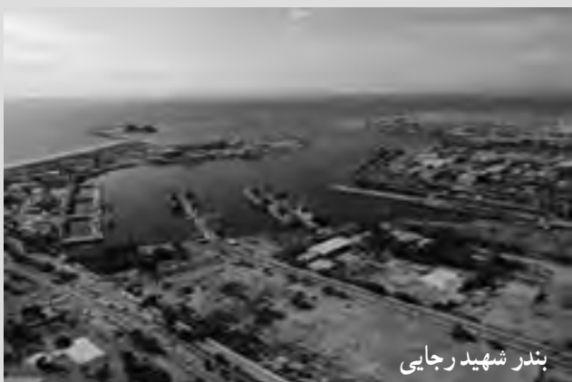
بندر شهید رجایی