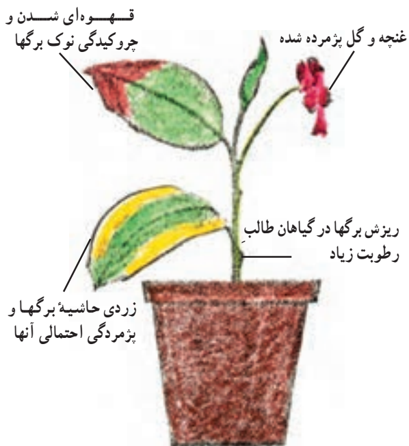
شکل ۱-۵۳ - علایم و خسارات کمبود در رطوبت نسبی هوا بر روی گیاهان آپارتمانی

– پاشیدن آب در هنگام عصر یا شب باعث می‌شود تا آب بر روی گیاه باقی بماند و تبخیر نشود و از تبادلات گیاه با محیط خارج جلوگیری کند.