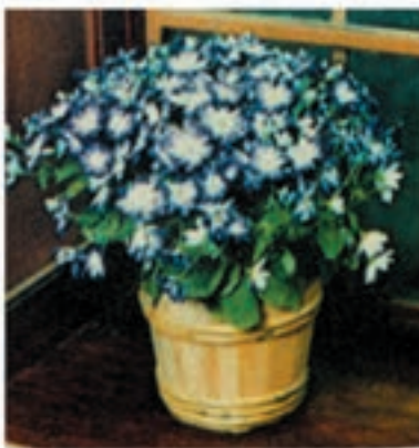
سینرره شکل ۱-۴۹-۱