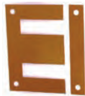
ورق نوع EI

هسته‌ی ترانسفورماتور متشکل از ورقه‌های نازک است که سطح آن‌ها با توجه به قدرت ترانسفورماتور محاسبه می‌شود. برای کم کردن تلفات آهنی، هسته‌ی ترانسفورماتور را نمی‌توان به‌طور یک‌پارچه ساخت. بلکه معمولاً آن‌ها را از ورقه‌های نازک فلزی که نسبت به یک‌دیگر عایق‌اند، می‌سازند. این ورقه‌ها از آهن بدون پسماند (ورق دیناموبلش) با آلیاژی از سیلیسیم (حداکثر ۴/۵ درصد) که دارای قابلیت هدایت الکتریکی کم و قابلیت هدایت مغناطیسی زیاد است ساخته می‌شوند. در اثر زیاد شدن مقدار سیلیسیم، ورقه‌های دیناموبلش شکننده می‌شود. برای عایق کردن ورق‌های ترانسفورماتور، قبلاً از یک کاغذ نازک مخصوص که در یک سمت این ورقه چسبانده