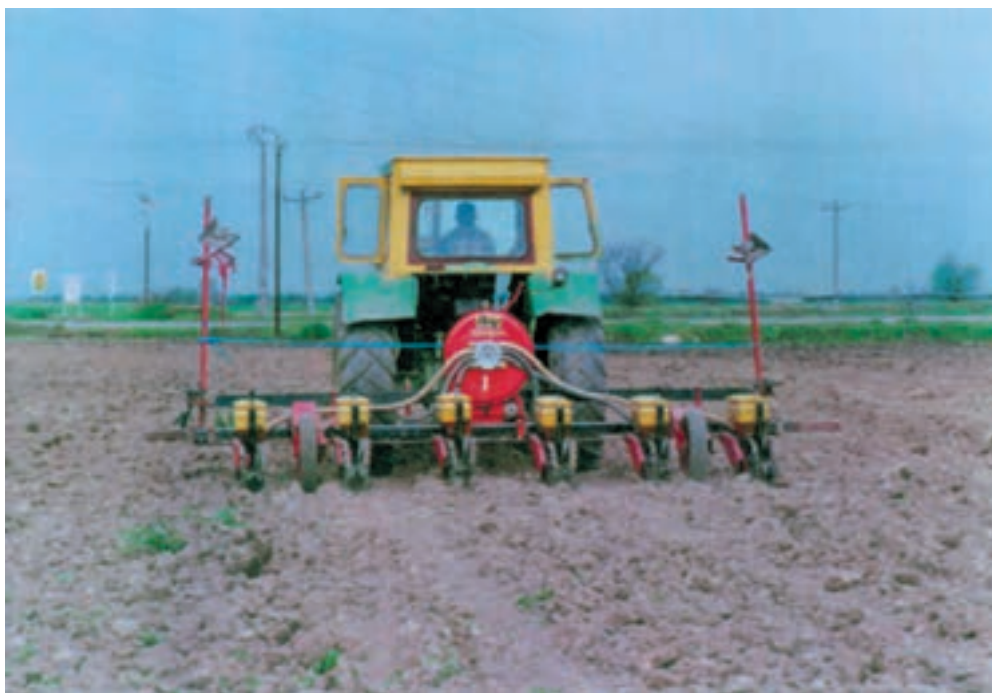
شکل ۴-۶- کاشت آفتابگردان با بذركار پنوماتيكي