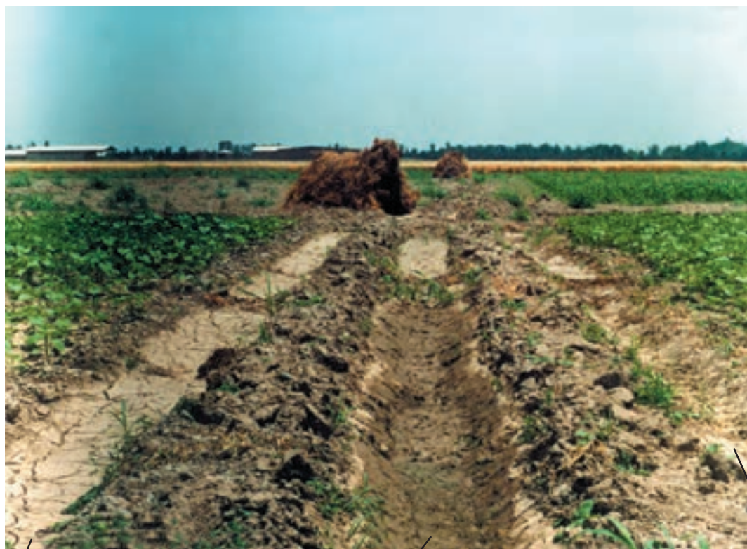
نهر زهکشی در پائین دست قطعه اول