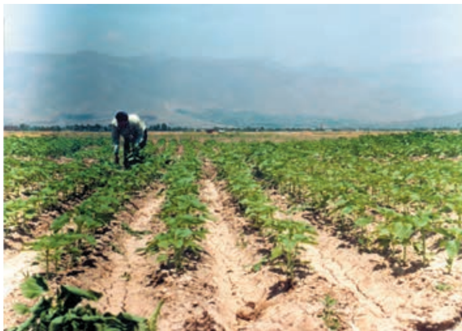
شکل ۵-۵- مزرعه‌ای که عملیات واکاری و تنک به موقع صورت گرفته و تراکم مطلوب ایجاد شده است.

اگر در انتخاب بذر، آماده‌سازی، تنظیم ماشین کارنده و آبیاری اول به دقت و ظرافت عمل کرده باشید معمولاً نیازی به این عملیات نخواهد بود.