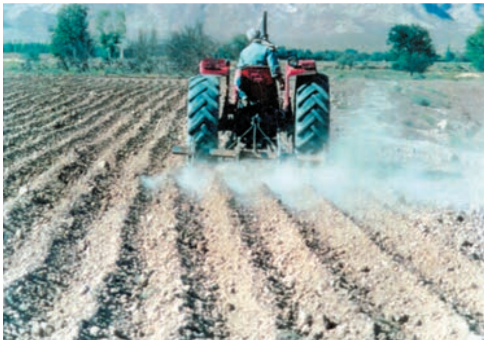
شکل ۴-۷- ايجاد جويچه‌هاي آبياري پس از بذركاري دستي