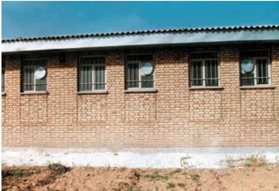
تصویر نمای خارجی یک جایگاه پنجره دار

تهویه در این روش بستگی به جهت قرار گرفتن جایگاه و پنجره‌های آن دارد.