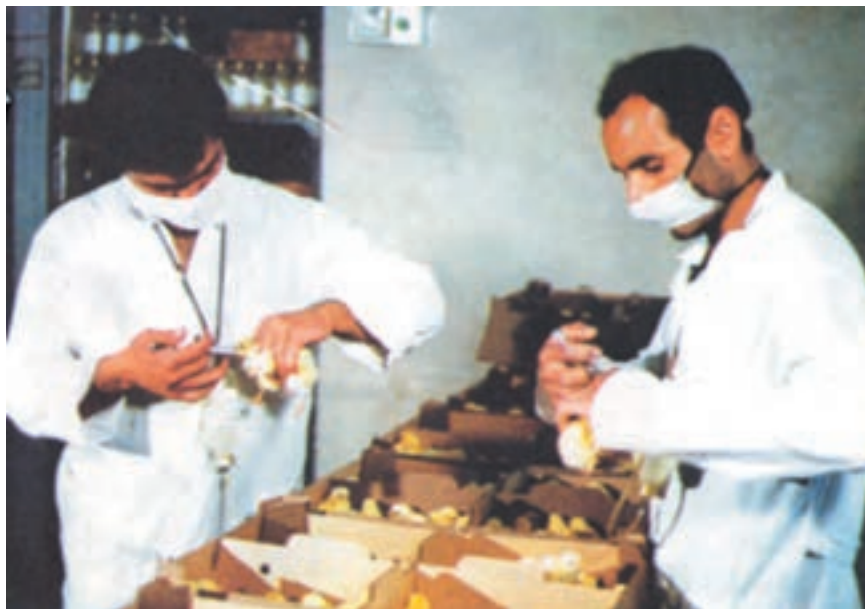
واکسیناسیون جوجه یکروزه در مؤسسات جوجه‌کنشی