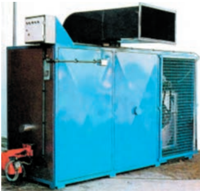
نمونه یک نوع هیتر

۲- مادر مصنوعی زمینی: مادرهای مصنوعی در این نوع، برعکس مادرهای آویز که حرارت از بالای سر جوجه توزیع می‌شود، منبع حرارتی در زمین قرار دارد و جوجه را گرم می‌کند. بدین ترتیب که از منبع حرارتی، گرما به وسیله آب گرم و یا هوای گرم، به کمک لوله‌هایی به داخل جایگاه فرستاده می‌شود. هیتر: امروزه در بسیاری از مرغداریها برای گرم کردن جایگاه از هیتر استفاده می‌شود. در این روش دستگاه تولیدکننده گرما در خارج از جایگاه قرار دارد و هوای گرم به واسطه کانال به داخل جایگاه فرستاده می‌شود و درجه حرارت داخل جایگاه با ترموستاتی کنترل می‌گردد.