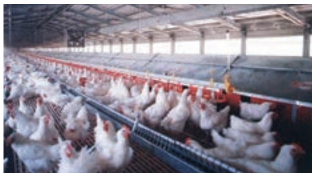
تصویر ۷-۳- لانه‌ی تخم‌گذاری اتوماتیک