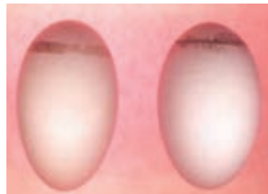
تصویر ۴-۳- تأثیر پرمنگنات زیاد بر روی تخم مرغ

برخی آلودگی‌های میکروبی مربوط به قبل از ورود تخم مرغ به جوجه کشی است و مقابله با آن‌ها در جوجه کشی غیرممکن است. یکی از خطرناک‌ترین این آلودگی‌ها باکتری سالمونلاست. این باکتری می‌تواند در پوسته‌ی تخم مرغ نفوذ کند و در مراحل جوجه کشی با وجود ضد عفونی شدن باقی بماند و بیماری را در جوجه‌های تولید شده ایجاد کند. به این لحاظ رعایت بهداشت تخم مرغ در گله‌ی مادر اهمیت زیادی دارد. تلاش کنید فاصله‌ی تخم‌گذاری تا جمع‌آوری تخم مرغ‌ها طولانی نشود. در سیستم‌های دستی، جمع‌آوری روزانه‌ی تخم مرغ‌ها را ۳ تا ۵ بار در فصل سرد و ۶ تا ۷ بار در فصل گرم اجرا کنید و یا از سیستم‌های جمع‌آوری اتوماتیک تخم مرغ استفاده کنید.