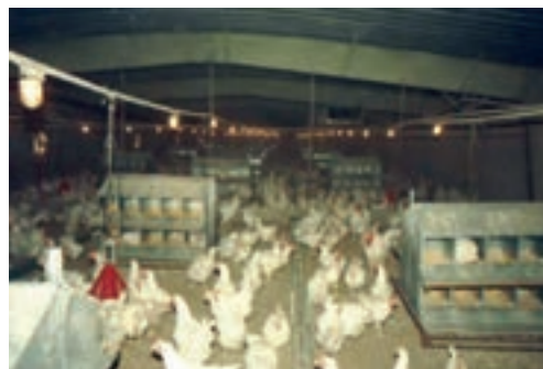
تصویر ۸-۳- استفاده از لانه‌ی مرغداری به تعداد کافی

این افراد برای ورود باید لباس خود را تعویض کنند و پس از گرفتن دوش و پوشیدن لباس کار، با چکمه‌های خود از داخل ماده‌ی ضدعفونی‌کننده عبور نمایند. کارکنان واحد جوجه‌کشی نباید در مرغداری‌ها شاغل باشند و یا در خانه‌ی خود از پرندنگهداری کنند. هم‌چنین برای رعایت بهداشت فردی باید به‌طور منظم به پزشک مراجعه کنند.