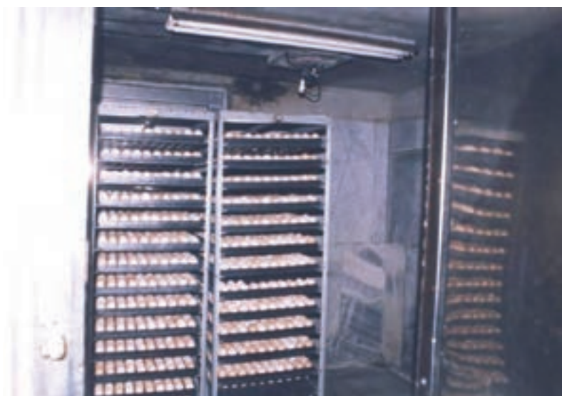
تصویر ۲-۳- تخم مرغ‌ها در اتاق دود

مقادیر فرمالین و پرمنگنات پتاسیم ذکر شده در جدول برای ۲/۸ متر مکعب فضا است.