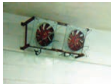
تصویر ۵-۳- ایجاد جریان هوا در اتاق دود