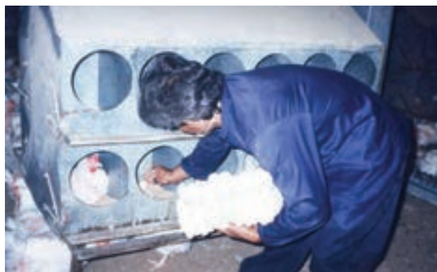
تصویر ۶-۳- جمع آوری دستی تخم مرغ