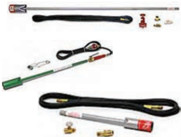
تصویر ۴-۶- انواع لوله‌ی حامل افشانک و افشانک

افشانک: ریز و پخش کردن سم وظیفه‌ی اصلی افشانک است. افشانک قسمت مهم دستگاه‌های سم‌پاش محسوب می‌شود و از چهار قسمت اصلی بدنه، درپوش، نُک و صافی تشکیل می‌شود. نُک قابل تعویض است و سم را با ظرفیت‌های متفاوتی و با اشکال گوناگون پخش می‌کند. (تصاویر ۴-۶ و ۵-۶)