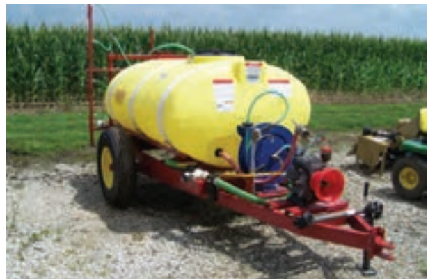
تصویر ۸-۶- سم پاش پشت تراکتوری

این سم پاش، بر روی شاسی سوارند و به تراکتور متصل می شوند. ظرفیت مخزن ۱۵۰ تا ۵۰۰ لیتر است (تصویر ۸-۶).