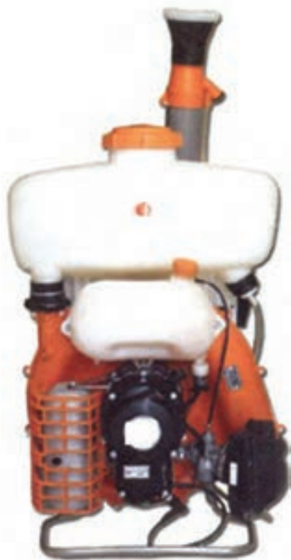
تصویر ۶-۶ - سم پاش پشتی موتوری