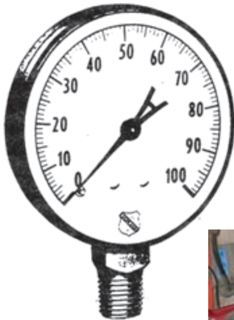
تصویر ۳-۶- فشارسنج

لوله های فلزی و لاستیکی انتقال: این لوله ها سم را در دستگاه سم پاش انتقال می دهند. در انتخاب لوله ها دقت کنید. زیرا فشار سم در قسمت های مختلف دستگاه متفاوت است و آن ها باید به اندازه ای قوی باشند که بتوانند در مقابل فشار زیاد مقاومت کنند.