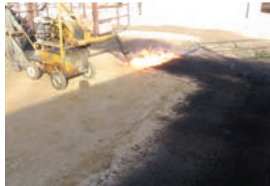
تصویر ۱۰-۶- شعله افکنی محوطه

۶- دقت کنید کارگری که با دستگاه کار می کند مسائل ایمنی را رعایت نماید (تصویر ۱۰-۶).