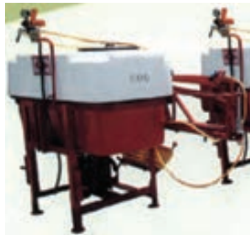
شکل ۱-۶- انواع دستگاه سم پاش