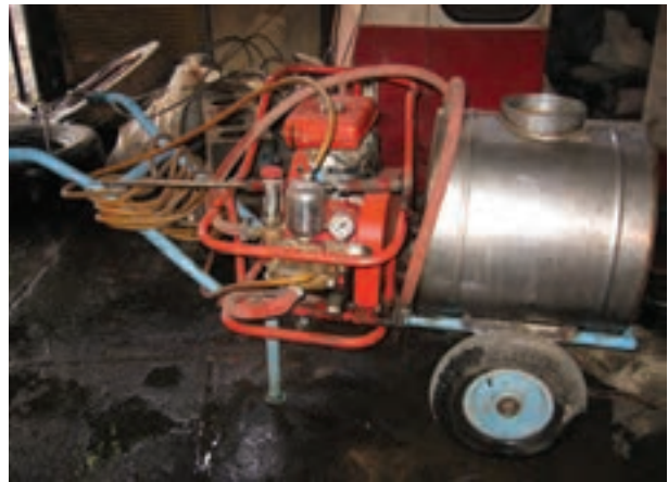
تصویر ۷-۶- سم پاش چرخ دار موتوری

۵- در صورتی که مدت زمان طولانی نیازی به استفاده از سم پاش ندارید، ۱ تا ۲ سانتی متر روغن موتور به درون سیلندر بریزید. لازم است قبل از گذاردن شمع، یک بار استارت را بکشید و رها کنید. به این ترتیب تمام سطح سیلندر روغن کاری می شود. هم چنین افشانک ها و فیلترها را باز کنید و در مکانی مطمئن قرار دهید.