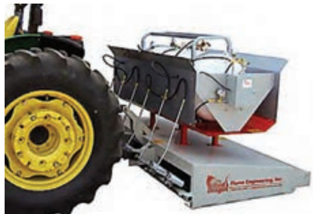
تصویر ۹-۶- انواع شعله افکن