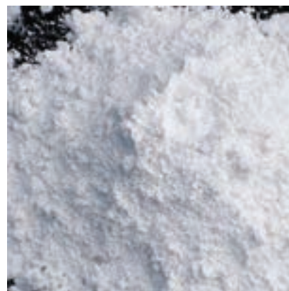
شکل ۱۷-۲- کربنات کلسیم

ممکن است به طور طبیعی سنگ آهک حاوی فلزات سنگین باشد، که تولیدکنندگان موظف اند این محصول را از این نظر تضمین کنند.