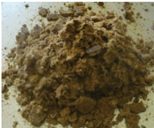
شکل ۱۲-۲ کنجالت تخم پنبه

درصد و فسفر قابل استفاده آن ۳/۰ درصد است.