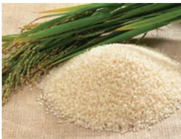
شکل ۲-۵ دانه برنج

برنج دارای مقدار زیادی بازدارندهٔ تریپسین است که با حرارت معمولی از بین می‌رود.