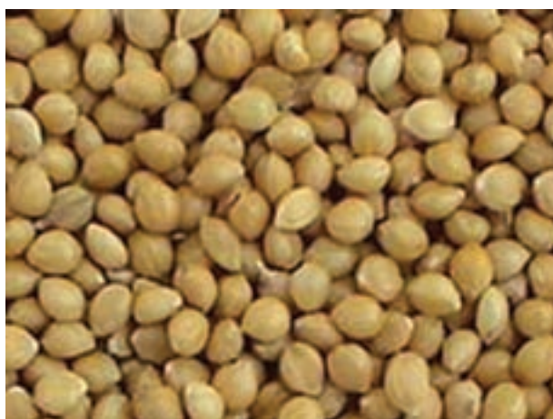
شکل ۲-۶ دانه ارزن

ارزن: میزان انرژی ارزن بالاست، اما قبل از مصرف باید عمل آوری شود. به علت داشتن مقدار بالایی از الیاف غیر قابل هضم، باید از استفاده آن در تغذیه پرندگان جوان اجتناب کرد. مقدار انرژی قابل سوخت و ساز و پروتئین ارزن حدود ۲۷۰۰ تا ۲۹۰۰ کیلوکالری و ۱۱ تا ۱۴ درصد در واریته‌های مختلف است.