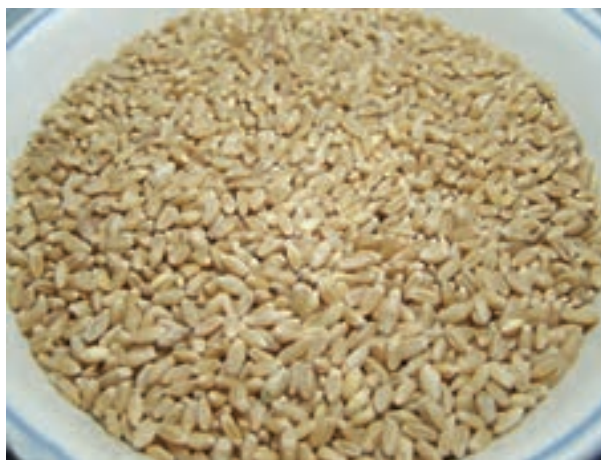
شکل ۲-۴ دانه گندم

فیبر زیاد و ماهیت فیزیکی سبوس گندم استفاده از آن را در جیره طیور محدود می‌کند. جیره‌های حاوی سبوس زیاد به رطوبت فضولات می‌افزاید و هزینه حمل و نقل این جیره‌ها به علت حجیم بودن آنها بیشتر می‌شود.