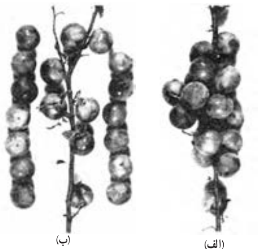
شکل ۵۶ - ۳

در شکل ۵۷ - ۳ میوه‌های یک شاخه هلو قبل از تنک و در شکل ۵۸ - ۳ میوه‌های همان شاخه را پس از تنک مشاهده می‌کنید که بین دو میوه مجاور هم حدود ۱۵ تا ۲۲ سانتیمتر فاصله وجود دارد. در تنک سیب نیز این فاصله حدود ۱۵ تا ۲۰ سانتیمتر است (شکل ۵۹ - ۳).