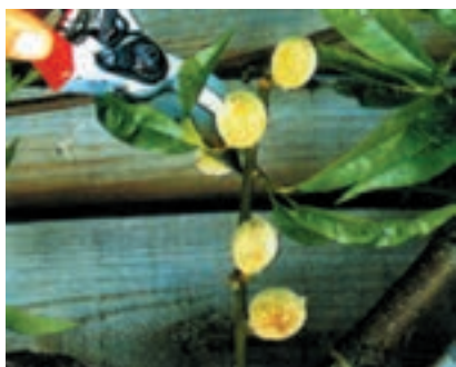
شکل ۵۸ - ۳