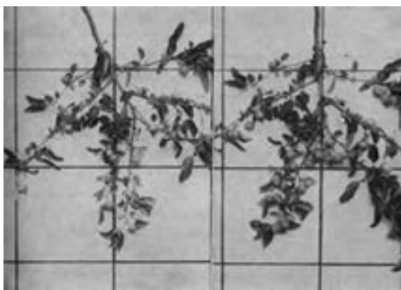
شکل ۵۹ - ۳