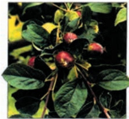
شکل ۵۵-۳ ب