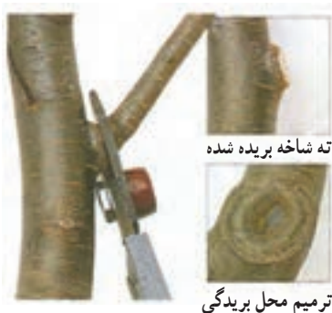
شکل ۳-۴۵ - طرز برش در شاخه نسبتاً قطور

هرس و پیوند انجام گرفته است و در شکل ۳-۴۳ همان درخت را پس از گذشت ۶ سال مشاهده می کنید.