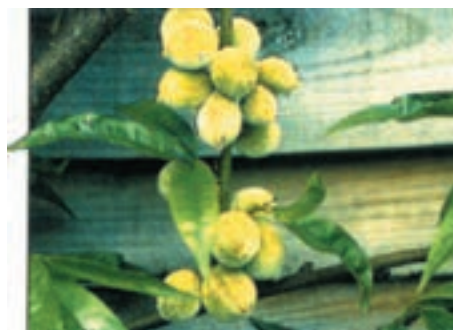
شکل ۵۷ - ۳