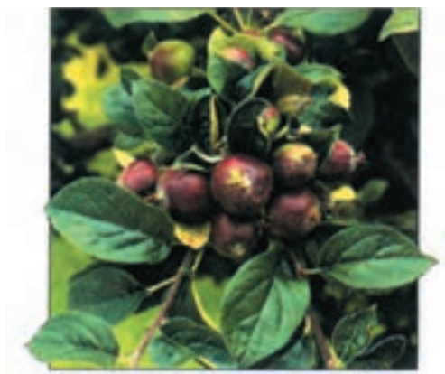
شکل ۵۵-۳ الف

در شکل ۵۴-۳ تنک گل، در شکل‌های ۵۵-۳ الف و ب میوه‌های روی یک شاخه درخت سیب قبل و بعد از تنک و نیز در شکل‌های ۵۶-۳ الف و ب میوه‌های روی یک شاخه آلو قبل و بعد از تنک مشاهده می‌شوند.