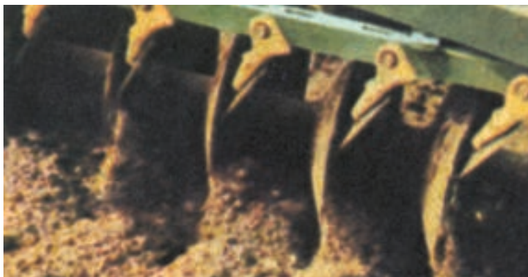
شکل ۱۲-۳- با دیسک مخلوط سم با خاک مخلوط می‌شود.

گزارش دهید: از چگونگی مصرف کودهای پایه و مصرف علف‌کش‌های قبل از کاشت و نیز مباحث، تحقیقات و اطلاعات جمع‌آوری شده خود گزارش ارائه دهید.