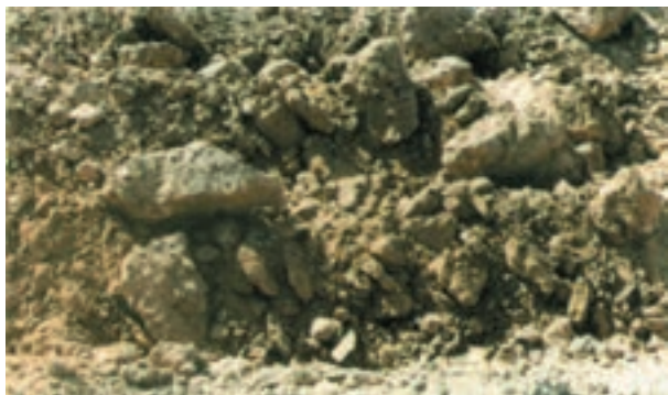
شکل ۵-۳- تنظیم نبودن و رعایت نکردن شرایط اجرای شخم باعث عدم تأمین اهداف شخم می‌شود.

در فرآیند آماده‌سازی زمین یا تهیه‌ی بستر مناسب کاشت، شخم یکی از مهمترین مراحل است. اجرای شخم بدون رعایت زمان، شرایط و عمق مناسب، نه تنها ممکن است هدفهای شخم را تأمین نکند، امکان دارد به احتمال زیاد خسارات زیادی به زمین و زارع وارد آورد. اصول کلی شخم را در مهارت آماده‌سازی زمین فراگرفته‌اید. بنابراین در این جا، صرفاً به ویژگی‌هایی از شخم که با زراعت پنبه مرتبط است، پرداخته می‌شود.