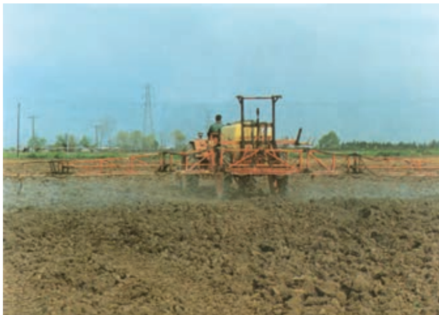
شکل ۱۱-۳- مصرف علف‌کش قبل از کاشت در اغلب شرایط، مطلوب و مقرون به صرفه است.

مقدار سم را فقط کارشناسان حفظ نباتات تعیین می‌کنند.