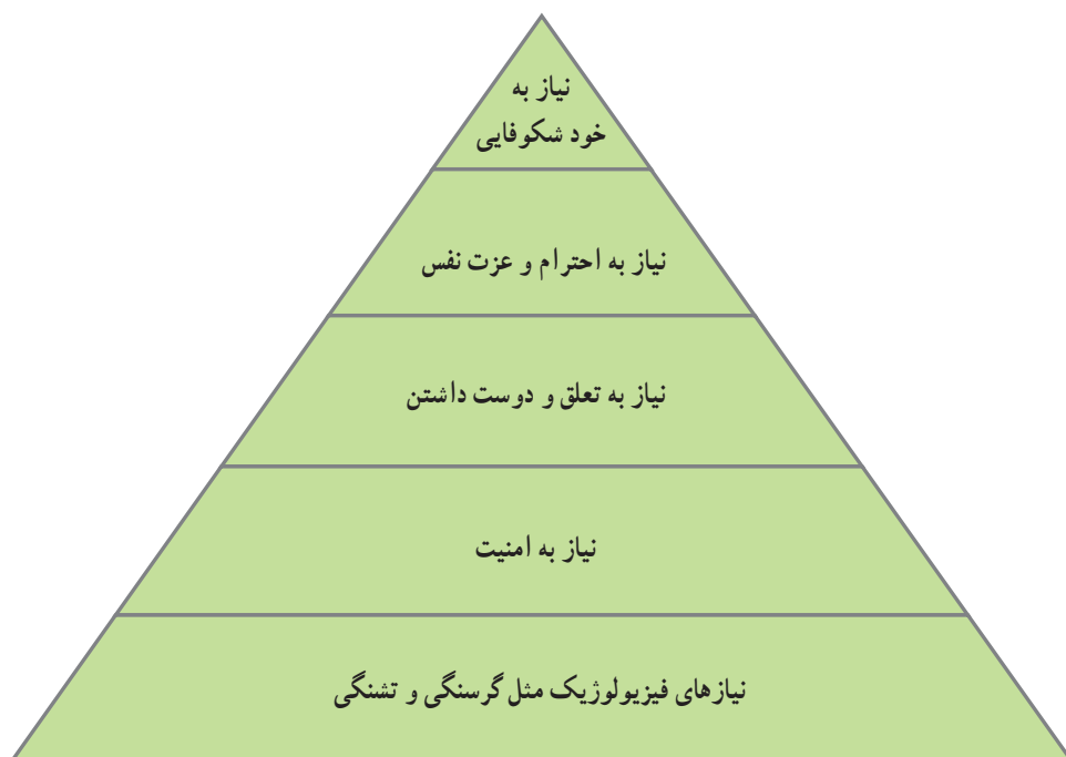
تصویر ۱-۳ — سلسله مراتب نیازهای ارائه شده توسط ابراهام مازلو

این رویکرد، روان‌شناسان را ترغیب کرده تا به این نکته واقف گردند که فراسوی رفتار قابل مشاهده، حقایق دیگری نهفته است که از طریق روش‌های علمی مرسوم امکان بررسی و فهم آن‌ها امکان‌پذیر نمی‌باشد. رویکرد انسان‌گرا با اتخاذ یک نگاه مثبت به رفتار انسانی و تأکید بر پذیرش مسئولیت فردی تا حدودی توانسته است دیدگاه‌های جبرگرایانه‌ی روش‌های علمی مرسوم را به چالش بکشد.