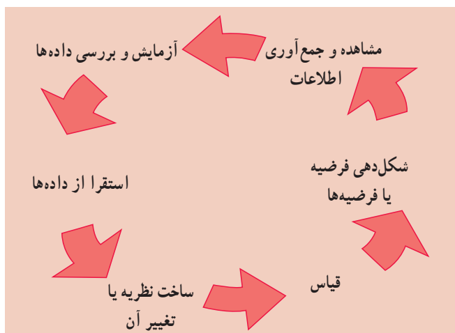
تصویر ۱-۱- فرایند استقرار - قیاس

مشاهدات اولیه، یک حدس اولیه‌ی قابل بررسی تجربی درباره‌ی پدیده‌ی موردنظر ارائه می‌دهد. چنین حدس‌های اولیه را فرضیه ۱ می‌نامند. به طور مثال، در صورت مشاهده‌ی دقیق رفتار کودکان، روان‌شناس ممکن است حدس اولیه‌ای در خصوص رفتار پرخاشگرانه‌ی کودکان مبنی بر این که احتمالاً رفتار پرخاشگرانه‌ی کودکان ناشی از تماشای خشونت باشد یا ممکن است این رفتار از طریق تماشای برنامه‌های تلویزیونی دارای خشونت به وجود آمده باشد، مطرح سازد. در این جا فرضیه‌ی او به صورت زیر می‌باشد: تماشای خشونت منجر به رفتار پرخاشگرانه در کودکان می‌شود. پس از ارائه‌ی این فرضیه، روان‌شناس بایستی از طریق جمع‌آوری اطلاعات و آزمایش و بررسی، داده‌های تأیید کننده‌ی فرضیه‌ی خود را ارائه دهد. پس از این که به اندازه‌ی کافی شواهد تجربی برای تأیید فرضیه‌ی خود جمع‌آوری کرد، او در مرحله‌ی تأیید یا عدم تأیید نظریه یا تئوری خود می‌باشد. در صورت عدم تأیید نظریه، روان‌شناس باید در نظریه‌ی خود تجدیدنظر کند و یا این که نظریه‌ی جدیدی را ارائه دهد. همان‌گونه که ملاحظه می‌شود در ارائه‌ی یک نظریه از دو فرایند مکمل یک‌دیگر، یعنی استقرار و قیاس استفاده می‌شود که این فرایند در تصویر ۱-۱ ارائه شده است.