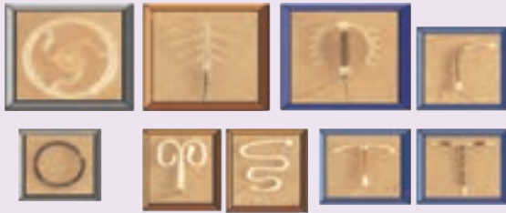
انواع آی - یو - دی