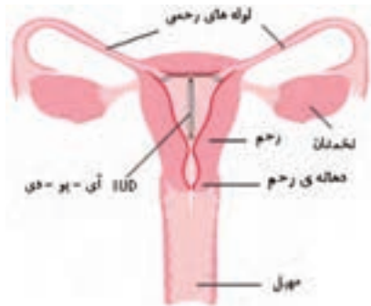
آی - یو - دی در رحم

از خود هورمون ترشح می‌کند و حدود ۹۹٪ در پیشگیری از بارداری مؤثر است.