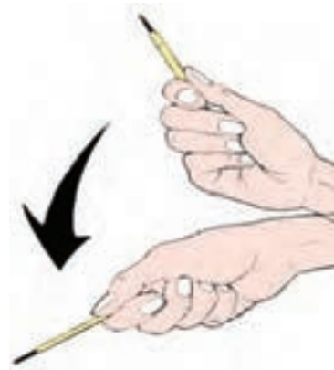
نحوه‌ی استفاده از دماسنج