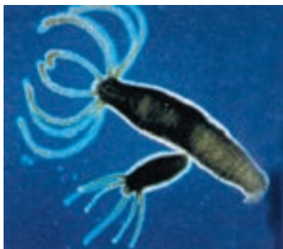
شکل ۴-۷- تولید مثل غیر جنسی هیدر

تولید مثل جنسی: در این نوع تولید مثل برخلاف تولید مثل غیر جنسی، دو والد شرکت دارند که هر کدام سلول‌های جنسی هاپلوئید تولید می‌کنند. سلول‌های جنسی با یکدیگر ادغام می‌شوند و فرزند را به وجود می‌آورند. از آنجا که هر دو والد ماده ژنتیک خود را به اشتراک می‌گذارند، فرزندان از هر دو والد صفت‌هایی دریافت خواهند داشت، بنابراین هیچ فرزندی دقیقاً مشابه یکی از دو والد نیست. تولید مثل جنسی، از طریق تشکیل سلول‌های هاپلوئید، در یوکاریوت‌ها دیده می‌شود.