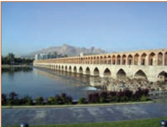
سی و سه پل اصفهان

صفویان وارث میراث غنی فکری و فرهنگی گذشته ایران بودند. وجود امنیت و ثبات سیاسی، بهبود اوضاع اقتصادی به‌ویژه در عصر شاه عباس اول، و نیز حمایت مادی و معنوی شاهان و حاکمان از عالمان، دانشمندان و هنرمندان، زمینه و شرایط لازم را برای شکوفایی علم و هنر در آن دوره فراهم آورد.