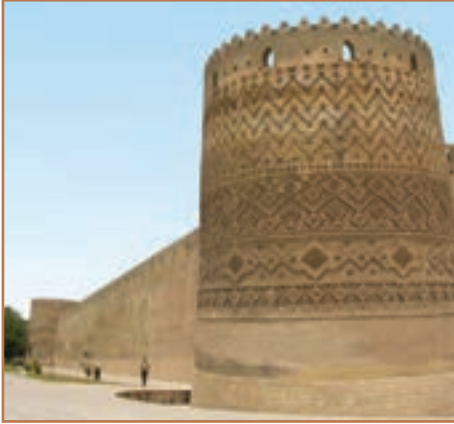
ارگ کریم خانی

بروز جدال و ستیز میان بازماندگان کریم خان، بر سر قدرت، توان نظامی و اقتصادی حکومت زندیه را کاهش داد و زمینه را برای قدرت‌یابی آقامحمدخان قاجار در نواحی شمالی ایران فراهم آورد. لطفعلی خان آخرین فرمانروای خاندان زند، اگر چه در جنگاوری و شجاعت و دلاوری سرآمد بزرگان روزگار خویش بود، اما به سبب جوانی و کم‌تجربگی، دوستان و اطرافیان خود را