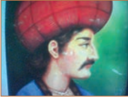
شاه اسماعیل اول صفوی

اگرچه نخستین کوشش‌های سیاسی و نظامی صفویان به بهای قتل شیخ جنید، شیخ حیدر و شماری از مریدان آنان در صحنه جنگ انجامید، اما تجربه خوبی برای نهضت صفوی در راه کسب قدرت سیاسی بود. اندکی بعد، قزلباشان، به دور اسماعیل فرزند شیخ حیدر گرد آمدند. آنان پس از پیروزی در چند جنگ