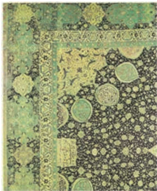
قالی اردبیل مربوط به دوره صفوی