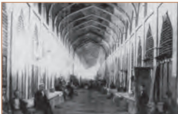
بازار وکیل — شیراز

بی‌مهری نادرشاه نسبت به عالمان شیعه و هنرمندان، باعث مهاجرت گسترده آنان به عتبات عالیات و هند، و در نتیجه رکود فعالیت‌های علمی و فرهنگی شد. مرگ نادر و ستیز افراد و گروه‌های مختلف برای رسیدن به قدرت، نیز اوضاع سیاسی و اجتماعی و اقتصادی ایران را آشفته‌تر کرد. آرامش، امنیت و ثبات نسبی که در دوران کریم‌خان زند بر بخش‌هایی از ایران حکمفرما گردید، موجب شد که اوضاع اجتماعی، اقتصادی و فرهنگی کمی بهتر شود. بر اثر حمایت و تشویق کریم‌خان، فعالیت‌های عمرانی، کشاورزی و بازرگانی تا حدودی رونق یافت. گروهی از عالمان و هنرمندان مهاجر، به ایران بازگشتند و شهرهای شیراز و اصفهان بار دیگر کانون علم و ادب و هنر شدند.