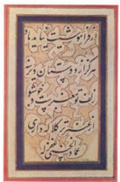
نمونه‌ای از خط میرعماد خوشنویس دوره صفوی

در عصر صفوی، هنر ایرانی نیز رونق و شکوفایی یافت. معماری از جلوه‌های اصلی هنر آن دوره بود. ساخت کاخ‌ها، پل‌ها، کاروانسراها، مدارس، مساجد، مقبره‌ها، کلیساها و باغ‌ها نه تنها به عمران و آبادانی کشور کمک کرد، بلکه سبک و شیوه جدیدی در هنر معماری پدید آورد. اوج شکوفایی معماری صفوی در اصفهان، پایتخت صفویان متجلی شد و خاطره و شکوه شهرهایی چون تخت جمشید، تیسفون و سمرقند را زنده کرد. هنر نقاشی نیز مورد حمایت جدی دربار صفوی بود. در آن دوره، هنرمندان برجسته‌ای نظیر کمال‌الدین بهزاد، رضا عباسی و میرعماد پرورش یافتند و آثار ارزنده‌ای در رشته‌های مختلف هنری خلق کردند. هنرهای کتاب‌سازی، جلدسازی، تذهیب، خطاطی، خوشنویسی، سفال‌سازی، فلزکاری، فرش‌بافی نیز از دیگر هنرهای بودند که در عصر صفوی رونق بسزایی داشتند.