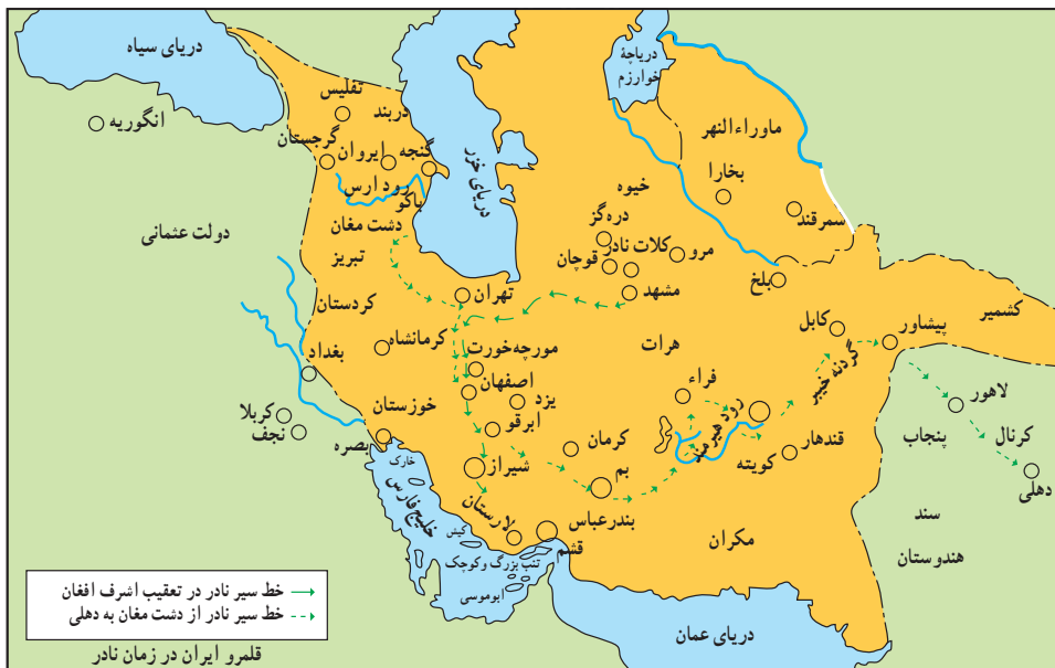
قلمرو افشاریان (نادرشاه)