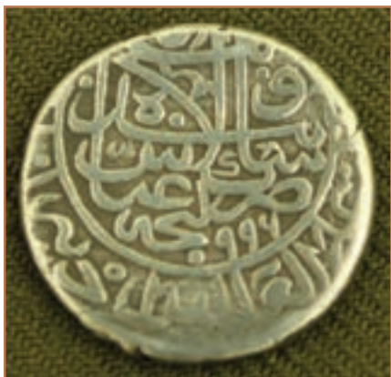
سکه دوره شاه عباس

۴- بهبود اوضاع اجتماعی، اقتصادی و فرهنگی از طریق ایجاد امنیت، آرامش و ثبات سیاسی؛ ۵- انتصاب افراد با کفایت و در عین حال گمنام به سمت‌های سیاسی، اداری و نظامی.