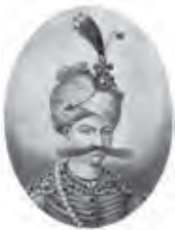
شاه عباس اول صفوی