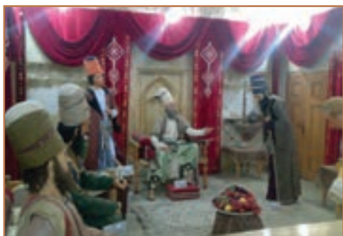
دربار کریم خان زند

کریم خان یکی از افراد ایل زند بود که بعد از یک دوره بیست ساله جنگ و گریز بر دیگر مدعیان