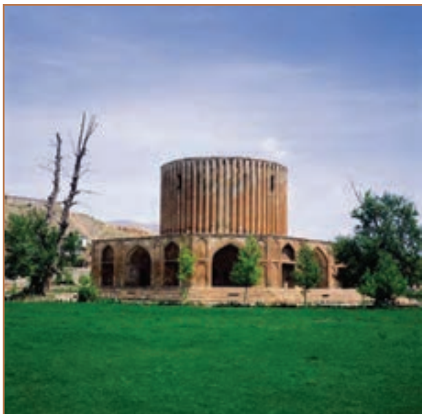
کاخ نادر در کلات مشهد