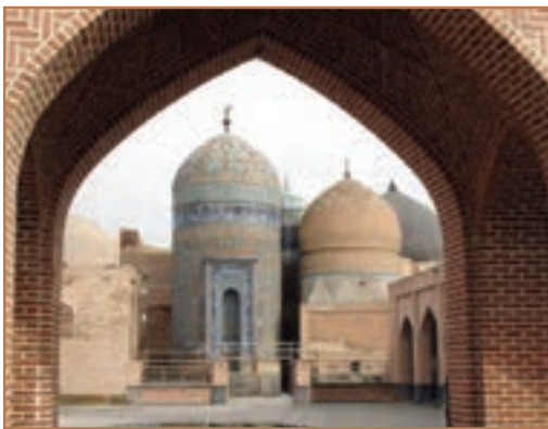
بقعه شیخ صفی‌الدین اردبیلی در شهر اردبیل

هجوم مغولان و تشکیل حکومت ایلخانان در ایران دو پیامد مذهبی و اجتماعی مهم را به همراه داشت که در درازمدت زمینه را برای تشکیل سلسله صفویه فراهم کرد: الف) هرج و مرج اجتماعی و نابسامانی اقتصادی زمینه گسترش دنیاگریزی و رونق جریان تصوف را فراهم آورد. ب) در نتیجه دگرگونی سیاسی و فرهنگی، شیعیان فرصت یافتند تا اندیشه‌های شیعه را در ایران تبلیغ و ترویج کنند.