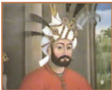
شاه تهماسب اول صفوی

شاه تهماسب به تدریج زمام قدرت را به دست گرفت و به خودسری سران قزلباش پایان داد. او همچنین از بکان را شکست داد و با اتخاذ تدابیر مناسب، مانع موفقیت سپاه عثمانی در هجوم‌های مکرر به قلمرو ایران شد. ۱ در نتیجه چنین تدابیری بود که امپراتور عثمانی دست از جنگ برداشت و با انعقاد قرارداد آماسیه، برای مدتی میان دو کشور صلح برقرار شد. بدین گونه شاه تهماسب توانست با اتخاذ تدابیر