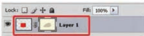
شکل ۶-۲۳-جابه‌جای ماسک لایه