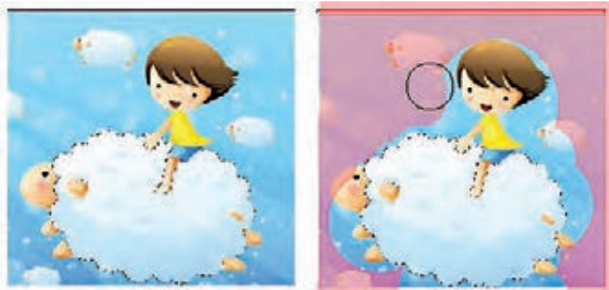
شکل ۴-۲۳ افزایش و کاهش ناحیه انتخاب با استفاده از Quick Mask

۵. تغییرات مورد نظران را بر روی تصویر بدهید. تغییرات تنها در ناحیه انتخاب شده اعمال می‌شود. ۶. گزینه Select | Deselect را برای خارج کردن ناحیه انتخاب شده از حالت انتخاب، کلیک کنید یا این که ناحیه انتخاب شده را ذخیره کنید.