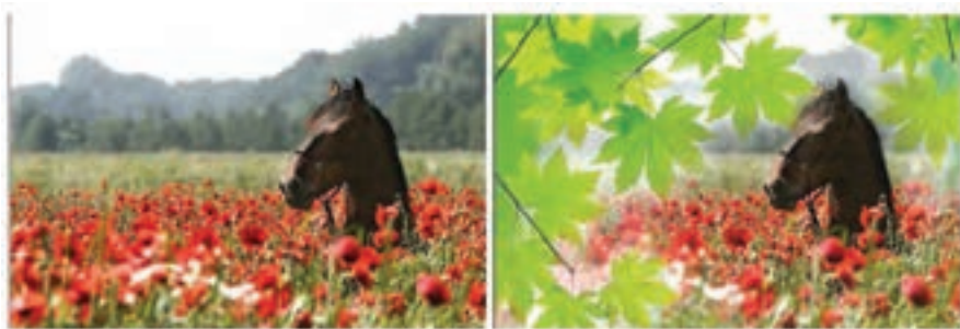
شکل ۵-۲۳ ترکیب دو تصویر با استفاده از Mask