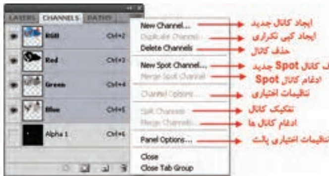
شکل ۳-۲۳ دستورهای منوی کانال

می‌توانید در یک تصویر با مد CMYK کانال‌های رنگی تصویر را از هم جدا کنید و سپس کانال‌ها را جدا از هم ذخیره کنید یا کانال‌های جدا شده را با هم ادغام کنید. در شکل ۳-۲۳ تصویری دیده می‌شود که کانال‌های رنگی آن از هم جدا شده‌اند. (شکل ۳-۲۳)