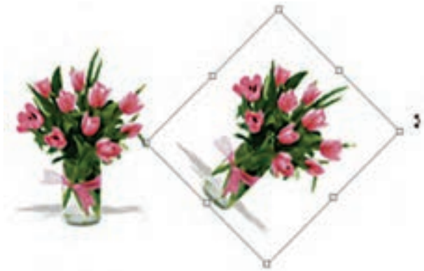
شکل ۷-۱۸ چرخاندن تصویر (Rotate)

برای این منظور در بخش دستورهای Transform گزینه‌ای به نام Rotate قرار داده شده است که با استفاده از آن می‌توانید کل تصویر یا بخش‌هایی از آن را با زاویه‌های مختلف و در جهت‌های مختلف چرخش دهید. برای این منظور متناسب با نیاز خود یکی از گزینه‌های ۱۸۰ Rotate (چرخاندن به اندازه ۱۸۰ درجه)، Rotate ۹۰ CW (چرخاندن به اندازه ۹۰ درجه در جهت عقربه‌های ساعت)، Rotate ۹۰ CCW (چرخاندن به اندازه ۹۰ درجه در خلاف جهت عقربه‌های ساعت) را اجرا کنید. (شکل ۷-۱۸)