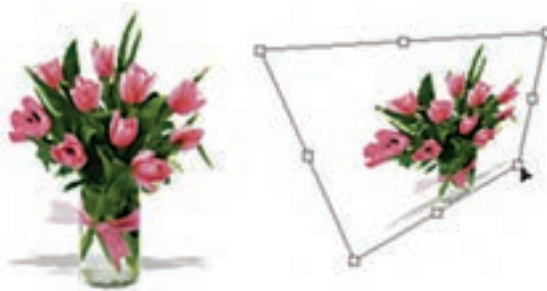
شکل ۱۸-۹ به هم ریختن تصویر

با استفاده از این دستور در Photoshop می‌توان عملی مشابه دستور Skew را انجام داد ضمن این که تا حدودی این دستور عمل تغییر مقیاس یا اندازه را نیز انجام می‌دهد. با این تفاوت که در این جا وقتی مورد نظر در اطراف تصویر مورد نظر ایجاد می‌شود هنگامی که اقدام به کشیدن دستگیره‌های موجود می‌کنید این امکان به شما داده می‌شود که آن را به طرف گوشه مقابل نیز جابجا کنید. به طور کلی از این دستور برای به هم ریختن فرم اصلی یک تصویر و افقی کردن در جهات مختلف استفاده می‌شود. (شکل ۱۸-۹)