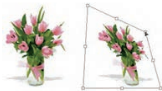
شکل ۱۸-۸ کج کردن تصویر (Skew)