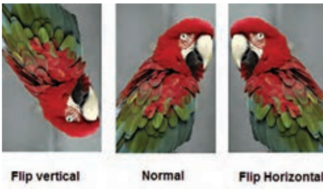
شکل ۱۸-۱۲ قرینه کردن تصویر

با استفاده از این گزینه در بخش Transform می توان محدوده انتخاب شده تصویر را قرینه کرد. در حقیقت این گزینه می تواند در دو جهت افقی (Horizontal) و عمودی (Vertical) عمل قرینه کردن را انجام دهد. یکی از کاربردهای ویژه دستور Flip را می توان در آینه کردن تصاویر یا قرینه کردن آن ها دانست. (شکل ۱۸-۱۲)