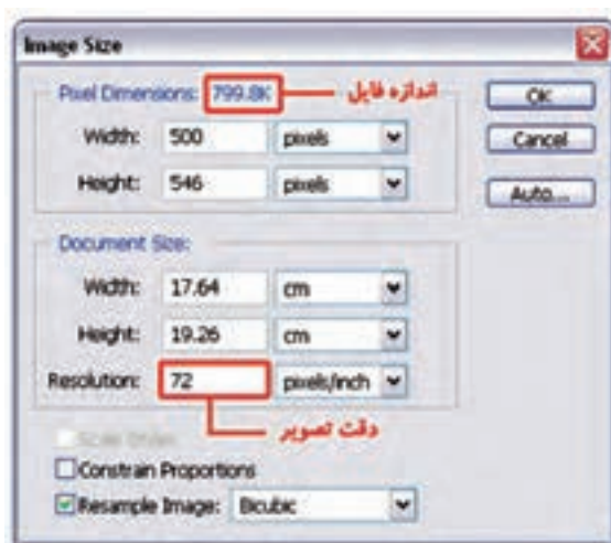
شکل ۳-۱۸ تغییر دقت تصویر و رابطه آن با حجم فایل

برای این‌که مشاهده کنید تفاوت Resolution تصویر که ما به آن دقت تصویر می‌گوییم چه تأثیری بر حجم فایل دارد به مثال زیر توجه کنید: (شکل ۳-۱۸)