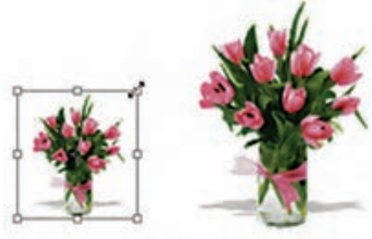
شکل ۶-۱۸ تغییر اندازه (Scale)

با اجرای دستور Scale در اطراف بخش انتخاب شده محدوده‌ای ایجاد می‌شود که دارای دستگیره‌های مختلفی برای تغییر اندازه در جهت‌های مختلف است و شما می‌توانید با پایین نگه داشتن کلید Shift و کشیدن یکی از گوشه‌های آن به‌طور متناسب بخش انتخاب شده را تغییر مقیاس دهید. برای اعمال تغییرات از کلید Enter یا دابل کلیک در داخل محدوده مورد نظر استفاده کنید. (شکل ۶-۱۸)