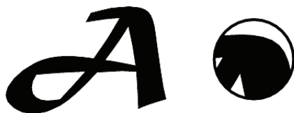
شکل ۲-۱۸ وضعیت پیکسل‌ها هنگام بزرگ کردن تصاویر برداری

شود هیچ گونه تأثیری بر کیفیت آن‌ها نخواهد داشت. (شکل ۲-۱۸) اما مهم‌ترین عیب این گونه نرم‌افزارهای گرافیکی آن است که برای ویرایش تصاویر با درجه رنگی پیوسته مناسب نمی‌باشند.