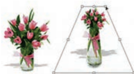
شکل ۱۸-۱۰ پرسپکتیو به تصویر

به کمک این دستور می‌توان بخش انتخاب شده یا کل یک تصویر را دارای عمق و زاویه دید مشخصی کرد. این گزینه یکی از مفیدترین و کاربردی‌ترین دستورهایی بخش Transform است، به طوری که با اجرای آن و با ایجاد کادر انتخاب مورد نظر در اطراف تصویر کاربر می‌تواند با استفاده از دستگیره‌های موجود در این کادر به تصویر خود عمق و زاویه خاص بدهد. ضمن این که در این دستور با تغییر دادن یک گوشه و جابه‌جا کردن آن، گوشه مقابل آن نیز متناسب با این گوشه تغییر خواهد کرد. این تفاوت اصلی‌ترین تفاوت این دستور با دستور Distort می‌باشد. (شکل ۱۸-۱۰)