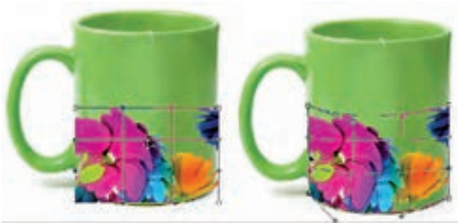
شکل ۱۸-۱۱ دستور Warp

از ویژگی های این شبکه تور مانند، قابلیت انعطاف آن علاوه بر محور X و Y در جهت محور Z می باشد. همین قابلیت باعث ایجاد حجم و تغییرات سه بعدی در ساختار تصویر می گردد.