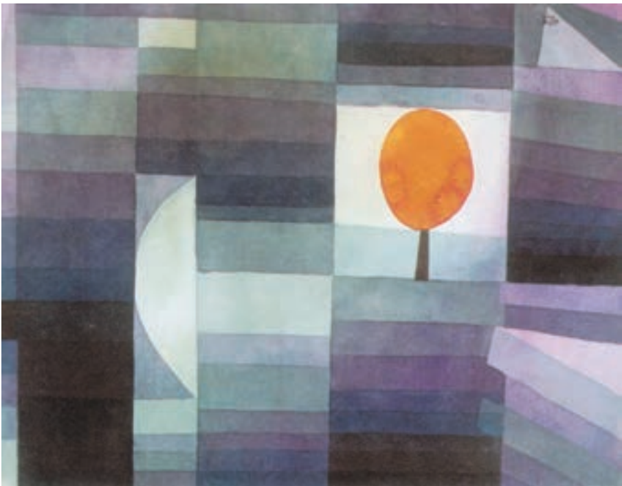
ترکیب غیر قرینه در تابلوی پیام آور پاییز اثر پل کله

در ترکیب غیر قرینه عناصر موجود در تصویر بر اساس ارزش‌های بصری خودشان مثل رنگ، تیرگی، روشنی، بافت و... در کادر قرار می‌گیرند نه بر اساس محورهای عمودی، افقی و مورب کادر.