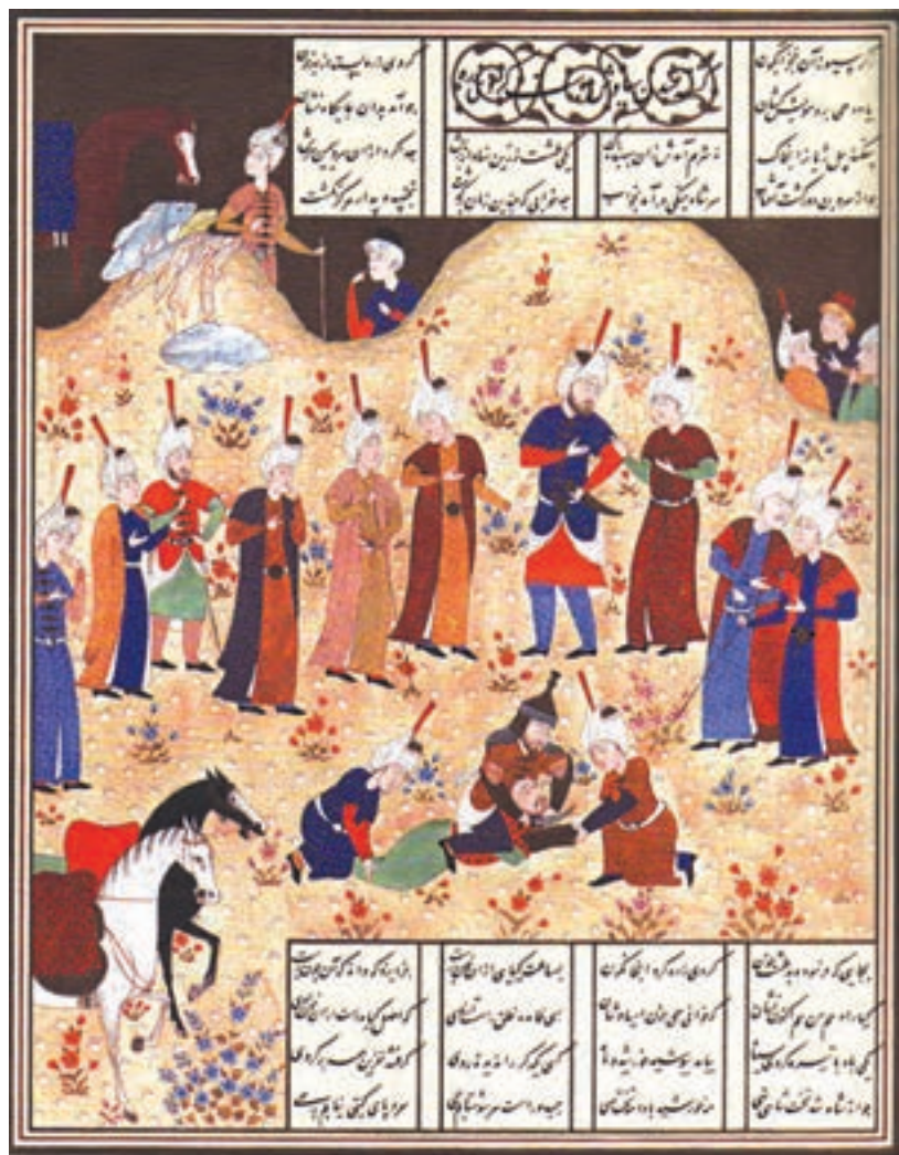
کشته شدن سیاوش، شاهنامه بایسنغری

۶. عامل مفروض: عنصر پر قدرتی که سایر عوامل موجود در کادر را در اطراف خودش سازماندهی می کند. برای آشنایی بیش تر با اصول نظام دهنده، به بررسی آن ها در اثر زیر می پردازیم: تصویر زیر صحنه ی کشته شدن سیاوش، از نگاره های شاهنامه ی بایسنغری است که اصول نظام دهنده ی آن عبارتند از: