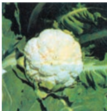
شکل ۸-۱- گل کلم

پاره‌ای از سبزیجات مانند کرفس، گل کلم، ریواس، مارچوبه و ... باید قبل از مصرف سفید گردند تا از نظر طعم و لطافت قابل استفاده شوند. برای این منظور باید به طرق مختلف از رسیدن نور خورشید به قسمت مورد نظر جلوگیری نمود که این عمل را «سفید کردن» می‌گویند (شکل‌های ۸-۱ و ۸-۲).