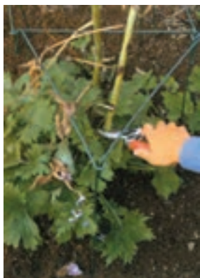
شکل ۵-۹- الف

– عمل سربرداری در بعضی از گل‌های زینتی و آپارتمانی نیز که در سال یک شاخه گل دهنده تولید می‌کنند مرسوم است. در این گیاهان به محض مشاهده ساقه گل دهنده جدید بلافاصله ساقه سال قبلی را قطع می‌کنند. مانند: الف) فلوکس