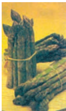
شکل ۸-۲- مارچوبه