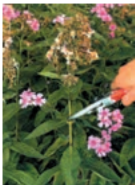
شکل ۵-۹- ب