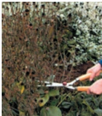
شکل ۵-۹- ج