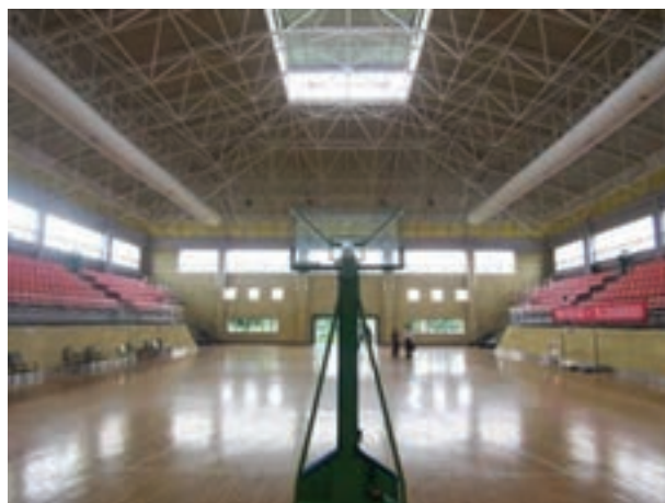
شکل ۴-۸- زمین بسکتبال بدون بازیکن

یک ورزش گروهی و با استفاده از یک توپ است. هدف هر تیم از انجام بازی کسب امتیاز از طریق انداختن توپ در داخل حلقه تیم مقابل می‌باشد. در ابتدا تعداد بازیکنان هر تیم ۹ نفر و سپس به ۷ نفر تقلیل یافت و بالاخره تعداد به ۵ نفر در زمین کاهش و تثبیت شد. بسکتبال در آمریکا طراحی شد و در حال حاضر در چهار دوره ۱۰ دقیقه‌ای (بین المللی) یا ۱۲ دقیقه‌ای (ان - بی - ای) انجام می‌شود.