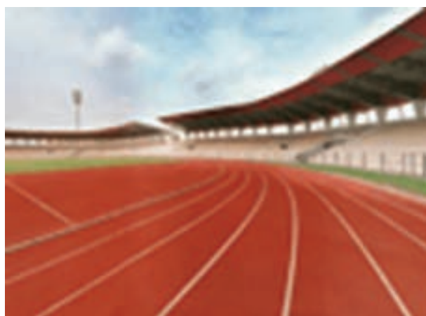
شکل ۲۷- ۸- پیست دو و میدانی

دو و میدانی : دو و میدانی از ورزش‌های محبوب بازی‌های المپیک است که شامل دویدن، پریدن و پرتاب کردن می‌باشد. انواع میدانی‌ها شامل : پرتاب‌ها : پرتاب نیزه، وزنه، دیسک و چکش (آقایان) است.