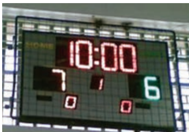
شکل ۱-۸ - تابلو ثبت امتیازات در والیبال

والیبال یک ورزش گروهی است که با ترکیب بازی‌های بسکتبال، تنیس و هندبال ایجاد شده است و برای افرادی که تمایل به تحرک کمتری دارند، ابداع گردیده است. تور اولیه‌ای که برای این بازی در نظر گرفته شده بود با ایده از بازی تنیس ۲ متر انتخاب شد و با توپ بسکتبال شبیه به بازی هندبال انجام شد. این ورزش تا سال ۱۹۰۰ توپ مخصوصی برای خود نداشت و با هر تویی (از جمله توپ بسکتبال) آن را بازی می‌کردند. هدف هر تیم آن بود که توپ را در زمین حریف فرود بیاورد و در این راه توپ در دست یاران خود می‌چرخد. در سال ۱۹۱۲ امتیازهای هر تیم ۲۱ تعیین شد و ارتفاع تور نیز بیشتر شد. امروزه زمان بازی ۵