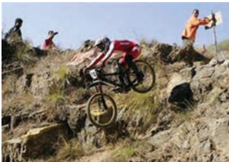
شکل ۲۶ - ۸ - الف - مسابقات کوهستان