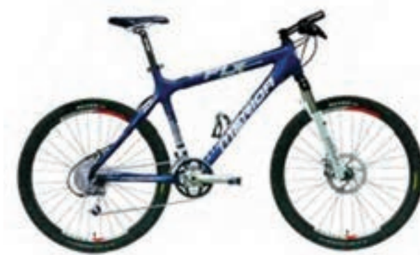
شکل ۲۱ - ۸ - دوچرخه کراس