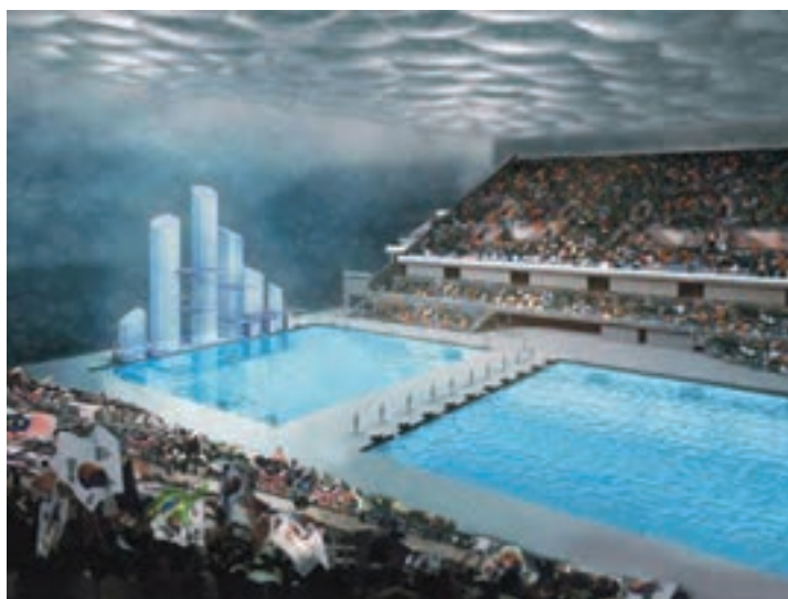
شکل ۲ - ۹ - شنا با جمعیت زیاد