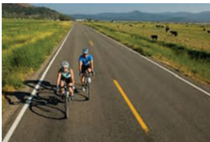
شکل ۲۵- ۸- ب- جاده