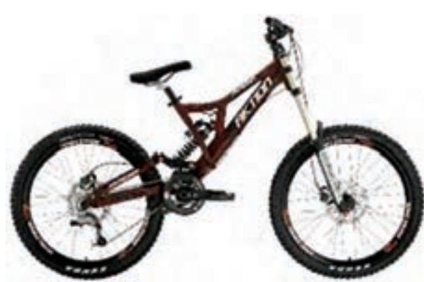
شکل ۲۰ - ۸ - دوچرخه کوهستان

انواع مختلفی از دوچرخه ارائه شده است که دو نوع مهم آن نوع کراس یا کورسی (۱) و کوهستان (۲). نوع دیگری که طرفداران زیادی هم دارد نوع BMX است که البته این نوع معمولاً برای تفریحات به اصطلاح غیر معمول (۳) نظیر حرکات نمایشی استفاده می شود. کراس یا کورسی معمولاً دارای چرخ های نازک و بدنه ای سبک است و برای شتاب بیشتر از آن استفاده می شود.