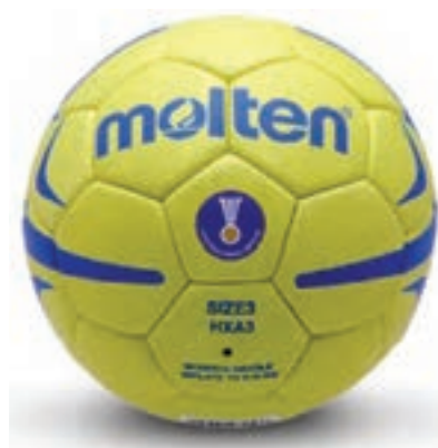
شکل ۸-۸ - توپ هندبال

لباس بازیکنان نیز شامل پیراهن یا تی‌شرت، که در پشت و جلو دارای شماره می‌باشند. شورت و جوراب و کفش ورزشی می‌باشد. بیشتر بازیکنان از زانو بند و محافظ آرنج هم استفاده می‌کنند. توپ هندبال از جنس چرم یا شبیه آن و از ۳۲ تکه تشکیل شده است. وزن آن برای مردان ۴۲۵ الی ۴۷۵ گرم و برای بانوان و نوجوانان ۳۲۵ الی ۴۰۰ گرم می‌باشد. رنگ توپ سفید، قرمز یا ترکیبات دیگری است. اندازه محیط توپ برای مردان ۵۸ تا ۶۰ سانتی‌متر و برای زنان ۵۴ تا ۵۶ سانتی‌متر می‌باشد. علاوه بر این توپ‌ها، از توپ اسفنجی پر شده (۳۵۰ گرم) و توپ مینی هندبال (۲۷۰ گرم) نیز استفاده می‌شود. ابعاد زمین قانونی هندبال ۲۰ × ۴۰ می‌باشد و طبق قوانین هندبال لازم است که در بیرون خطوط زمین، منطقه‌ای باشد که از طرفین (کناره‌های طولی) یک متر و از دو انتهای آن (کناره‌های عرضی) دو متر فاصله داشته