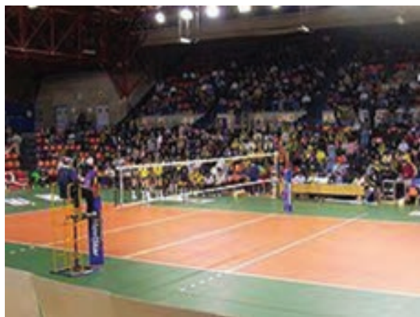
شکل ۲-۸ - تور و پایه والیبال

در این ورزش تور و توپ از ابزار اصلی هستند. طول تور والیبال 9/5 و عرض آن ۱ متر است و از سوراخ‌های مربع شکل به ضلع 10 سانتی‌متر تشکیل شده است. پارچه‌ای از جنس کتان به ضخامت ۵ سانتی‌متر به لبه بالایی تور دوخته شده است. ارتفاع تور از مرکز زمین 2/43 متر است. هر دو انتهای تور از زمین به یک فاصله هستند. ارتفاع تور برای خردسالان و