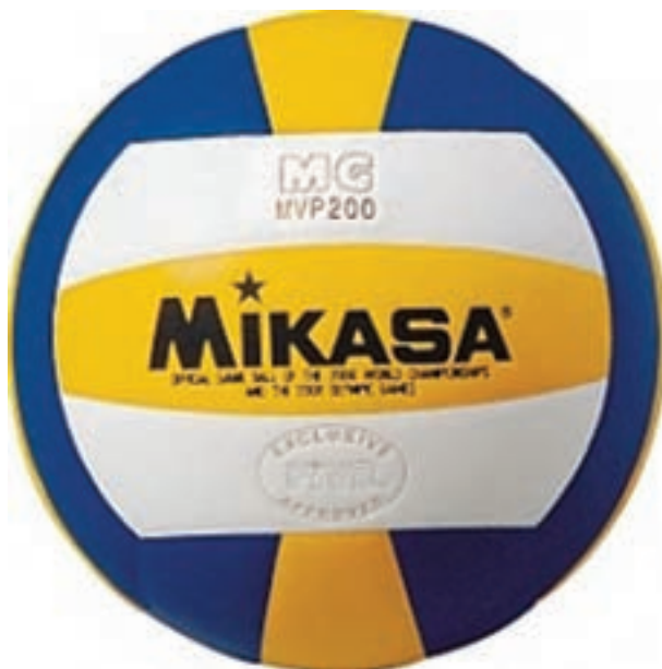
شکل ۳-۸- توپ والیبال

طول و یک متر عرض و ابعاد سوراخ‌های تور 10 \times 10 می‌باشد. طبق مقررات باید ۲۵ سانتی‌متر طرفین تور، خارج از خط باشد. بنابراین پایه‌ها باید طوری تعبیه شوند، که در زمان نصب تور این فاصله‌های دو طرف رعایت شود. پایه‌های والیبال به دو طریق ثابت می‌گردند، اول از طریق قرار گرفتن وزنه بر روی زوایای که در انتهای پایه‌ها قرار داده می‌شوند، دوم قرار دادن پایه‌ها در داخل گودال ۴۰ سانتی‌متری که لوله‌ای با قطر بیشتر از پایه‌ها در آن تعبیه شده است. در روش اول پایه‌ها دارای ثبات زیادی نیستند، پس از آموزش و تمرین قابل بهره‌برداری هستند. در مسابقات رسمی و برای بزرگسالان پایه‌ها باید در داخل گودال‌ها قرار گیرند: ارتفاع تور از محل نصب آن بر روی پایه‌ها تا کف زمین برای مردان (بزرگسالان) 2/43 متر و برای زنان 2/24 متر برای جوانان (دختر) تا ۱۸ سال 2/20 متر و در مینی والیبال