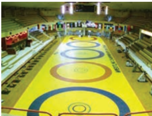
شکل ۱۲-۸ - سالن مسابقات کشتی و تشک کشتی