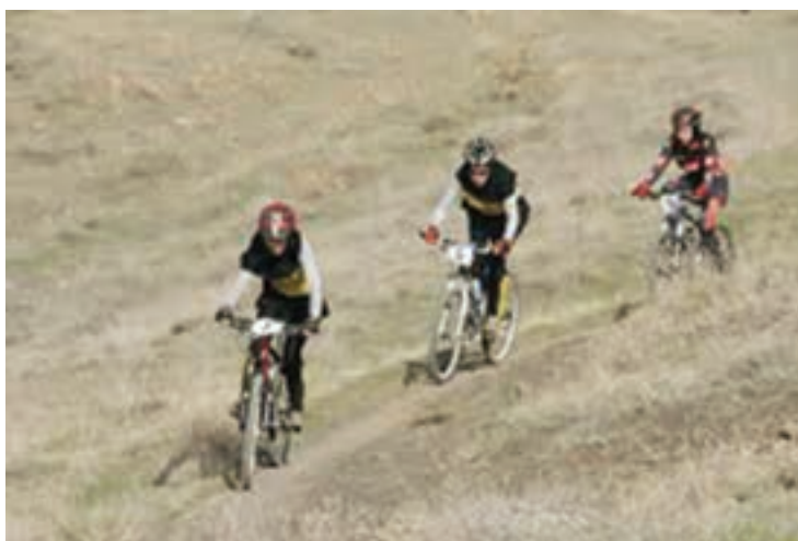
شکل ۲۶- ۸- ب- مسابقات کوهستان