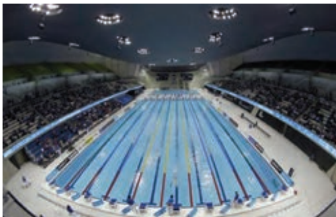
شکل ۱۶-۸ - استخر شنا

به مجموعه‌ای از ابنیه، لوازم، تجهیزات و امکانات، اطلاق می‌شود که هدف، آبتنی و شناکردن، شیرجه زدن، آموزش شنا و دیگر مقاصد تفریحی ایجاد شده است. استخرهای شنا بر حسب نوع فعالیت (آموزشی، تمرینی، مسابقه‌ای تفریحی و یا درمانی) تقسیم بندی شده و بر همین اساس دارای ویژگی‌هایی خاص هستند.