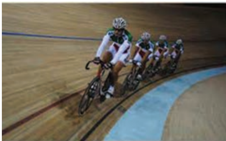
شکل ۲۵- ۸- الف- پیست دوچرخه سواری