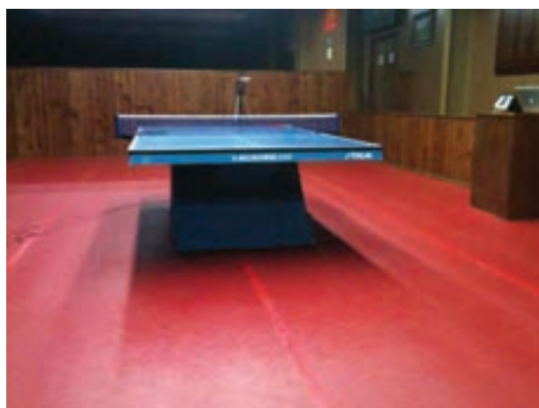
شکل ۱۰-۸- تور و میز تنیس روی میز