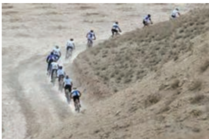
شکل ۲۶- ۸- ج- مسابقات کوهستان