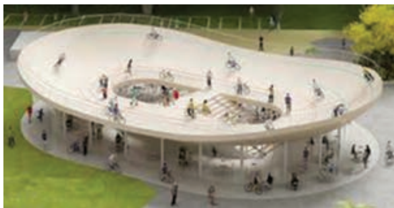
شکل ۲۵- ۸- ج- پیست دوچرخه سواری