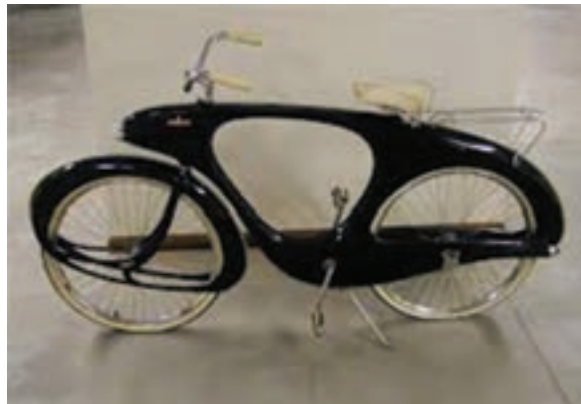
شکل ۱۹ - ۸ - دوچرخه غیر معمول