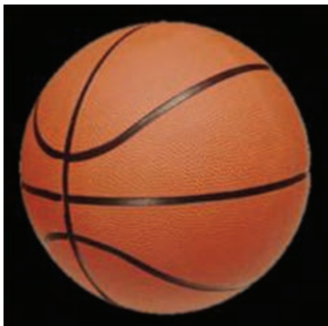
شکل ۵-۸- توپ بسکتبال

در فاصله ۳۰ سانتی متری قاعده تخته به آن متصل می شود. ارتفاع توری که به شکل سبد به حلقه بسکتبال متصل می شود، ۳۰ سانتی متر است. جنس حلقه فولادی می باشد و حداقل ۱/۶ سانتی متر و حداکثر ۲ سانتی متر ضخامت دارد. قطر داخلی حداقل ۴۵ سانتی متر و حداکثر ۴۵/۷ سانتی متر است. توپ بسکتبال از چرم، پلاستیک و یا مواد مصنوعی است. محیط توپ نباید کمتر از ۷۵ سانتی متر و بیش از ۷۸ سانتی متر باشد. وزن توپ باید حداقل ۵۶۷ گرم و حداکثر ۶۵۰ گرم باشد. اگر توپ به میزان مناسب باد شده باشد، وقتی آن را از ارتفاع ۱/۸۰ متر رها کنیم، پس از برخورد با زمین بازی تا ارتفاع ۱/۲۰ (حداقل) یا ۱/۴۰ (حداکثر) بالا می آید. عرض باندهای مشکی روی توپ نباید از ۶۳۵/۰ سانتی متر تجاوز کند.