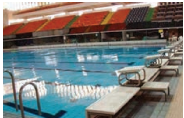
شکل ۱۷-۸ - سکوی استارت شنا