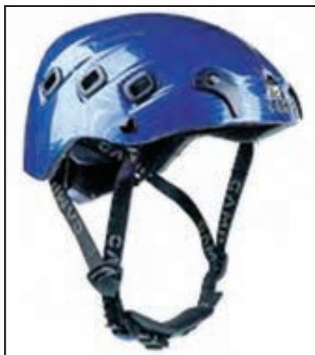
شکل ۲۴- ۸- کلاه دوچرخه سواری