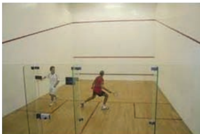
شکل ۱۱-۸- زمین اسکواش