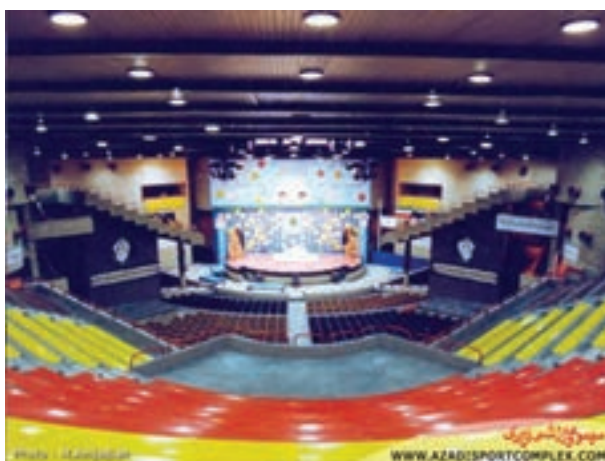
شکل ۱۳-۸ - سالن وزنه‌برداری