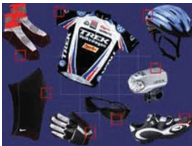
شکل ۲۲- ۸- وسایل دوچرخه سواری

از انواع کوهستان برای مسیرهای پرفراز و نشیب استفاده می‌شود. این نوع از دوچرخه دارای لاستیک‌های پهن و بدنه‌ای مستحکم است که به دلایل بالا بردن استقامت در مسیرهای کوهستانی و غیرصاف می‌باشد. نوع شهری معمولاً برای استفاده در شهر و جنگل کاربرد دارد. در هنگام دوچرخه سواری از وسایل ایمنی شامل کلاه، زانوبند و آرنج‌بند باید استفاده کرد. آچارکشی منظم، تنظیم باد لاستیک‌ها، جعبه ابزار و وسایل کمک‌های اولیه از ملزومات دیگر دوچرخه سواری است. شب‌نما و چراغ‌های چرخ و قمقمه آب و مقداری خرما نیز توصیه می‌شوند.