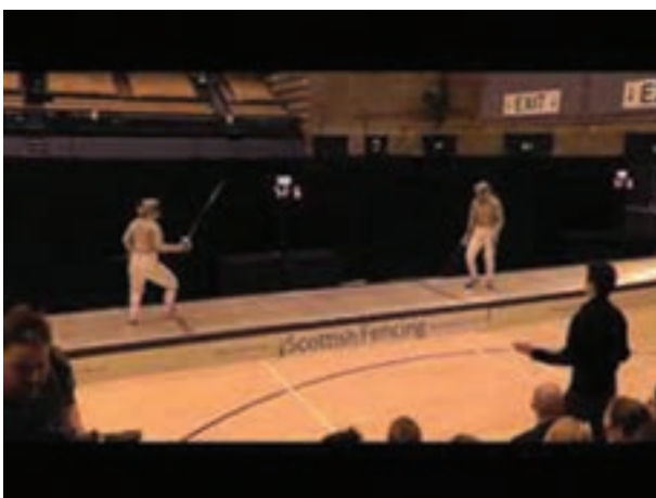
شکل ۱۴-۸ - سالن شمشیر بازی