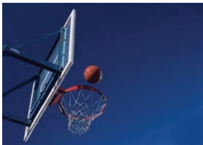
شکل ۶-۸- تور بسکتبال

متر بلندی دارند و از حلقه آویزان می گردند. تور باید ۱۲ حلقه برای اتصال به سبد باشد و لبه های تیز نداشته باشد و انگشت به داخل آن فرو نرود. بافت تور باید به گونه ای باشد که توپ پرتاب شده با مکث کوتاهی از آن عبور کند. باید دقت کرد که حریم های ایمنی تعیین شده خطوط اطراف زمین رعایت شود و پایه های تخته بسکتبال و موانع یا حفاظ های نزدیک به زمین توسط ابر، لایه های ضربه گیر لاستیکی و..... پوشانده شوند. از کف پوش های مناسب استفاده شود. از توپ های مناسب و استاندارد استفاده شده باشد.