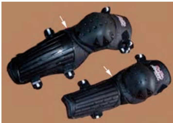
شکل ۲۳- ۸- زانوبند

اولین مسابقه جهانی دوچرخه سواری در ماه مه سال ۱۹۰۱ با حضور بیست هزار تماشاگر انجام شد و در سال ۱۹۰۳ اولین مسابقه تور دور فرانسه انجام شد رشته‌های مسابقات دوچرخه سواری به صورت پیست، جاده و کوهستان (دان هیل و کراکس کانتری X.C) برگزار می‌شود.