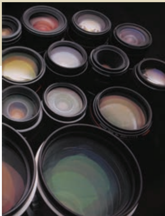
تصویر ۲-۶ پوشش های روی لنز رنگی دیده می شوند.