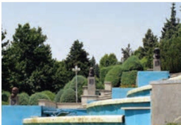
تصویر ۳-۶- لنز واید