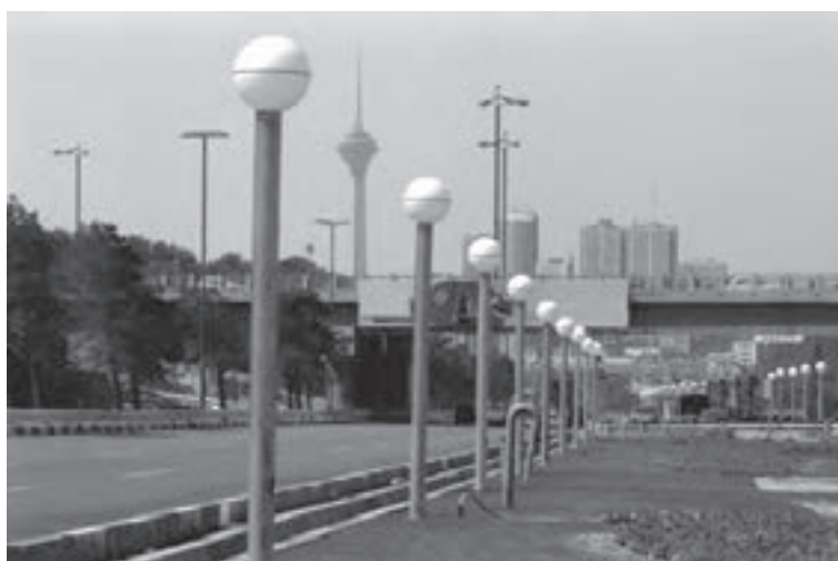
تصویر ۶-۲۳—لنز تله