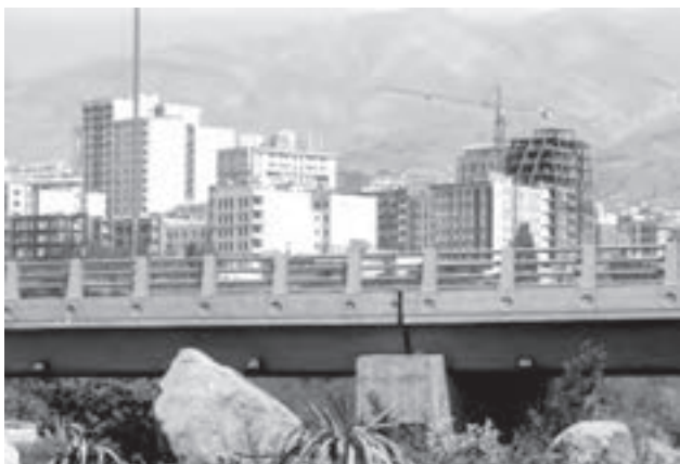
تصویر ۱۷-۶- لنز نرمال