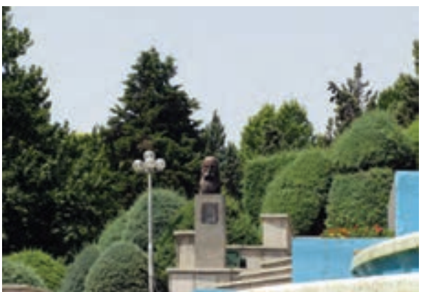
تصویر ۴-۶- لنز نرمال