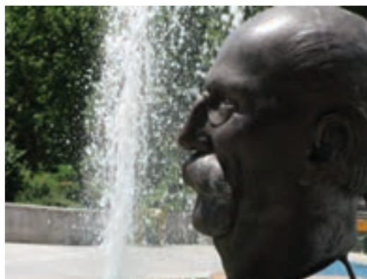
تصویر ۲۶-۶- لنز تله