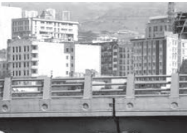
تصویر ۱۸-۶- لنز تله