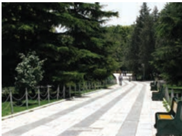
تصویر ۱۹-۶- پرسپکتیو لنز واید