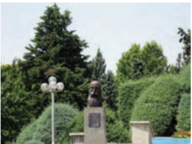
تصویر ۵-۶- لنز تله