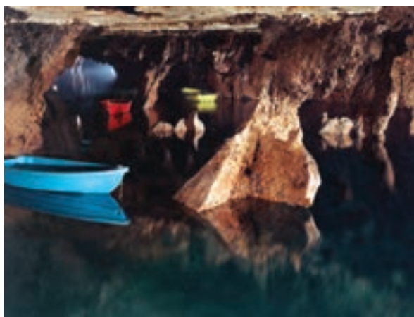
تصویر ۹-۶- لنز واید، غار علی صدر، همدان