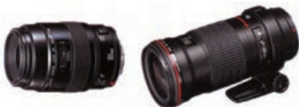
تصویر ۶-۱۳- دو نمونه لنز ماکرو با فواصل کانونی متفاوت

به جز لنزهای ذکر شده لنزهای دیگری هم در عکاسی به کار می رود که بسیار تخصصی است و استفاده همگانی ندارد.