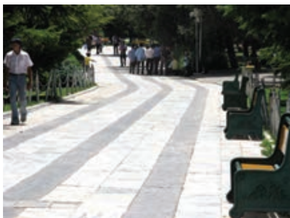
تصویر ۲۰-۶- پرسپکتیو لنز تله