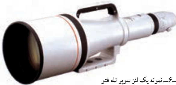
تصویر ۶-۶- نمونه یک لنز سوپر تله فتو