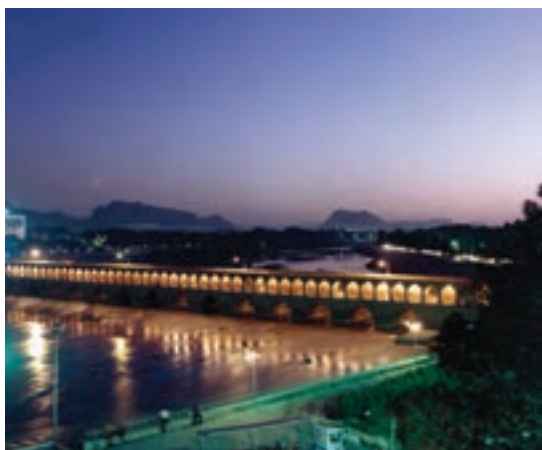
تصویر ۱۰-۶- لنز نرمال، سی و سه پل، اصفهان