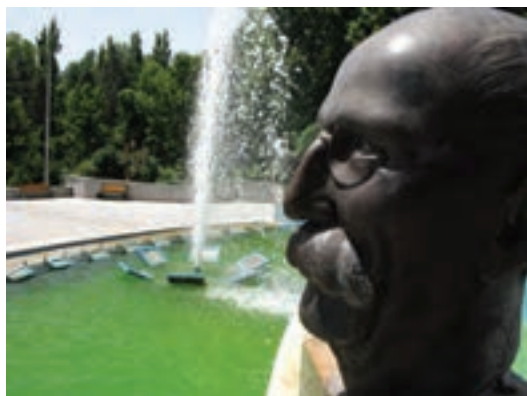
تصویر ۲۴-۶- لنز واید