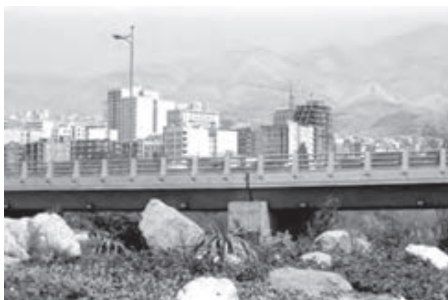
تصویر ۱۶-۶ - لنز واید