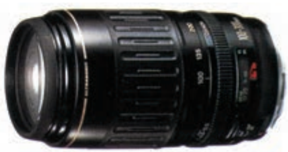
تصویر ۱۲-۶- لنز زوم با مشخصات ۱۰۰-۳۰۰ f.4.5-5.6