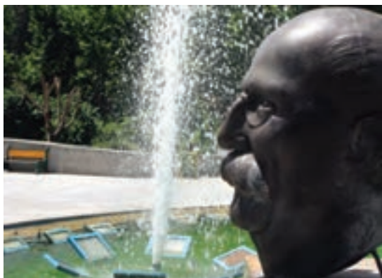
تصویر ۲۵-۶- لنز نرمال