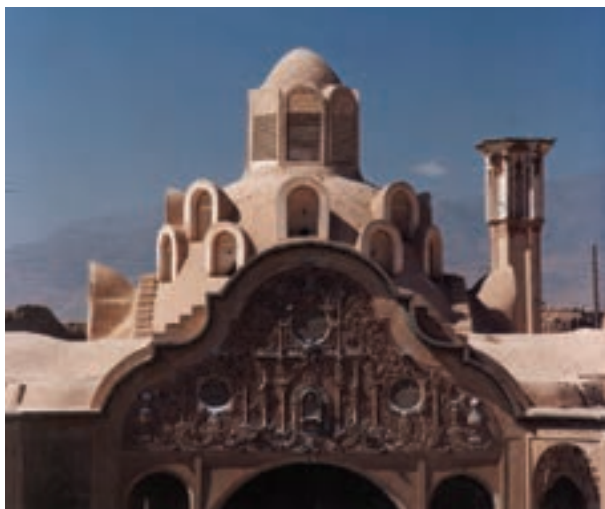
تصویر ۱۱-۶- لنز تله، خانه بروجردیها، کاشان