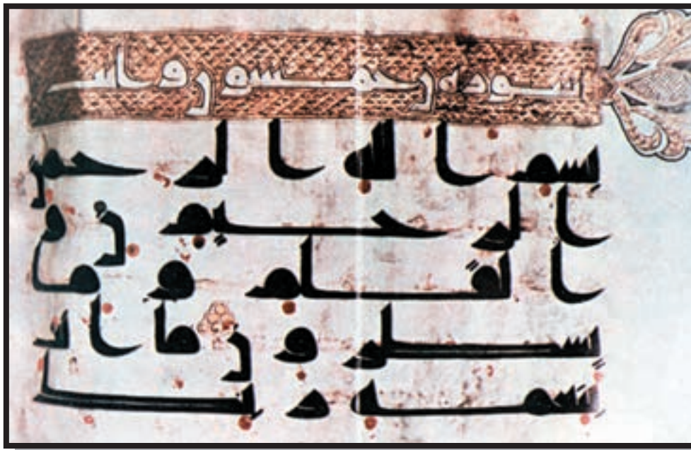
تصویر ۱-۲۵- کوفی - (منسوب به حضرت علی ع) موزه ایران باستان

کوفی: القا کننده اصالت، قداست، قدمت، معنویت، امامت، عصمت و تداعی کننده عصر پیامبر گرامی اسلام (ص) و ائمه اطهار (ع) می باشد.