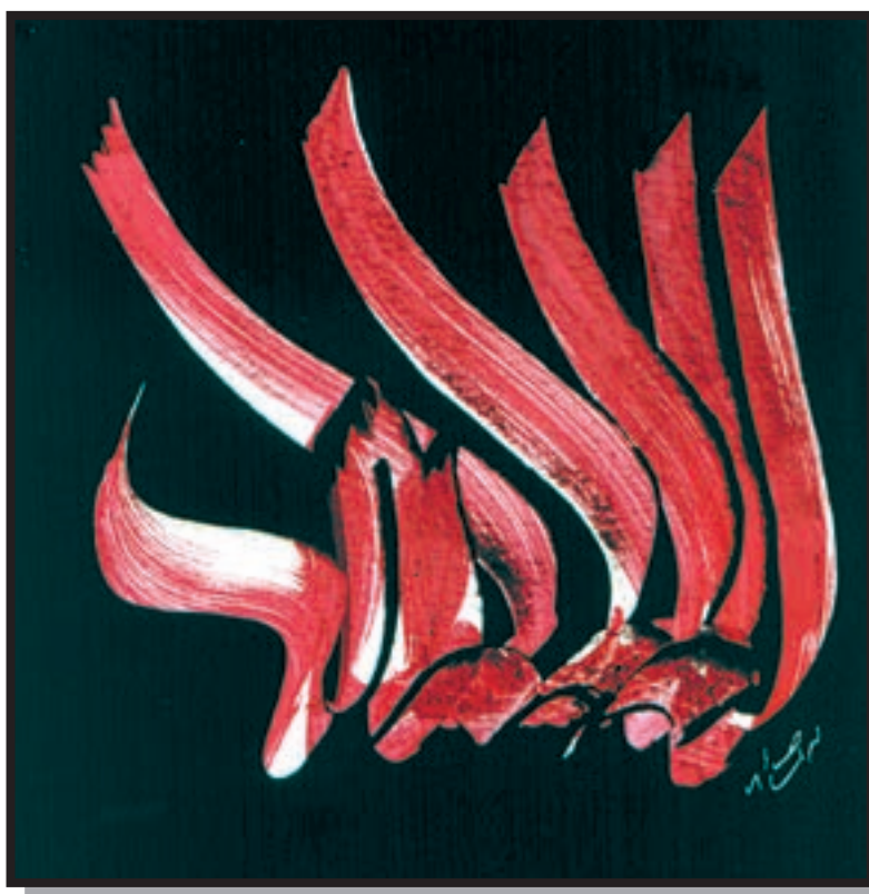
تصویر ۱-۲۶ — نقاشی خط — محمد احصایی (معاصر)

بنابر ضرورتها فقط برای زیبایی متن و به منظور ایجاد رغبت بیشتر در خوانندگان و مطالعه کنندگان آن اجرا شده و می‌شود. مانند بسیاری از کتابهای شعر و پیامهای تبلیغاتی و غیره که بنا بر مقتضیات خوشنویسی شده و می‌شوند. علاوه بر آنچه گفته شد از عناصر خوشنویسی در هنرهای همچون حجم، نقش برجسته، معماری، صنایع دستی، و غیره می‌توان در جهت آفرینش آثار هنری استفاده کرد؛ همچنانکه در گذشته، هنرمندان خلاق ایرانی در بناها و دست ساخته‌های خود به طرق مختلف از خوشنویسی و امکانات تجسمی آن بهره می‌گرفته‌اند، امروزه نیز زمینه‌های متعددی وجود دارد که می‌توان با بکارگیری عناصر خوشنویسی در آنها هم بردامنه و موارد کاربری خوشنویسی افزود و هم جنبه‌های فرهنگی و هنری برخی کالاها را ارتقا داد و هویت ملی را در این نوع کالاها و تولیدات به خوبی نمایاند. برای مثال می‌توان صنایع پوشاک، پارچه، کاشی و سرامیک، را به عنوان زمینه‌های مناسبی که می‌توان از عناصر خط و خوشنویسی در آنها استفاده کرد نام برد. همچنین در زیباسازی شهرها و تزیینات داخلی اماکن عمومی و غیره، امکانات بالقوه‌ای برای حضور فراگیر هنر خوشنویسی به صورت حجم و نقش برجسته وجود دارد که به نظر می‌رسد از این طریق می‌توان هنر خوشنویسی را از حصار تنگ صفحات کاغذی و نمایشگاه‌ها و مجموعه‌های خصوصی به درون جامعه برد و این هنر شریف و نماد فرهنگی و میراث ارزشمند را از انزوایی که بعد از دوران قاجار به آن دچار گشته خارج ساخت.