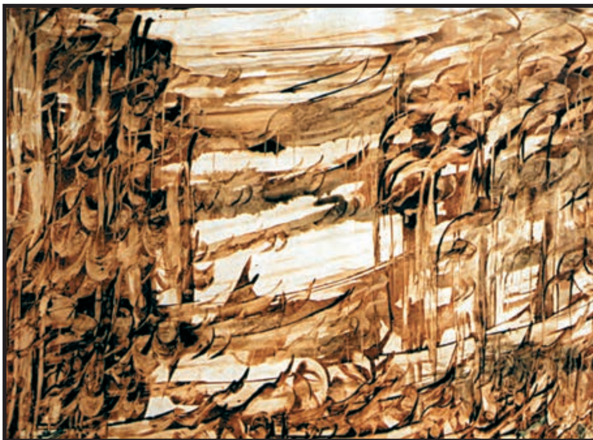
تصویر ۴-۲۶- نقاشیخط - اسماعیل رشوند (معاصر) - (بداهه‌سازی با حرکت‌های سریع قلم) - مرکب و قلم خوشنویسی - ۵۰×۷۰cm