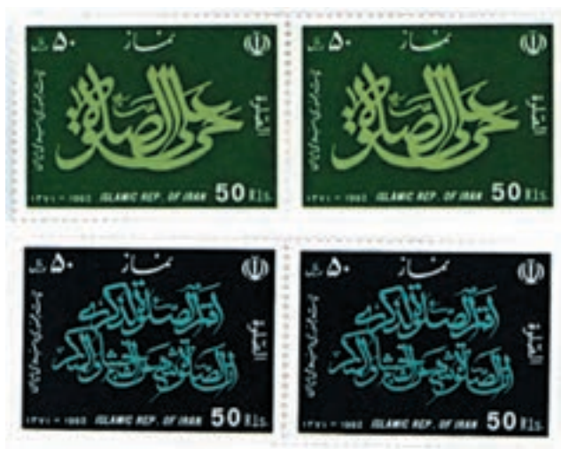
تصویر ۹-۲۶- استفاده از خوشنویسی در طراحی تمبر - صداقت جباری (معاصر)