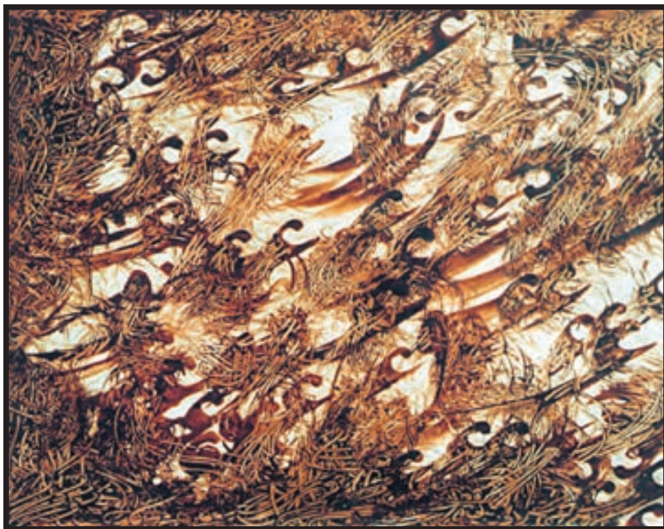
تصویر ۳-۲۶- نقاشیخط - اسماعیل رشوند (معاصر) - مرکب و قلم - حرکت‌های آزاد و سریع قلم - ۳۰×۴۵cm