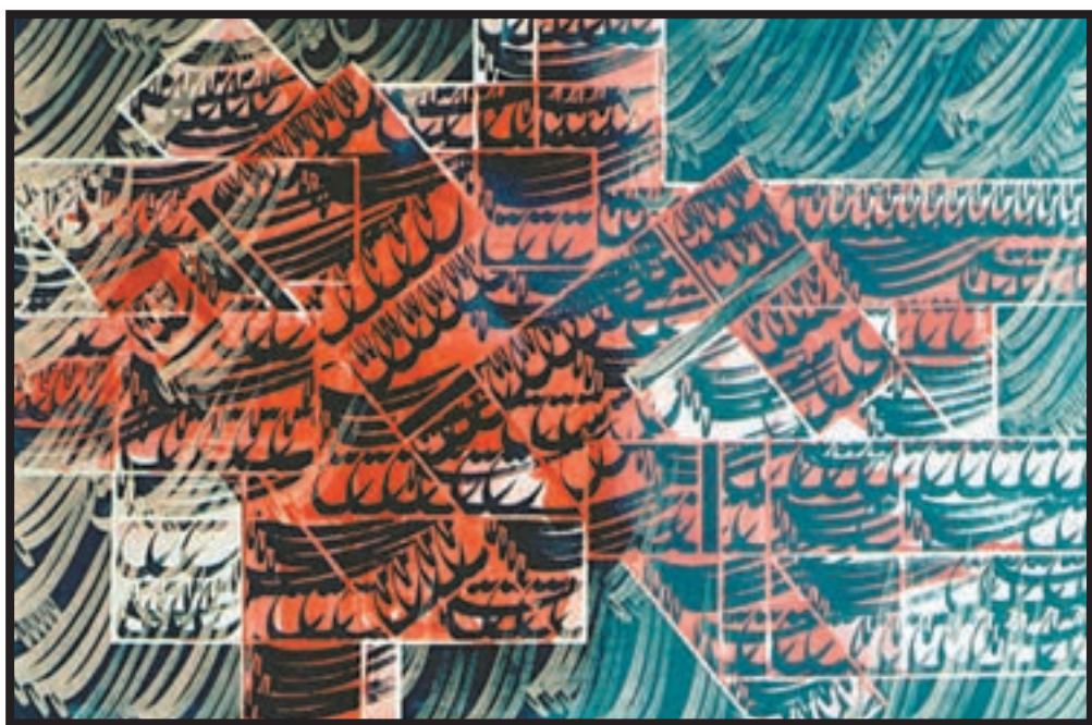
تصویر ۸-۲۶- نقاشیخط- ترکیببندی (کشیدهها و گردیها)- فرامرز پیل آرام (معاصر)