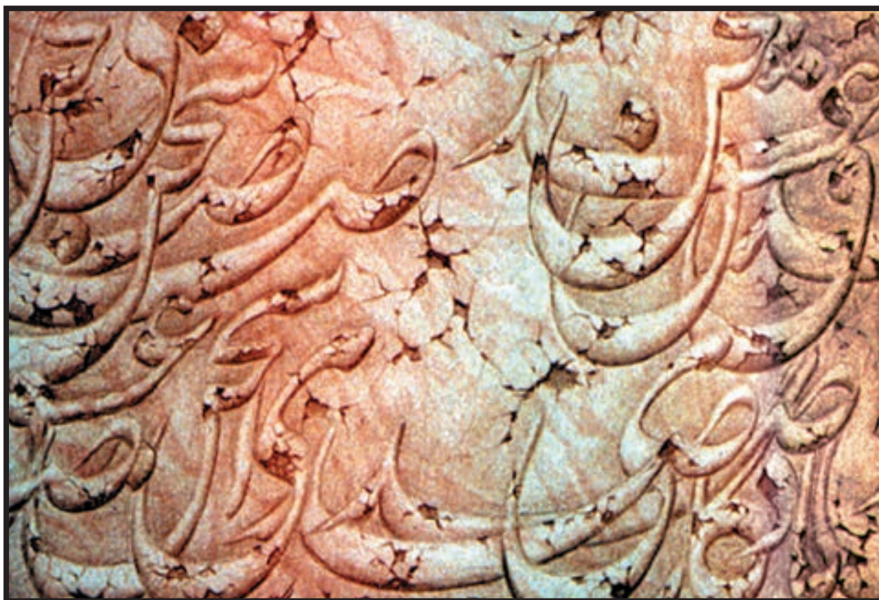
تصویر ۴-۲۴ — یادگار — اسماعیل رشوند (معاصر) — مداد رنگی — ۳۵×۵۰ cm