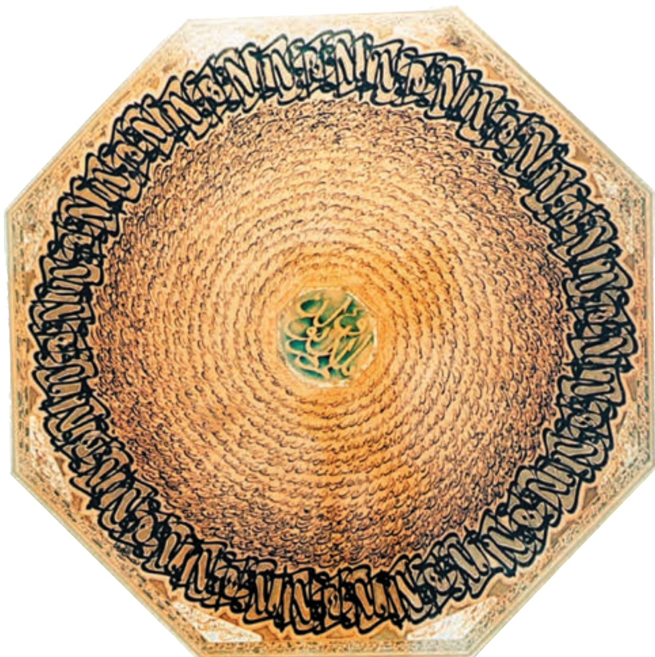
تصویر ۲-۲۶- نقاشی خط - نصرالله افجه‌ای (معاصر)