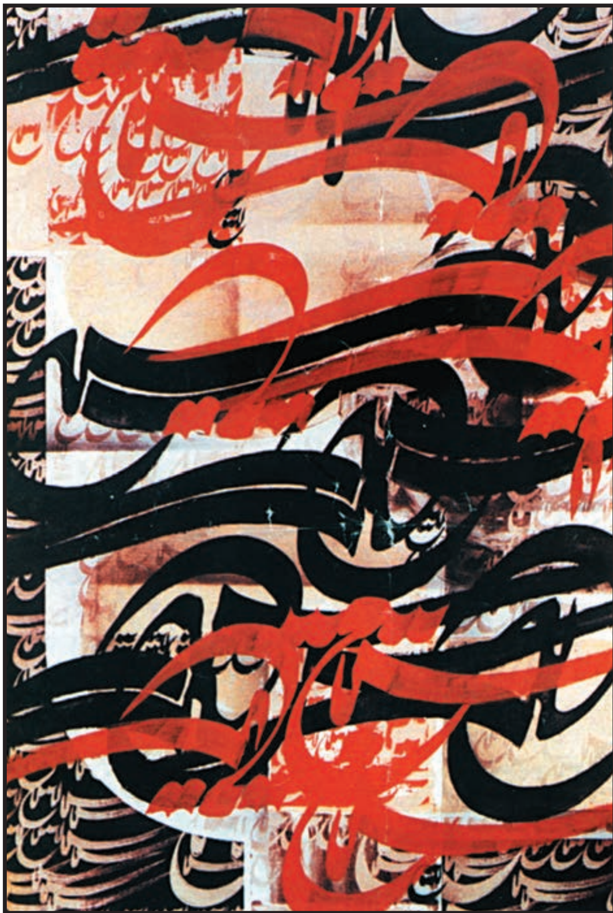
تصویر ۱-۲۴- نقاشیخط- فرامرز پیل آرام (معاصر)- رنگ و ریتم