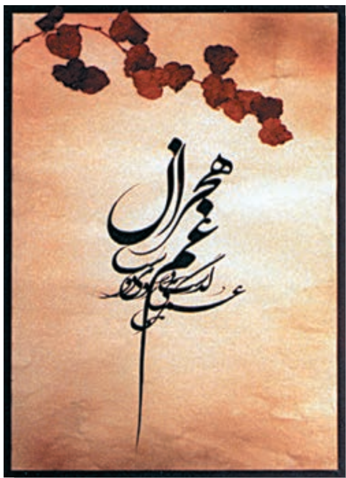
تصویر ۷-۲۶- استفاده از حرکتهای نرم و آزاد- اسماعیل رشوند (معاصر) - ۲۵×۳۵ cm