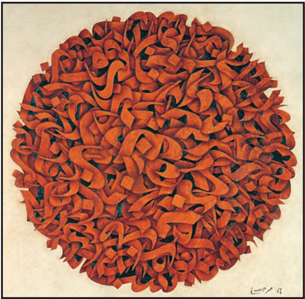
تصویر ۸-۲۴- نقاشیخط - محمد احصایی (معاصر) - رنگ و روغن