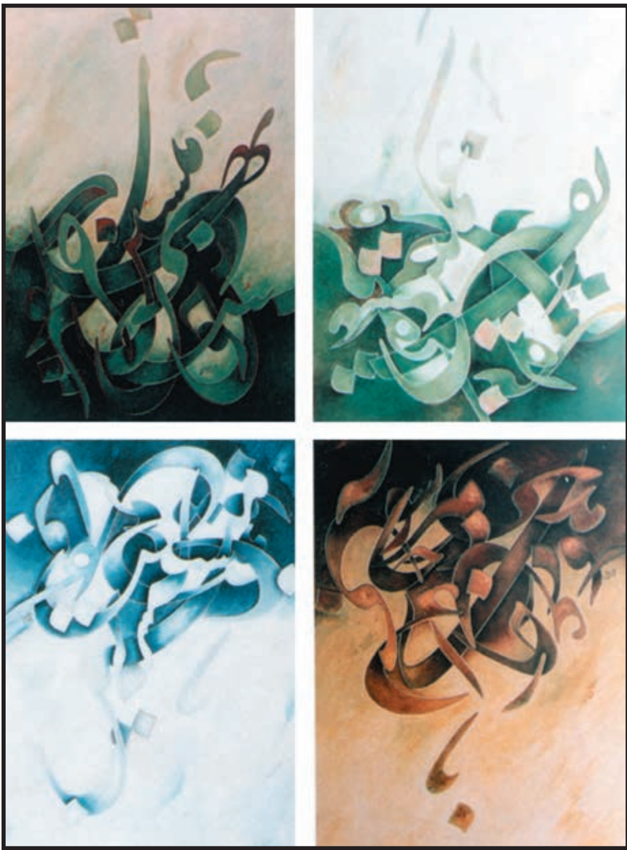
تصویر ۳-۲۴- چهار فصل - جلیل رسولی (معاصر) - رنگ روغن - ۶۴×۶۱