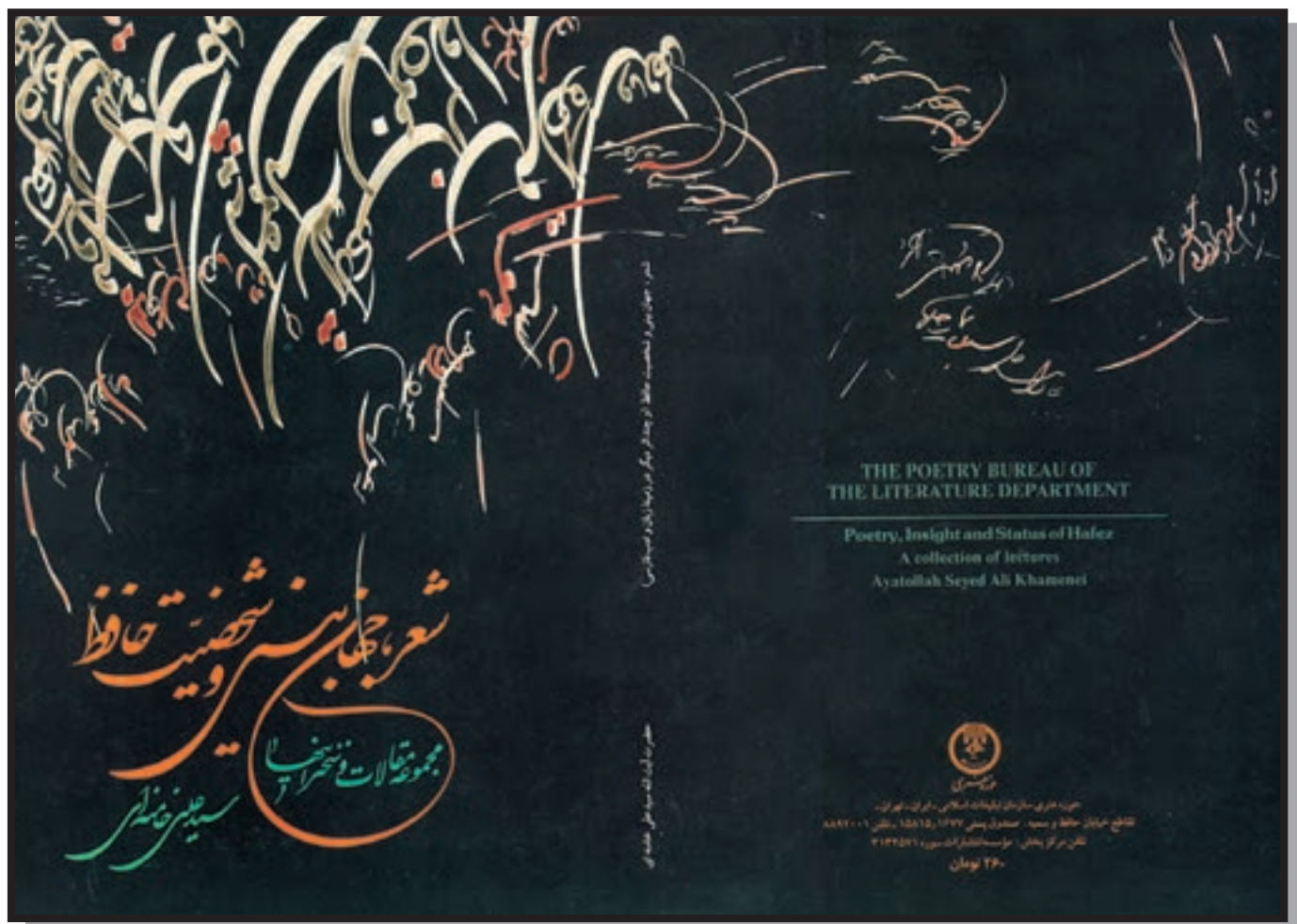
تصویر ۲۵-۷- طراحی جلد کتاب با استفاده از شکسته نستعلیق - صداقت جاری (معاصر)