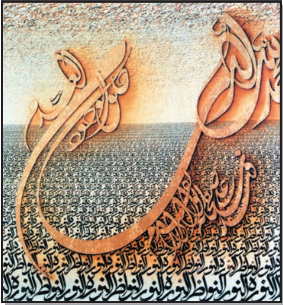
تصویر ۷-۲۴ — نقاشیخط — نصرالله افجه‌ای — ۱۲۵×۱۲۵ cm