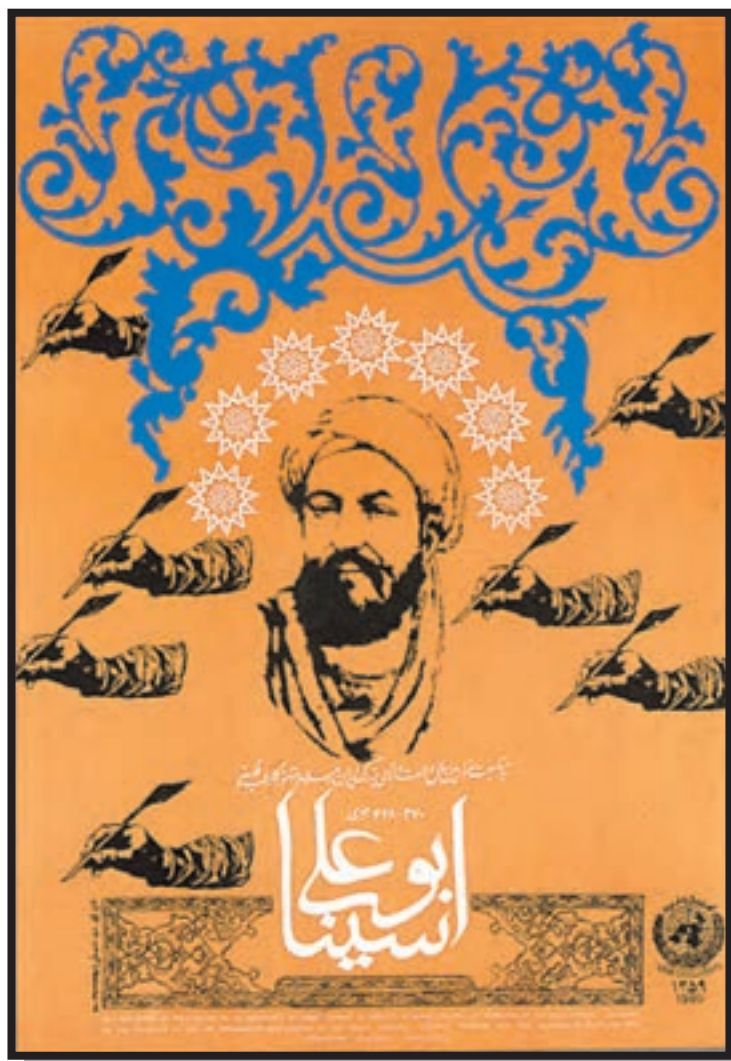
تصویر ۶-۲۵- پوستر فیلم - مرتضی ممیز (معاصر)

۴- چه نوع خوشنویسی برای استفاده در طراحی پوستری برای «جشنواره شعر نو» مناسب است؟