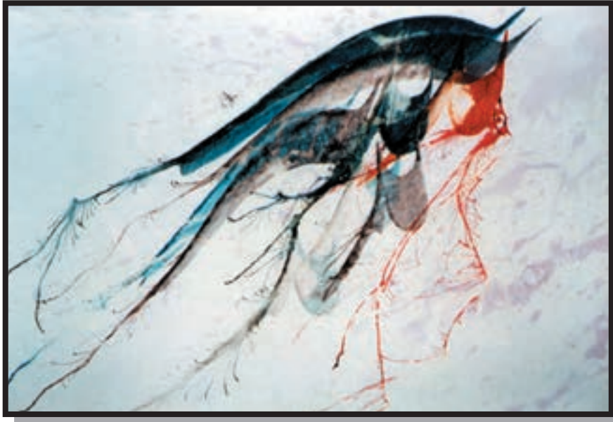
تصویر ۵-۲۶ — نقاشیخط — یونس پولاد (معاصر) — مرکب و قلم — ۵۸×۷۸ cm