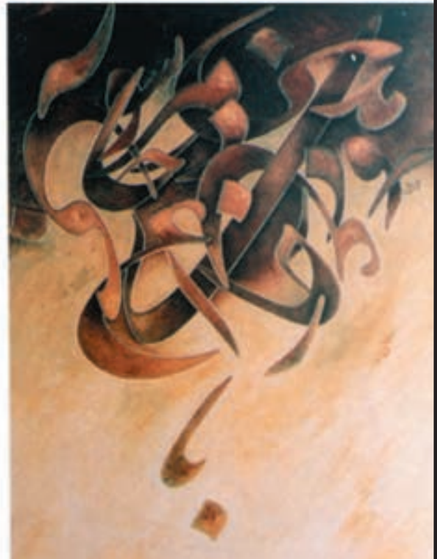
تصویر ۳-۲۴- چهار فصل - جلیل رسولی (معاصر) - رنگ روغن - ۶۱×۶۴ cm