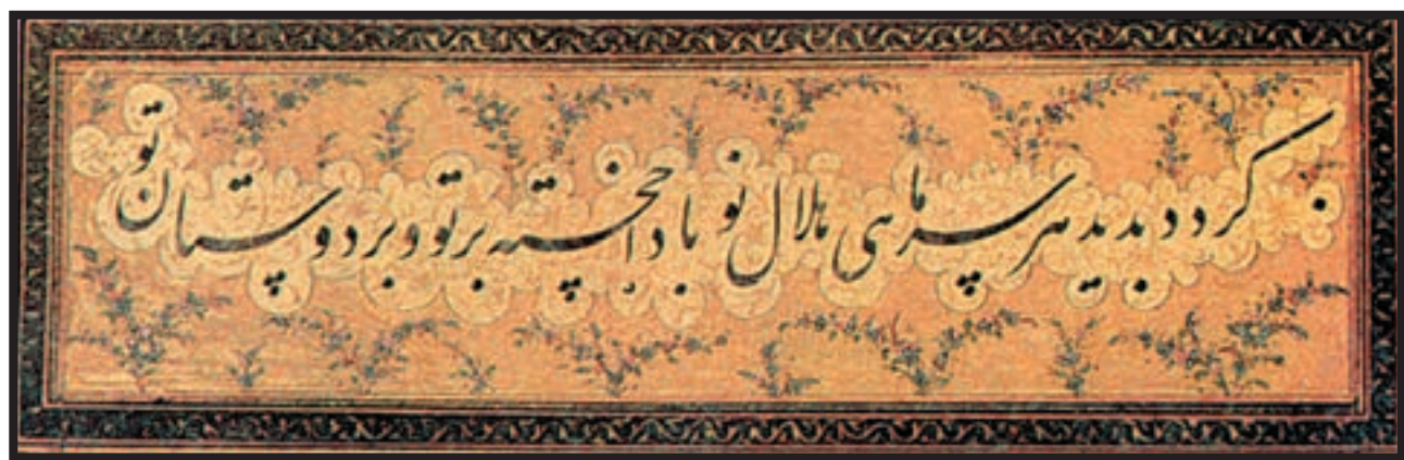
تصویر ۴-۲۵ نستعلیق — میرزا غلامرضا اصفهانی — (قرن ۱۳ هـ)

نستعلیق: سادگی، زیبایی، تناسب، اصالت، نرمی، شادی، عطوفت، آرامش، انعطاف‌پذیری، دوستی، عرفان، صداقت، پاکی، عشق و اعتماد را به بیننده القا می‌کند و نماد فرهنگ ایرانی و خط فارسی است.