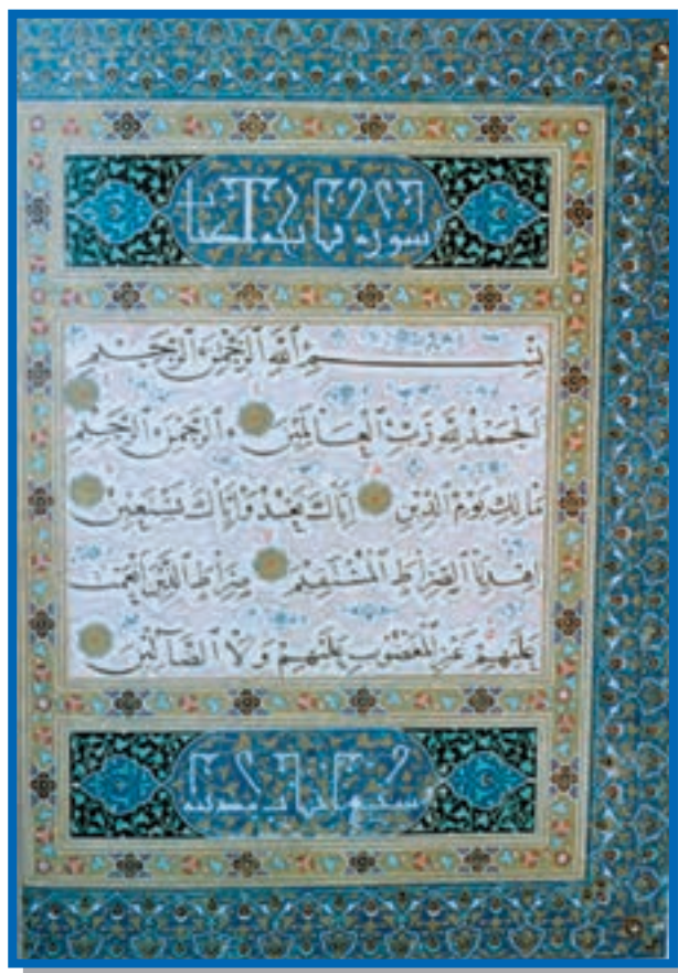
تصویر ۳-۲۵ خط نسخ — شمس الدین بایسنقری — ۲۵×۳۵ cm — (قرن ۹) — هرات

نسخ: نمادی از قرآن کریم است و دارای خصوصیاتنی چون سادگی، صراحت، قدرت، جدیت، قداست، معنویت، پایداری، اعتماد و دانش است.