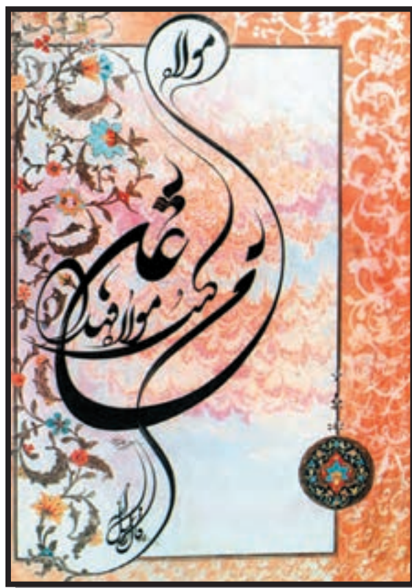
تصویر ۶-۲۶ — استفاده از حرکت‌های نرم و آزاد — غلامعلی فرضی (معاصر) — ۴۸/۵×۶۹cm