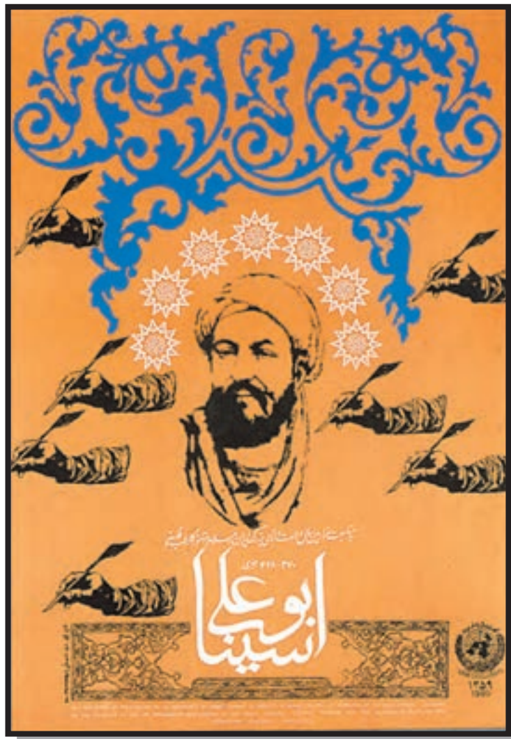
تصویر ۶-۲۵- پوستر فیلم - مرتضی ممیز (معاصر)

۴- چه نوع خوشنویسی برای استفاده در طراحی پوستری برای «جشنواره شعر نو» مناسب است؟