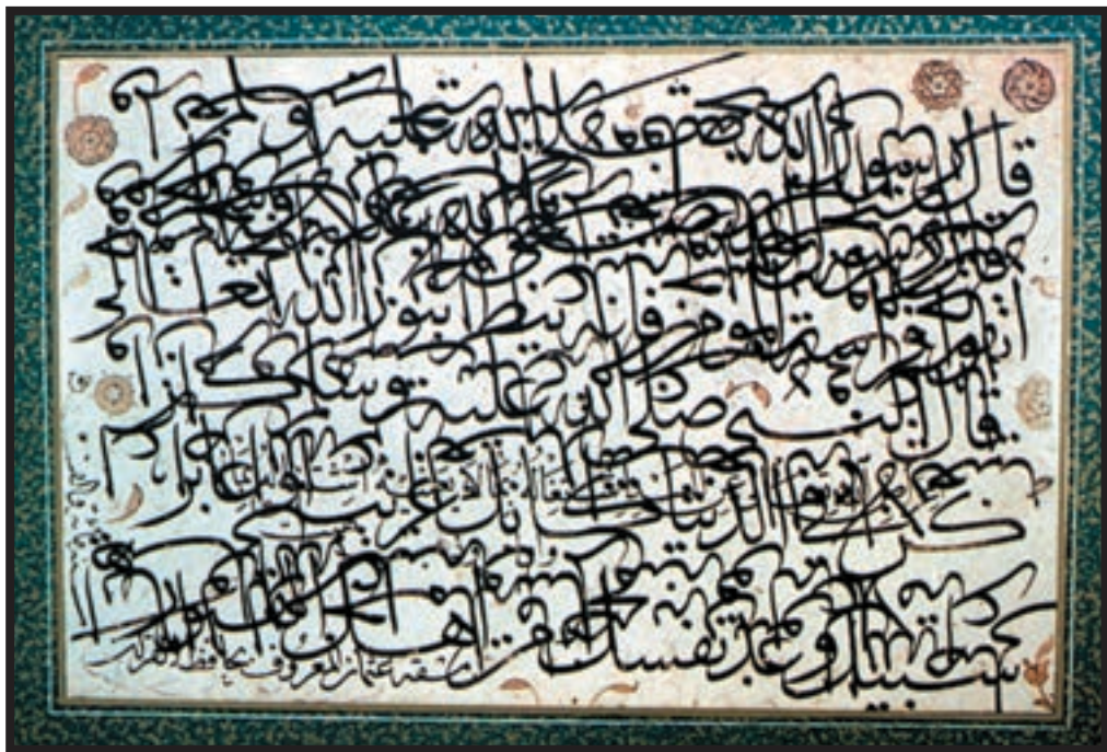
تصویر ۲-۲۵ - سیاه مشق ثلث - حافظ عثمان (قرن ۱۱) - ۲۵/۸ × ۱۷/۷ cm - استانبول

ثلث: قداست، عظمت، صراحت، شجاعت، صلابت، جدیت، معنویت، عبادت و حرکت را به بیننده القا می کند و نماد فرهنگ اسلامی است.