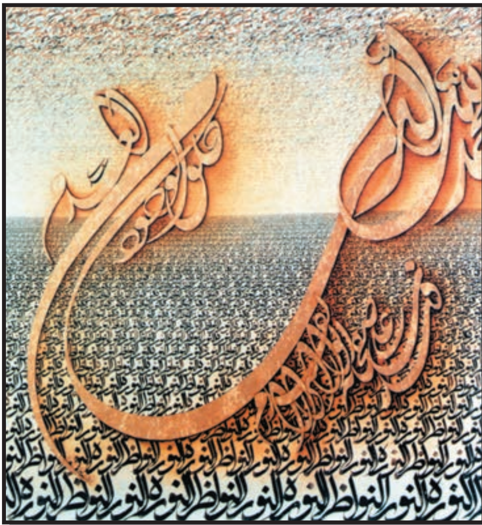
تصویر ۷-۲۴- نقاشیخط - نصرالله افجه‌ای - ۱۲۵×۱۲۵ cm