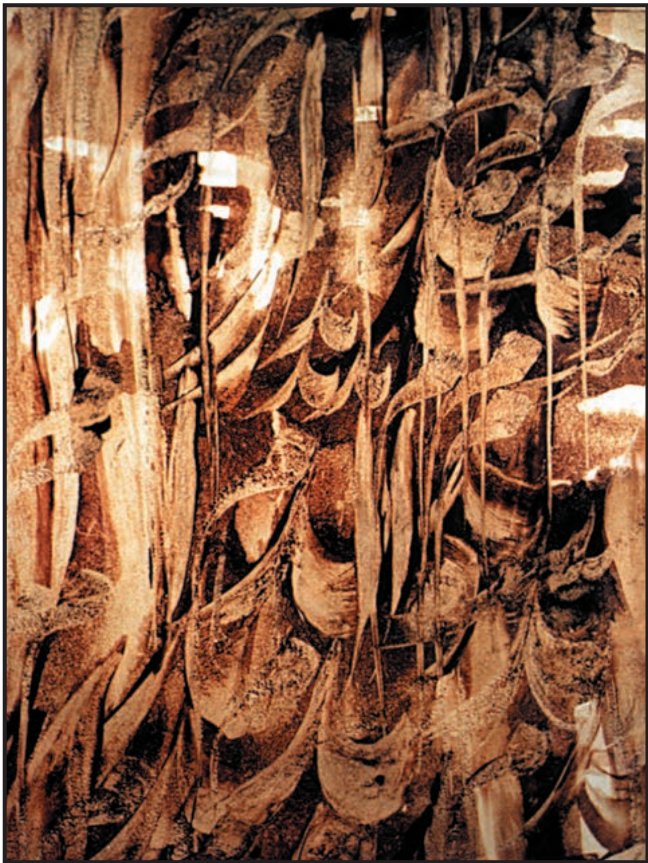
تصویر ۶-۲۴- نقاشی خط (بخشی از اثر) اسماعیل رشوند (معاصر) - مرکب و قلم - ۴۰×۶۰ cm