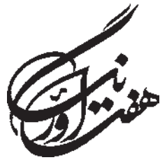
تصویر ۱۱-۲۶- طراحی آرم با استفاده از خوشنویسی - مرتضی ممیز (معاصر)