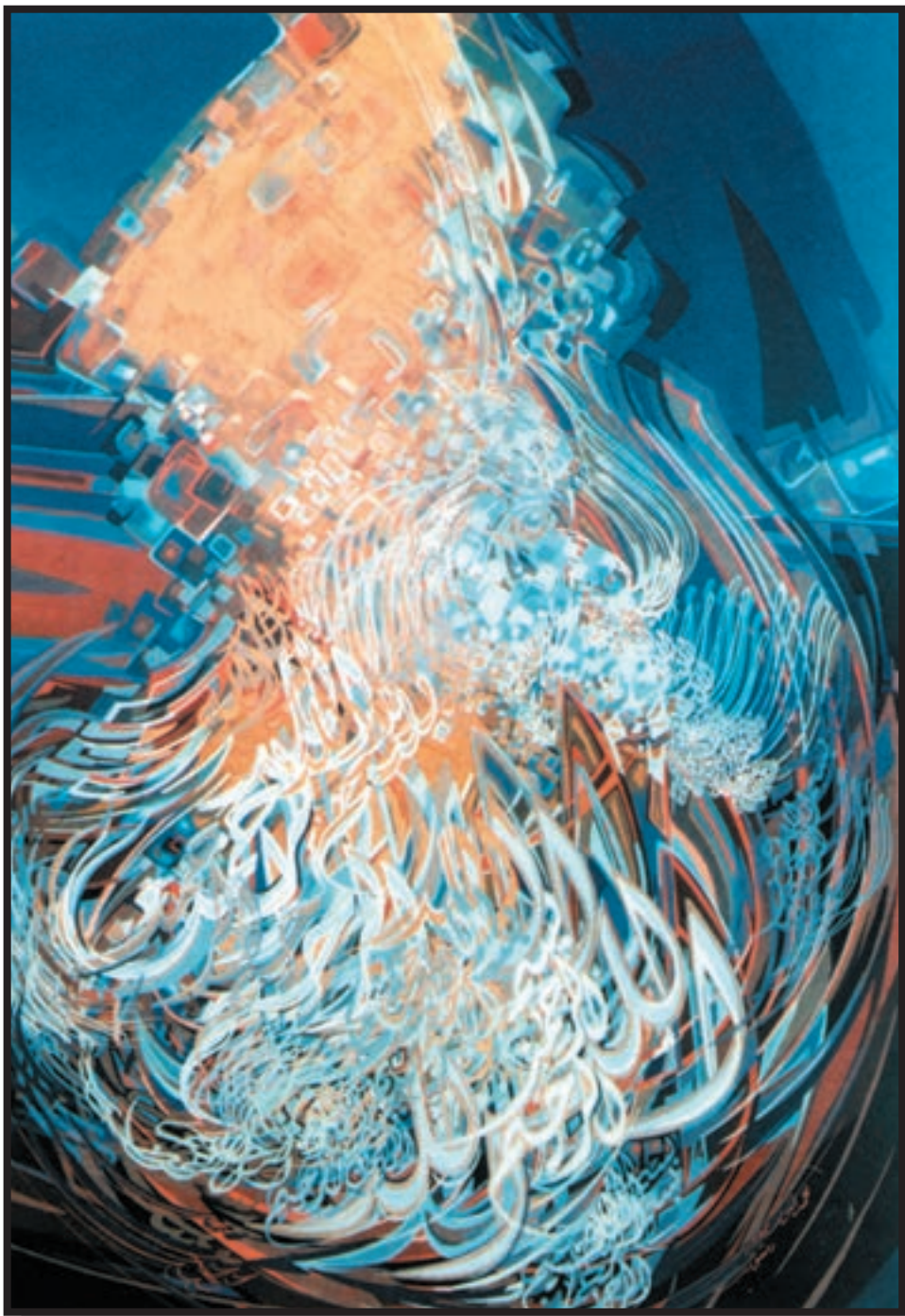
تصویر ۲-۲۴- محمد غنوم (سوریة) (معاصر) - رنگ روغن - ۷۰×۱۰۰cm