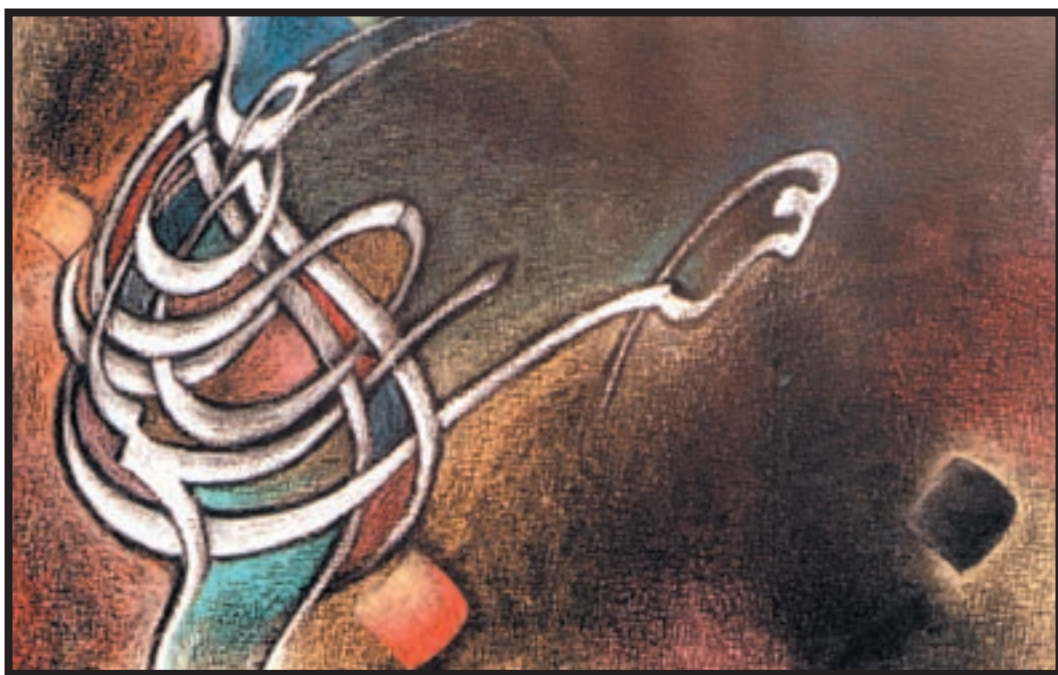
تصویر ۵-۲۴ — نقاشیخط — بابک رشوند (معاصر) — پاستل — ۴۰×۶۰cm