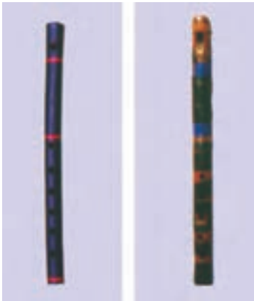
نی لبک گلستان (منطقه کتول)

نی لبک‌ها گروهی از هواصداها هستند که از گروه نی‌ها مشتق شده‌اند و در موسیقی غربی به ریکوردرها شهرت دارند. نی لبک‌ها در مقایسه با نی‌ها امکانات اجرایی محدودتری دارند اما نواختن و به‌صدا درآوردن آنها به خاطر ساختاری که دارند آسان‌تر از نی‌هاست. به همین دلیل است که جز نوازندگان حرفه‌ای، افراد دیگری نیز آنها را می‌نوازند. سازهای خانواده نی لبک در بعضی نواحی ایران متداول‌اند و با نام‌های مختلفی چون نی لبک، لبک، سیکاتک، شمشاد، توتک، سوتک، شو تک و ... شناخته می‌شوند.