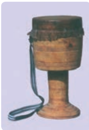
تمبک هرمزگان (میناب)

متداول در نواحی ایران یا چوبی هستند و یا فلزی. در بعضی مناطق فقط تمبک چوبی متداول است و در برخی دیگر فقط از تمبک فلزی استفاده می‌کنند. در بعضی مناطق نیز هر دو نوع متداول‌اند. تمبک‌های چوبی صرف‌نظر از اندازه آنها ویژگی‌های مشترک ساختاری با تمبک کلاسیک ایران دارند. تمبک فلزی معمولاً از ورق فلزی سیاه ساخته می‌شود و قسمت‌های مختلف آن با میخ و پرچ به هم متصل شده‌اند. همه تمبک‌ها اعم از چوبی یا فلزی یک استوانهٔ طینی دارند که روی دهانهٔ آن پوست چسبانده شده است.