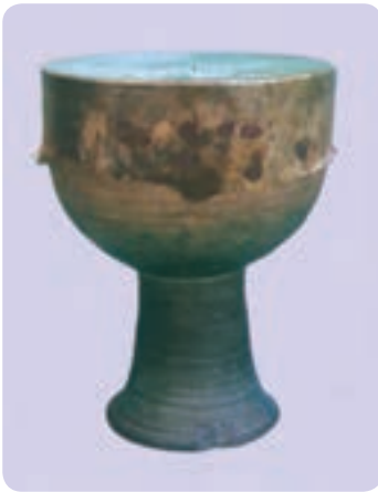
تمبک زورخانه (نمونه جدید)

زورخانه محل انجام ورزش باستانی ایران و ساختمانی سرپوشیده است که در وسط آن یک گود چندضلعی و در بالای گود سقف بلندی با نورگیر قرار دارد و در اطراف گود نیز جایگاه‌هایی برای تعویض لباس، گذاشتن اسباب‌های ورزش زورخانه، نشستن تماشاچی‌ها و سکوی سردم (محل نشستن مرشد) وجود دارد. هدایت مراسم ورزشی زورخانه امروزه برعهده فردی است که مرشد نامیده می‌شود. مرشدها ورزشکاران قدیمی هستند که از صدای خوش و ذوق موسیقی و شعر بهره‌مندند و وظیفه نواختن تمبک زورخانه، خواندن آواز و تعلیم و تربیت ورزشکاران جوان را برعهده دارند. تنها سازی که در زورخانه مورد استفاده قرار می‌گیرد - به جز زنگ - تمبک مخصوص زورخانه است. ۱ ویژگی‌های ظاهری و ساختاری تمبک زورخانه: تمبک زورخانه بزرگ‌ترین پوست صدای یک طرفه (یک طرف باز) از لحاظ اندازه در ایران است که با دست نواخته می‌شود. این ساز از جنس سفال با بدنه‌ای یکپارچه است و پوست را با سریش بر دهانه آن می‌چسبانند. بدنه تمبک زورخانه از سه قسمت متصل به هم شامل محفظه و استوانه صوتی، گلوبی و دهانه شیپوری انتهایی تشکیل شده است. گلوبی، لوله‌ای نسبتاً استوانه‌ای است که به تدریج به سمت دهانه شیپوری گشاد می‌شود و انتهای آن به این دهانه وصل می‌شود.