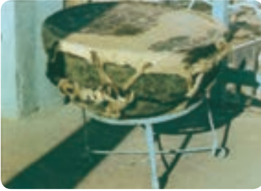
طبل تخم مرغی