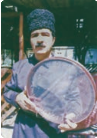
قوال در موسیقی عاشیقی