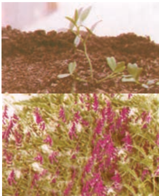
۱- Vicia villosa

۱- خصوصیات گیاه: گیاهی است یک‌ساله یا دو‌ساله، بالارونده به ارتفاع ۳۰ تا ۶۰ سانتی‌متر، ساقه‌ها منشعب، ظریف، پوشیده از کرک‌های متراکم یا بدون کرک، برگ‌ها شانهای و شامل ۵ تا ۱۰ جفت، برگچه دارای پیچک، ریشه‌ها عمیق و راست و گل‌آذین خوشه‌ای گل‌ها به رنگ ارغوانی و میوه نیام که سطح آن دارای کمی رگه‌های مشبک می‌باشد، هر میوه دارای ۴ تا ۶ بذر و بذرها تیره و سیاه هستند.