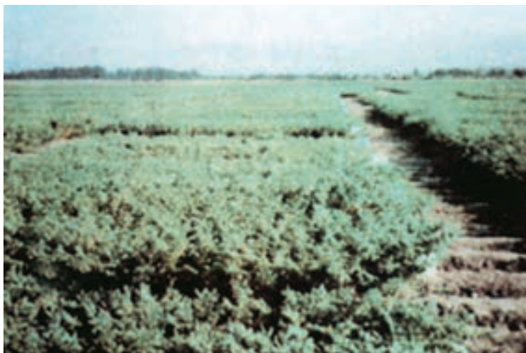
شکل ۴-۴- مزرعه ی تحقیقاتی نخود

زمین آماده شده ی خود را با بذور که نوع رقم و ویژگی های آن ها را کاملاً به دست آورده اید در زمان و با روشی که هنرآموز شما تأیید می کند، بکارید.