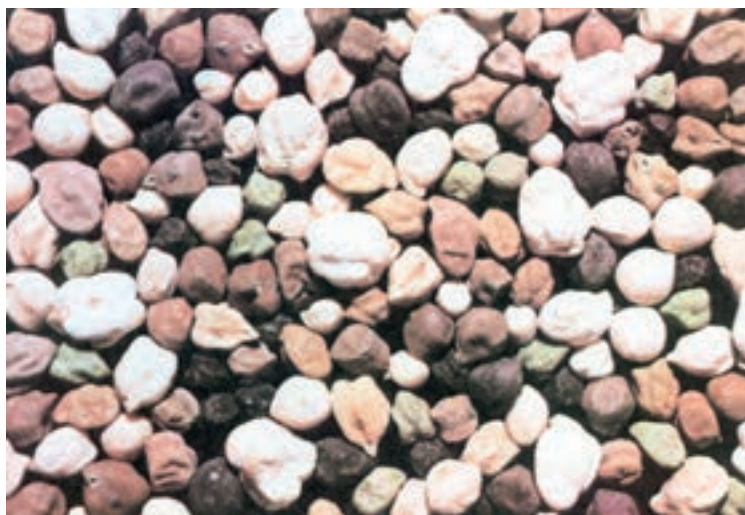
شکل ۳-۴- تیپ‌های مختلف دانه‌ی نخود

ارقام مختلف نخود را در منطقه‌ی خود جمع‌آوری کرده آن‌ها را از نظر شکل ظاهری، ویژگی‌های اقلیمی و زراعی مورد مکالمه قرار دهید.