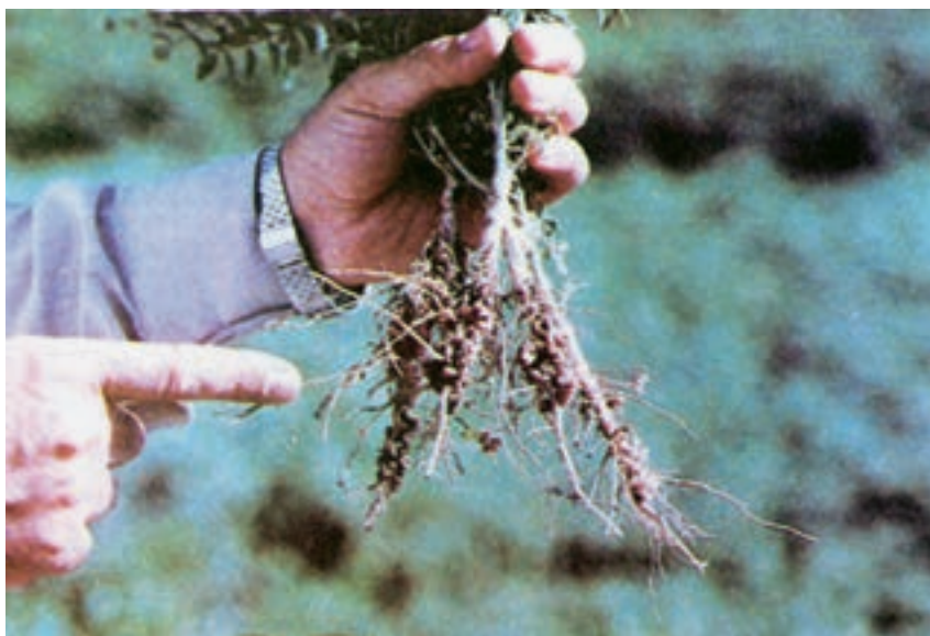
شکل ۱-۴ - گره‌های باکتریایی بر روی ریشه‌ی نخود

پوشیده از کرک‌های ظریف. ریشه‌ی راست، قوی و سریع‌الرشد و منشعب که انشعابات فرعی، بیش‌تر در لایه‌های سطحی (۳۰-۴۰ سانتی‌متری خاک) در حالی که ریشه‌ی اصلی در وضعیت مناسب خاک تا بیش از دو متر نفوذ می‌کند. بر روی ریشه، غده‌ها ۱ یا گره‌های کلیوی شکل در اثر همزیستی با باکتری‌های همزیست ایجاد می‌شود (شکل ۱-۴). برگ‌های مرکب فرد شانه‌ای با گوشوارک و متناوب، گل‌ها نامنظم و کامل که به صورت یک یا دو و به ندرت ۵ تایی در گل‌آذین خوشه‌ای قرار گرفته‌اند. رنگ گل‌ها سفید، ارغوانی، آبی روشن و آسمانی و صورتی می‌باشد. ۵ کاسبرگ ۵ گلبرگ پروانه‌ای شکل، ۱۰ پرچم و یک مادگی یک برچه‌ای، تخمدان زیرین و تمکن جانبی است. نوع میوه‌ی نیام یا غلاف به طول ۳-۵/ سانتی‌متر است که معمولاً یک و بعضاً دو و به ندرت ۳ عدد دانه درون آن وجود دارد.