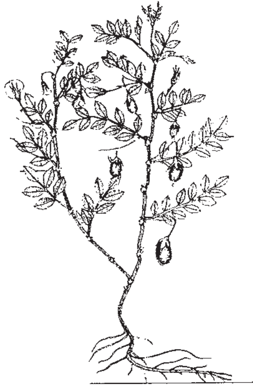
شکل ۲-۴- نخود و اندام‌های مختلف آن