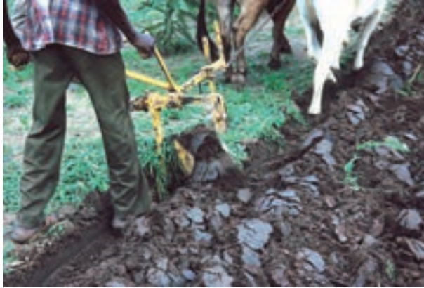
شکل ۲-۵- استفاده از دام برای شخم زدن زمین

مرحله بعد با کشف فلز و در نهایت آهن به وقوع پیوست. لذا انسان برای ساخت ابزار از آهن استفاده کرد و گاو آهن به وجود آمد. نام گاو آهن برگرفته از نام دامی که آن را می کشید (گاو) و جنس ابزار ساخته شده یعنی آهن بود.