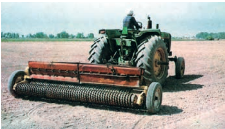
شکل ۴-۲ — عملیات بذرکاری با بذرکار مخصوص (علوفه‌کار)

کاشت یونجه معمولاً به دو صورت دستی یا با ماشین انجام می‌شود. در کشت دستی که معمولاً در زمین‌های با سطح کوچک کاربرد دارد یونجه را به صورت کرتی کشت می‌کنند. در این روش عملیات داشت و برداشت نیز به ناچار با دست انجام می‌گیرد. کاشت با ماشین‌های بذرکار: این روش معمولاً در زراعت‌های بزرگ عملی می‌باشد. بعد از عملیات آماده‌سازی زمین با استفاده از ماشین‌های بذرکار مخصوص به کاشت اقدام می‌گردد (شکل ۴-۲).