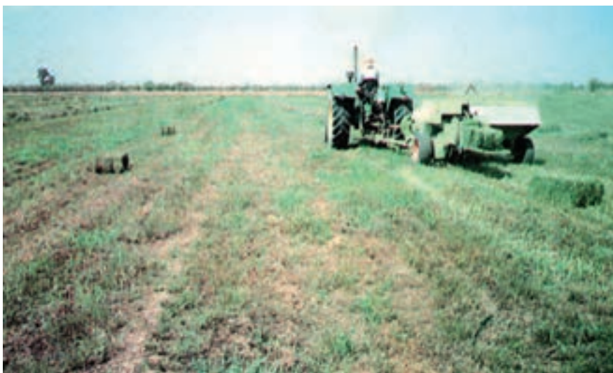
شکل ۲-۸- عملیات بسته‌بندی یونجه با دستگاه بیلر