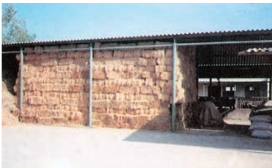
شکل ۱۰-۲- نحوه‌ی نگهداری بسته‌ها در فضای سرپوشیده