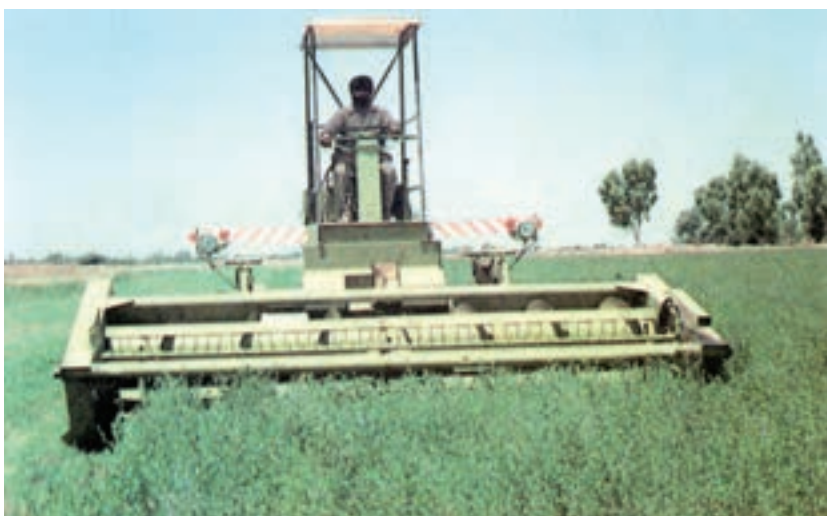
شکل ۶-۲- برداشت یونجه به وسیله‌ی دستگاه سواتر