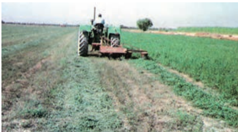
شکل ۵-۲- عملیات برش یونجه با دستگاه موور

(قدّاره) صورت می‌گیرد. این روش با توجّه به میزان کارکرد یک نفر کارگر در روز و میزان دستمزد روزانه، در اراضی وسیع مقرون به صرفه نیست. در مزارع بزرگ از ماشین آلات خاصی برای درو استفاده می‌شود. ابتدا به وسیله‌ی ماشین دنباله بند دروگر یا موور (شکل ۵-۲) یونجه بریده می‌شود و پس از ۲۴-۴۸ ساعت - بسته به فصل و شرایط آب و هوایی منطقه - مقداری از آب خود را از دست می‌دهد. برای درو یونجه از ماشین خودگردانی به نام سواتر نیز استفاده می‌کنند (شکل ۶-۲).