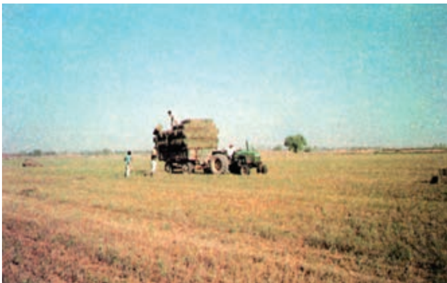
شکل ۹-۲- جمع‌آوری و انتقال بسته‌ها