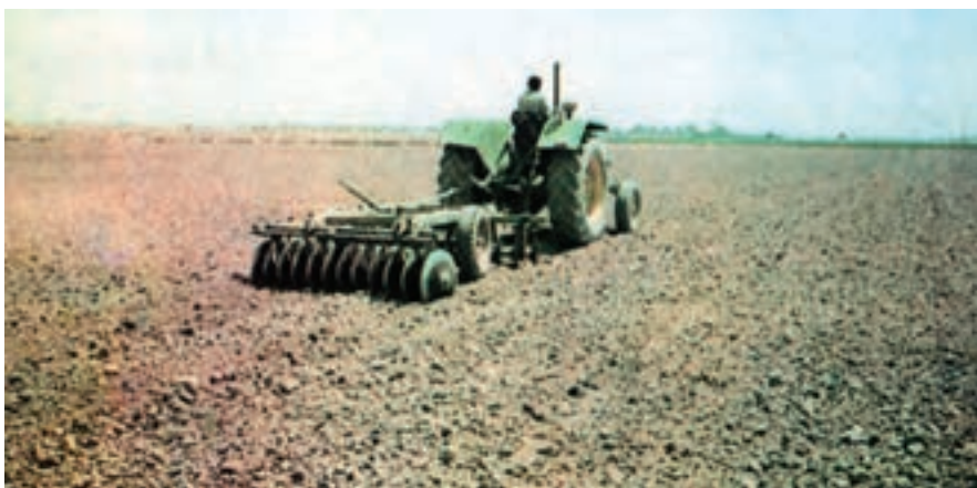
شکل ۲-۲- عملیات دیسک زدن در زراعت یونجه

۱- آماده سازی فیزیکی: در آماده سازی فیزیکی خاک یونجه، باید دقت زیادی به عمل آورد. زمین یونجه باید یکنواخت، پوک، با ماده‌ی آلی کافی حداقل ۱/۵ درصد و عاری از علف‌های هرز باشد. در موقع تهیه‌ی زمین، باید به شیب زمین و امتداد نهادهای آبیاری و زهکشی و هم چنین روش آبیاری توجه زیادی داشته باشیم. برای ایجاد تخلخل کافی در خاک، در پاییز حداقل یک ماه قبل از کاشت پس از مصرف حدود ۳۰ تن کود دامی شخم عمیق زده می‌شود. سپس اقدام به نرم و هموار کردن خاک و گاهی فشرده کردن لایه ۲-۳ سانتی متر سطح خاک جهت اتصال بهتر بذور با خاک می‌نمایند. در صورتی که ماده‌ی آلی خاک بالا باشد و خطر سله مطرح نباشد، اجرای اتیواتور نیز مناسب است. در کاشت بهاره به منظور نرم کردن سطح خاک و از بین بردن علف‌های هرزی که ممکن است رویده شده باشند می‌توان از کولتیواتور هم استفاده کرد. شکل‌های ۲-۲ و ۲-۳ عملیات آماده سازی فیزیکی خاک را در زراعت یونجه نشان می‌دهند.