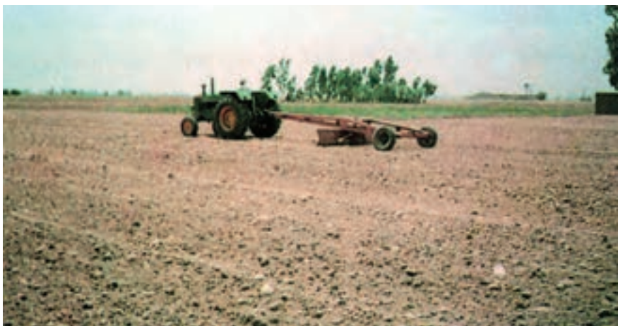
شکل ۲-۳- تسطیح کردن زمین توسط زمین صاف‌کن (لندلولر)