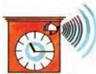
die Uhr schlägt