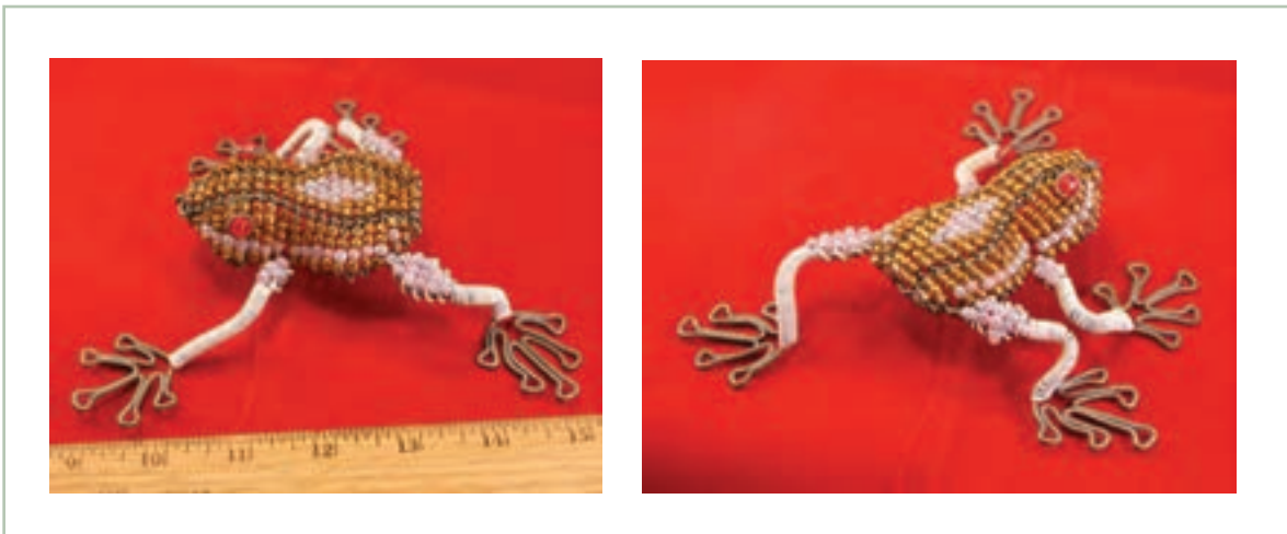
تصویر ۱-۷۴- استفاده از منجوق برای تولید بافت در اجمام ساده