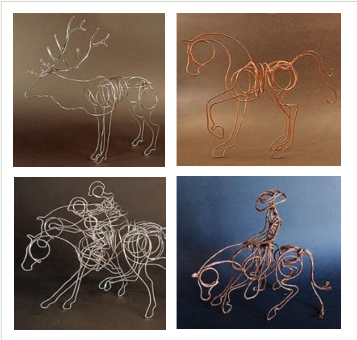
تصویر ۱-۷۳- مراحل ساده تبدیل حجم و سه بعدی کار