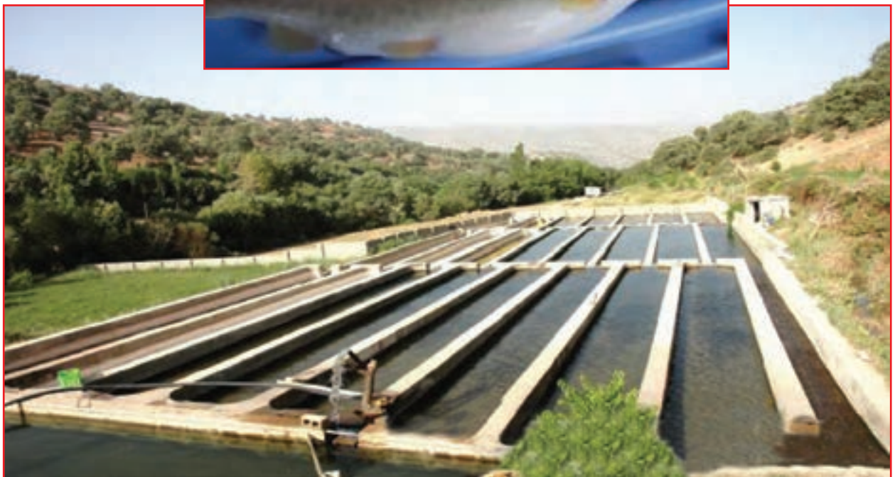
شکل ۱۹-۵ - مزرعه پرورش ماهی قزل آلا