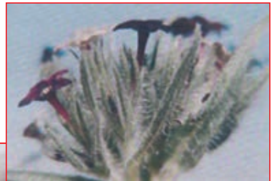
گل عسل، هوه جویه (گل)