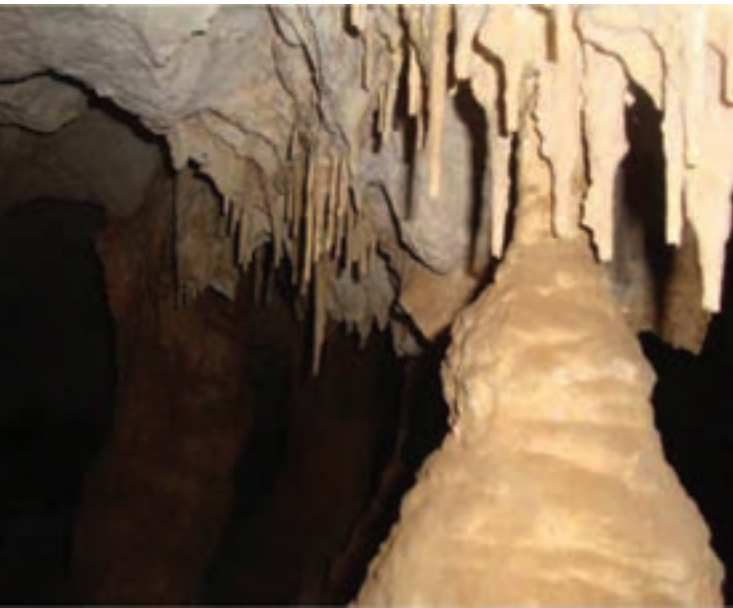
شکل ۸-۵- غار، روستای ده شیخ در بخش پاتاوه

۳- آبشارها: آبشارهای معروف استان عبارت‌اند از: آبشار یاسوج، آب نهر کاکان، آبشار شهنیز، آبشار تنگ تامرادی و آبشار بهرام بیگی در شهرستان بویراحمد، آبشار کمر دوغ و آبشار خیمه و کوه دیوک در کهگیلویه و آبشار مفید، آبشار منج و آبشار کوه گل، آبشار آب سیا (چاگل) در شهرستان دنا، آبشار طسوج در چرام، آبشار شادگان در شهرستان باشت، آبشار رودبال، آبشار هرجون و آبشار کیوان لیشر در شهرستان گچساران.