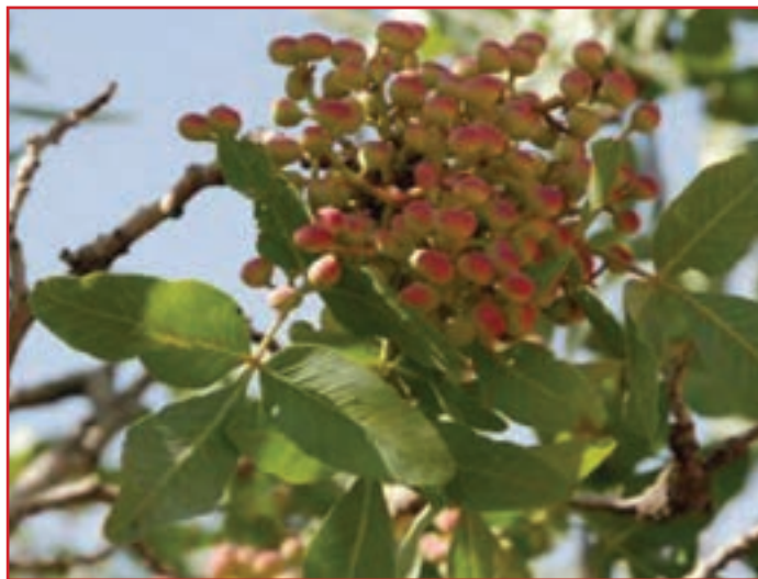
شکل ۳۵-۱ نمونه ای از میوه های جنگلی استان