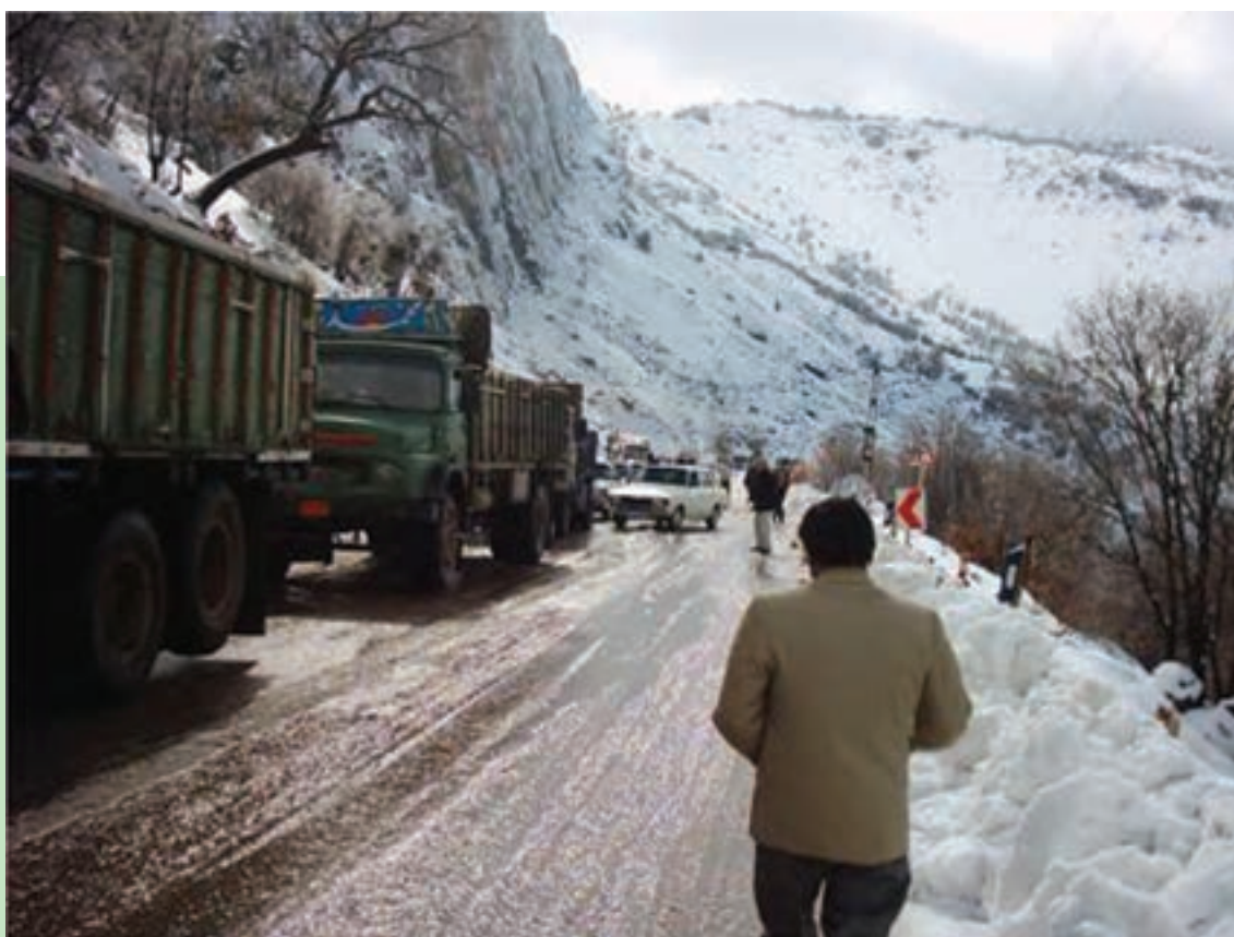
شکل ۴۱-۱ مشکلات ناشی از یخ‌بندان

یخ‌بندان سطح زمین در استان : سرمازدگی و یخ‌بندان و برف در استان در ماه‌های آبان، آذر، دی، بهمن و اسفند در مناطق سردسیری استان به تناوب وجود دارد و بیشترین یخ‌بندان در یاسوج و سی سخت اتفاق می‌افتد که می‌توان از طریق ایجاد حرارت به وسیله بخاری، آتش زدن کاه و گلش و شاخه‌های هرس شده، استفاده از دستگاه‌های مولد باد به منظور برهم زدن پایداری هوا و استفاده از هورمون‌های گیاهی تأخیر در شکوفه‌دهی و ... ، از خسارت ناشی از سرمازدگی جلوگیری کرد. پدیده گرد و غبار از جمله دیگر مخاطرات طبیعی در استان مثل سایر نقاط جنوب و جنوب غربی کشور است که خساراتی به استان وارد می‌کند. می‌توان با برنامه‌های کوتاه و بلند با این پدیده نیز مقابله کرد.