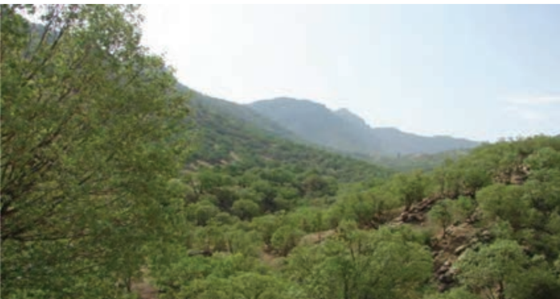
شکل ۲۹-۱ چشم اندازی از جنگل‌های زیبای استان

جنگل : استان ما دارای بیش از ۸۷۴۰۰۰ هکتار جنگل و بیشه زار است؛ و همچنین بیش از ۲۰۰۰ هکتار جنگل دست کاشت در استان وجود دارد. گسترده‌ترین جامعه جنگلی که بخش عمده‌ای از سطح استان را در بر می‌گیرد، درختان بلوط است (حدود ۸۰ درصد) که در مناطق سردسیر و معتدل استان قرار دارد. در استان گونه‌هایی از پوشش گیاهی زاگرس، خلیج عمانی کاسا دیده می‌شود. که شامل درختان بلوط ایرانی بنه (پسته وحشی)، افرا یا کیکم، زبان گنجشک (ون)، داغان (تاگ)، کلخونگ (کله خونگ)، مهلب