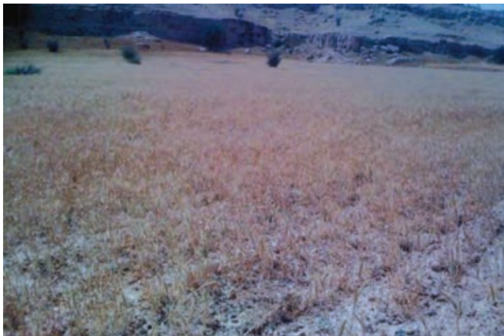
شکل ۴۰-۱. آثار خشکسالی در منطقه گرمسیر استان

خشکسالی در استان : استان ما به لحاظ منابع آبی جزء غنی‌ترین استان‌های کشور است. بیشینه بارش زمستانه کشور در این استان (یاسوج) واقع شده است. اما طبق بررسی و تحلیل آماری به فاصله هر هفت سال یک بار بارش‌های کمتر از میانگین بلند مدت که زمینه حضور خشکسالی را فراهم آورده، در آن وجود داشته است. شدیدترین خشکسالی طی سال‌های اخیر مربوط به سال زراعی ۱۳۸۷ و ۱۳۸۶ بوده که خسارت بسیار زیادی به بخش‌های مختلف تولیدی استان وارد کرده است.