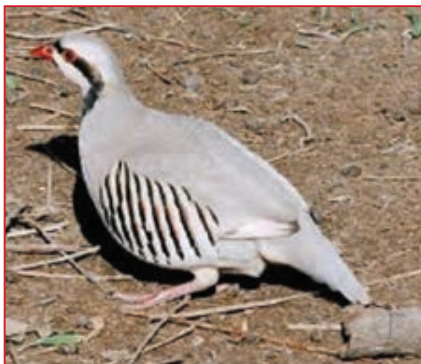
شکل ۳۴-۱ نمونه‌ای از حیات وحش استان