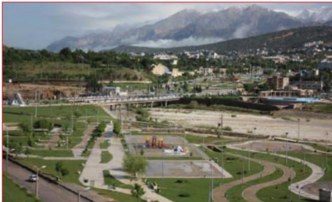
شکل ۳۷-۱ چشم اندازی از شهر زیبای یاسوج

۴- از شهر پاتاوه تا محل خروج رود از استان در مسیری به طول ۷۰ کیلومتر منابع آلاینده کاهش می‌یابد.