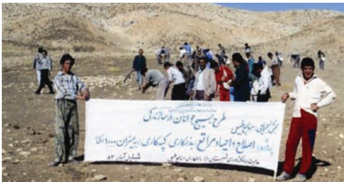
شکل ۳۲-۱. اصلاح و احیای مراتع توسط جوانان