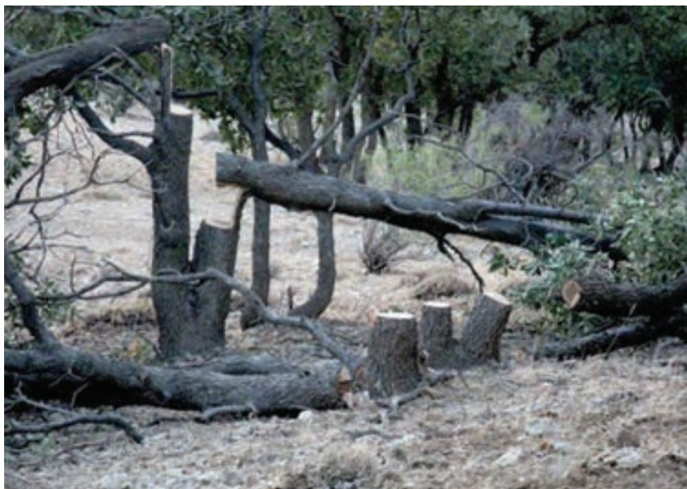
شکل ۳۳-۱ قطع بی‌رویه درختان عامل نابودی جنگل‌ها

۳- مراتع ضعیف (درجه ۴): با برداشت ۱۵۰ کیلوگرم در هر هکتار مهم‌ترین بهره‌برداری‌ها از مراتع استان عبارت است از: مصارف دارویی، صنعتی، خوراکی، تهیه انواع عطرها و تأمین علوفه برای دام‌ها.