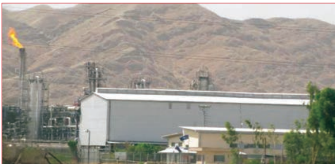
شکل ۳۶-۱- صنایع آلاینده هوا

عواملی که موجب آلودگی هوا در استان می‌شوند، عبارت‌اند از: عوامل طبیعی مانند گرد و خاک و عوامل انسانی مانند وسایل نقلیه موتوری - واحدهای تولیدی و صنعتی و غیره. از نظر آلودگی هوا به جز شهر دوگنبدان، مرکز گچساران که بر اثر استخراج نفت ایجاد شده و گسترش یافته است، در شهرهای دیگر استان خوشبختانه هوا آلوده نیست.