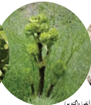
ب) آنغوزه (گنه بو)