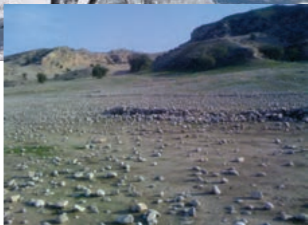
شکل ۱۲- منطقه گرمسیر استان