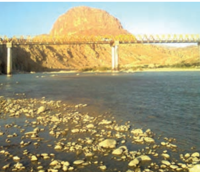
شکل ۱۶-۱- رود مارون

۱- رود مارون ۱ : این رود که بیشترین مساحت حوضه آبریز را در استان به‌خود اختصاص داده، از ارتفاعات نرماب، دمه سادات و مارگون بویراحمد، چاروسا و طیبی در شهرستان کهگیلویه سرچشمه می‌گیرد و در نهایت، به نام رود مارون از مرز استان (تنگ تکاب) خارج می‌شود. آنگاه، پس از دریافت سیلاب‌ها و رودهای دیگر، با نام جراحی به خلیج فارس می‌ریزد.