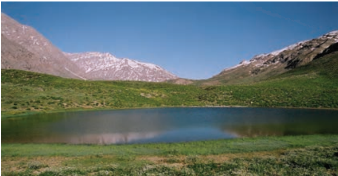
شکل ۱-۲۲- دریاچه کوه گل در ارتفاع ۲۰۰۰ متری دنا