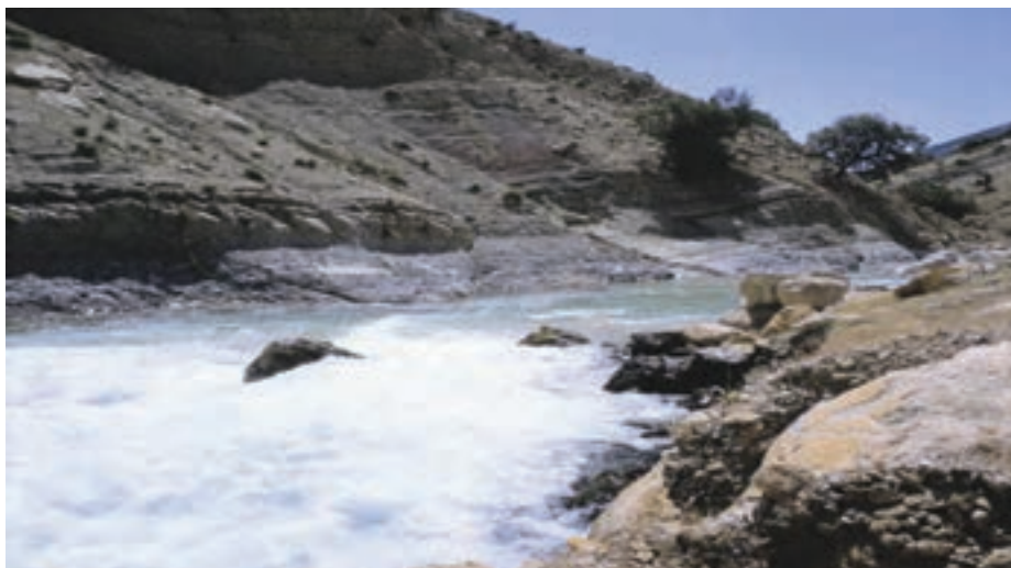
شکل ۱۹-۱- رود جن