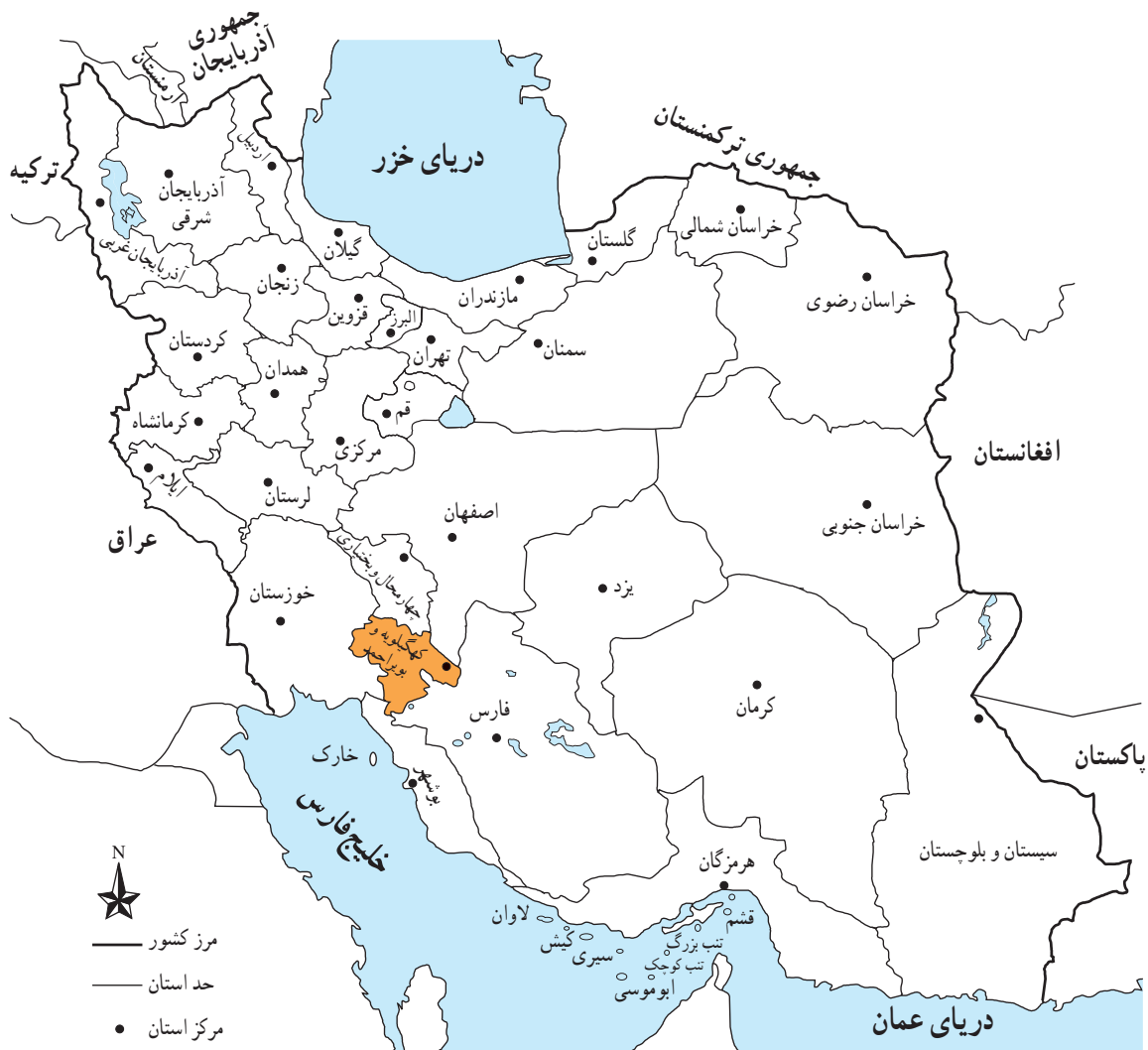
شکل ۱-۱- نقشه تقسیمات کشوری ایران به تفکیک استان‌ها

به شکل ۱-۱ نگاه کنید. آیا می‌دانید استان کهگیلویه و بویراحمد در کدام قسمت ایران واقع شده است و با کدام استان‌ها همسایه است؟ استان کهگیلویه و بویراحمد حدوداً ۱۶۲۶۴ کیلومتر مربع وسعت دارد.