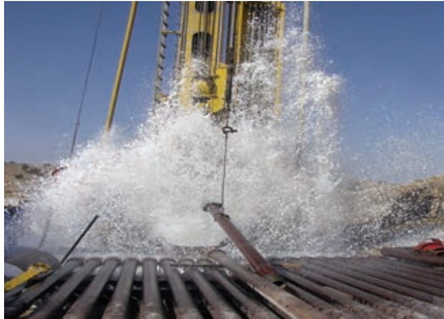
شکل ۲۴-۱- حفر چاه برای تأمین آب مورد نیاز