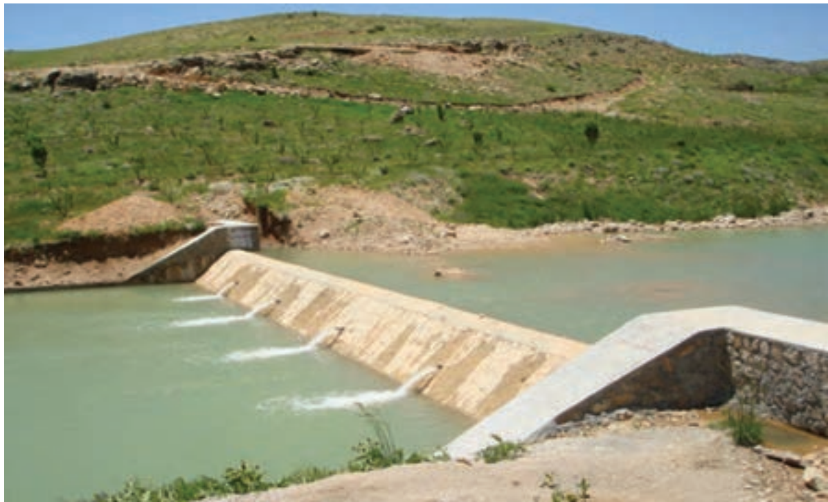
شکل ۲۶-۱- پروژه آبخیزداری بندسنگی ملاتی سرچنار