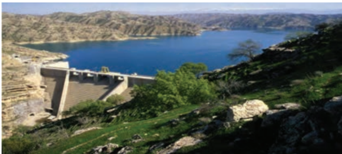
شکل ۲۵-۱- سد کوثر