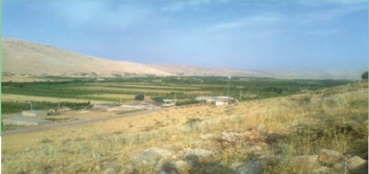
شکل ۱-۷- دشت روم در بویراحمد