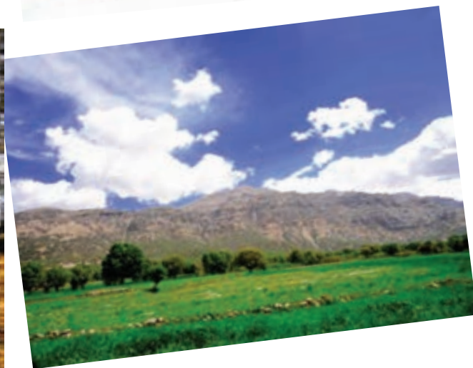
شکل ۹-۱- چشم‌اندازی از مناطق مختلف استان در فصول گوناگون