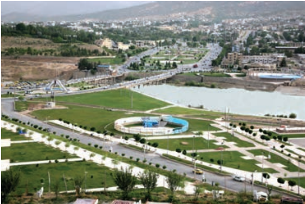
شکل ۱۷-۱- مسیر رودخانه بشار در شهر یاسوج

۳- رودخیرآباد : این رود که تا چندی پیش به رود شیرین معروف بود، از بخش مرکزی استان، یعنی دیلگان بویراحمد و تسوج کهگیلویه سرچشمه گرفته و در مسیر خود به نام‌های رود سرکورتیه تسوج، پیچاب، شاه بهرام و نازمکان شناخته می‌شود و پس از دریافت آب رودخانه‌های سیاه و خونی به نام رود خیرآباد جریان می‌یابد و سرانجام در نزدیکی روستای حیدرکرار واقع در ضلع جنوب شرقی زیدون بهپهان به رود زهره می‌پیوندد.