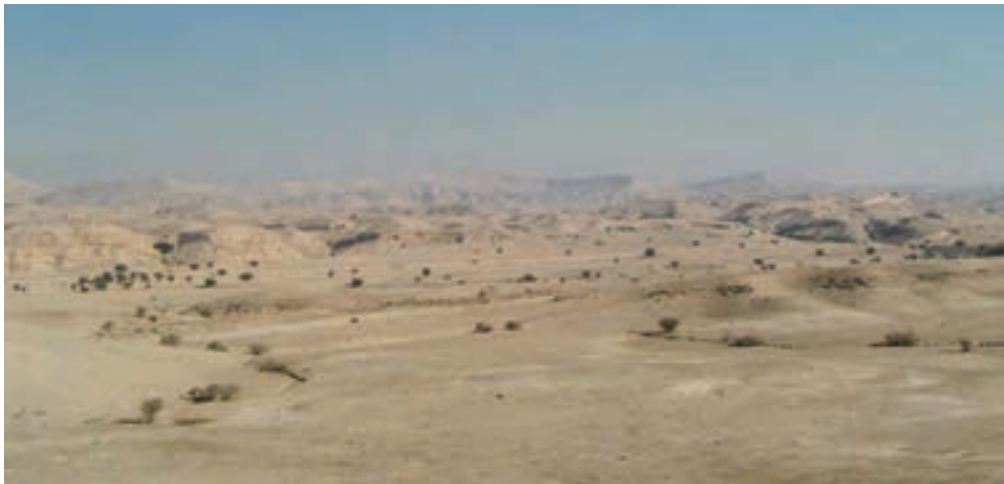
شکل ۴-۱- چشم اندازی از کوه‌های منطقه پست استان (لیشتر)

بلندترین نقطه استان، قلّه دنا با ارتفاع ۴۴۰۹ متر در شهرستان دنا و پایین‌ترین نقطه آن، چره زن (حیدر کرار) در جنوب غرب بی‌بی حکیمه در شهرستان گچساران است که حدود ۱۹۷ متر ارتفاع دارد. یعنی بین بلندترین نقطه و پایین‌ترین نقطه حدود ۴۲۸۵ متر اختلاف ارتفاع است که تنها ۲۰۰ کیلومتر از هم فاصله دارند و اختلاف دمای بین آنها حدود ۳۳ درجه سانتی‌گراد است.