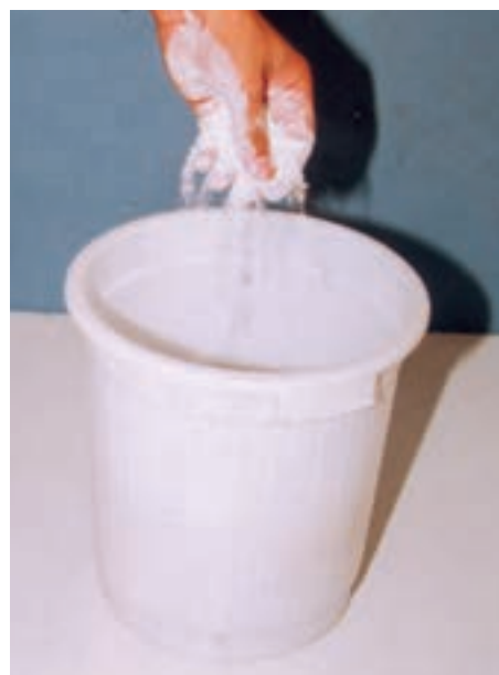
تصویر ۱- الف - ریختن پودر گچ در آب

کرده، خیس شود. پس از این مرحله با استفاده از همزن دستی یا برقی به مدت ۱/۵ دقیقه مخلوط را به هم می‌زنیم تا گچ کاملاً در آب مخلوط شود. سرعت همزن باید به اندازه‌ای باشد که