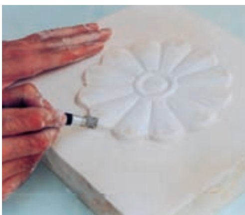
تصویر ۴-و - ایجاد ظریف کاریها روی نقش برجسته