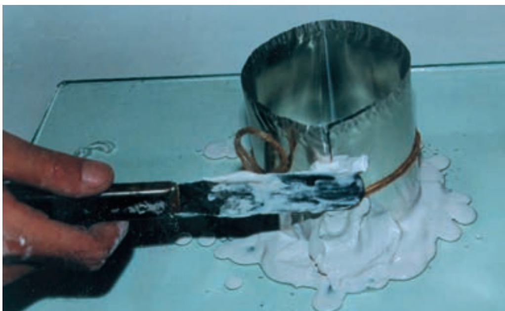
تصویر ۳- ساخت قالب کلی به شکل استوانه و بستن درزهای آن با خمیر گچ

گچ به دیواره جلوگیری و پس از گیرش به راحتی از قالب جدا شود (تصویر ۴).