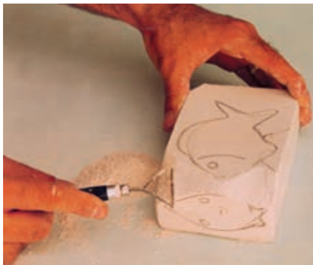
تصویر ۶- ب - تراشیدن قسمت‌های اضافی