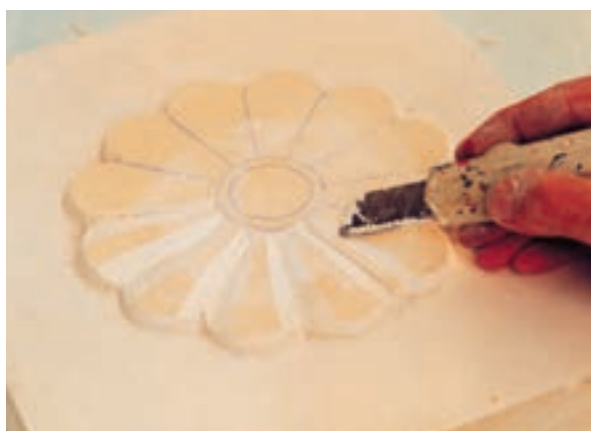
تصویر ۴-ه - ایجاد حجمهای داخل طرح