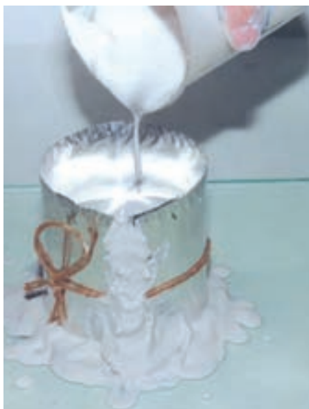
تصویر ۵- ب- ریختن دوغاب گچ آماده شده در قالب