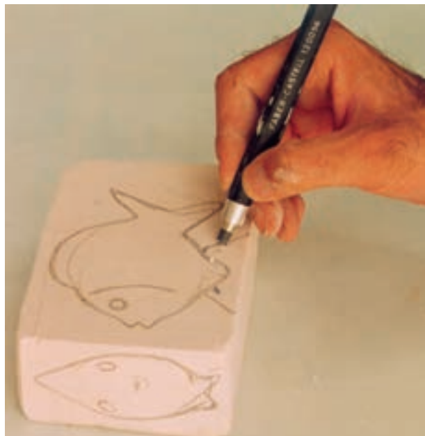
تصویر ۶- الف - انتقال طرح روی سطح گچ

پس از مدتی گچ خود را خواهد گرفت، دیواره قالب را باز کرده، کار حجم‌سازی را شروع می‌کنیم. این کار می‌تواند با انتقال طرح روی سطح گچ یا به صورت ذهنی انجام شود. برای