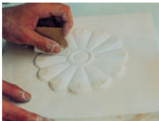
تصویر ۴-ح - پرداختکاری نقش برجسته با سمباده