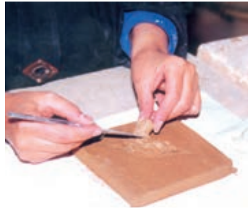
تصویر ۳- الف - افزودن خمیر گل بر سطح طرح

۱-۲- ساخت نقش برجسته گلی به روش افزودن: در این روش با افزودن گل بر روی سطح، برجستگی به وجود می‌آید. ۱ لوح گلی مناسب برای این کار بهتر است ضخامتی در حدود یک تا دو سانتی متر داشته باشد. طرح را روی لوح گلی انتقال می‌دهیم و بر روی سطح طرح شیارهایی ایجاد نموده، با کمی دوغاب ۲ از