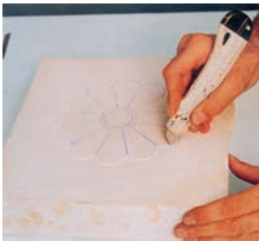
تصویر ۴- ب - برش محیط طرح