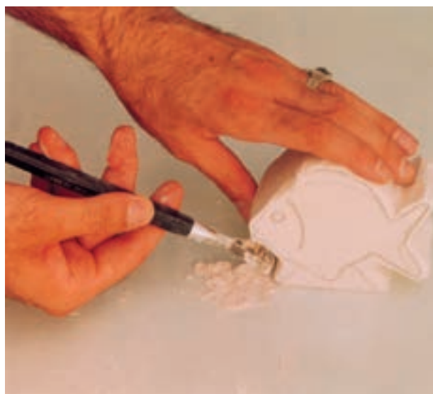
تصویر ۶- ج - تراشیدن قسمت‌های اضافی