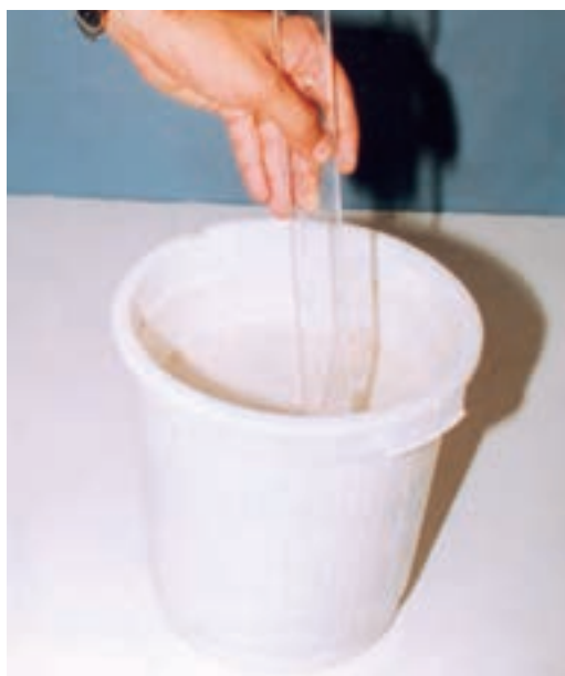
تصویر ۱- ب - مخلوط کردن دوغاب گچی با همزن دستی

در طول این مدت گچ کاملاً مخلوط شود. در غیر این صورت دوغابی ناهمگن به دست خواهد آمد که برای ساختن حجم مناسب نیست (تصویر ۱- الف و ب).