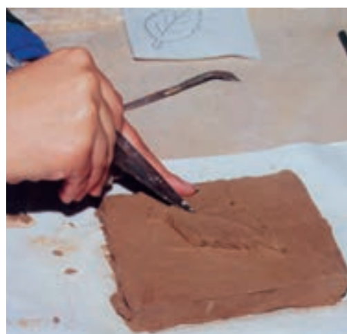
تصویر ۱- ز - ساخت و ساز و ایجاد ظرایف طرح

می‌کنیم. این مرحله باید به تدریج انجام شود تا لوح تاب و ترک برندارد. بهتر است لوح را روی صفحه توری یا زیر پوشش نایلونی منفذدار، به دور از جریان مستقیم هوا، خشک کنیم (تصویر ۲).