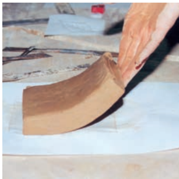
تصویر ۱- الف- مقدار رطوبت لوح زیاد است و هنگام بلند کردن خم می‌شود.