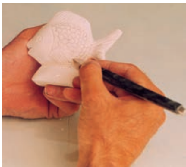
تصویر ۶- د - ایجاد ظرافت و ریزه‌کاریها