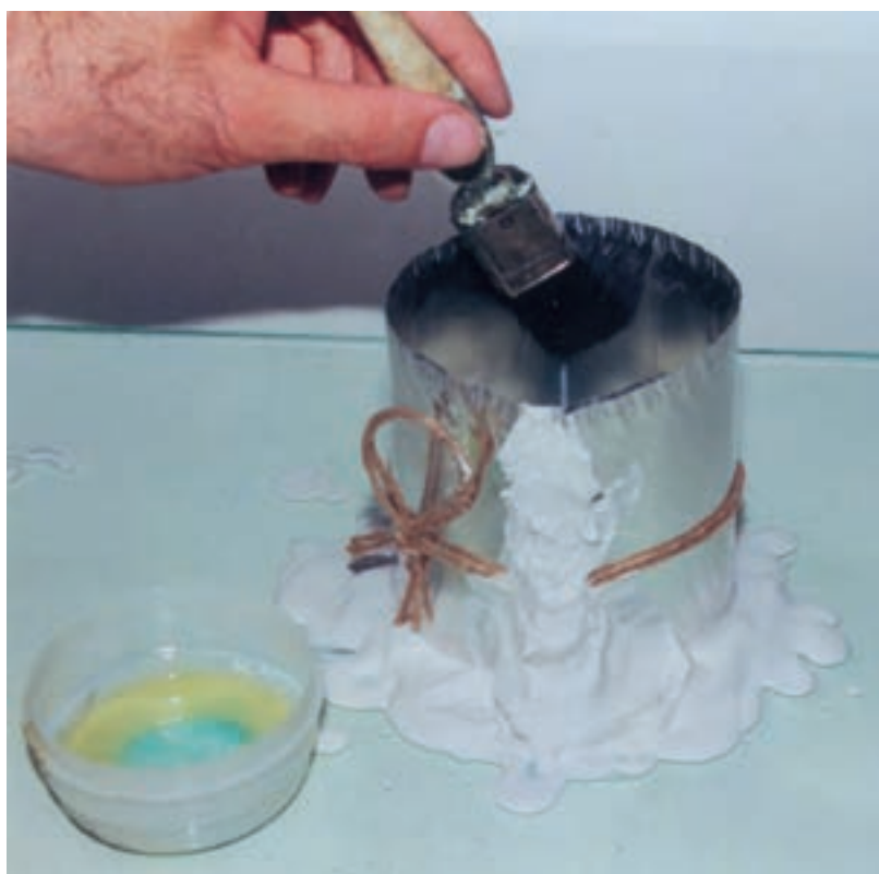
تصویر ۴- چرب کردن دیواره‌های داخل قالب با قلم مو

پس از حصول اطمینان از صحت این مراحل، سطوح داخلی قالب را با قلم مو چرب می‌کنیم تا از جذب آب و چسبیدن