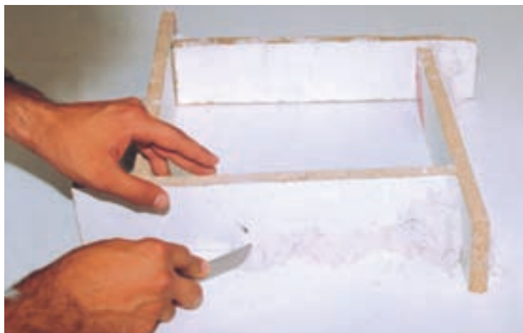
تصویر ۲- ب - بستن درزهای قالب با خمیر گچ

شکل خود را حفظ کند. سپس درزهای آن را با خمیر گل یا گچ مسدود می‌کنیم (تصویر ۳).