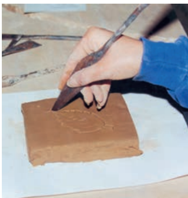
تصویر ۱- د- برش محیط طرح