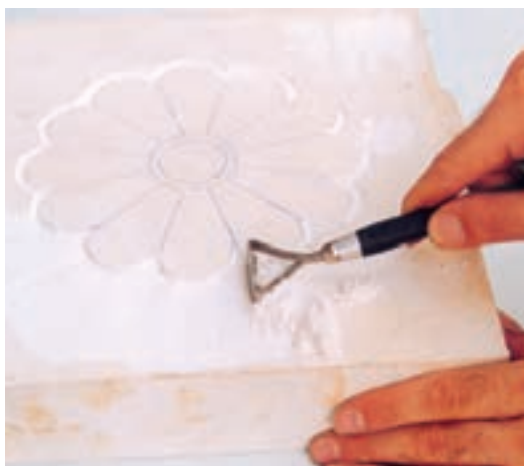
تصویر ۴-د - تراش زمینه برای برجسته شدن طرح