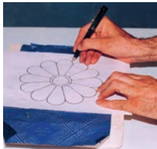
تصویر ۴- الف - انتقال طرح روی لوح گچی

به وجود آید. آن‌گاه نقش را شکل داده به ایجاد ظرایف و ساخت و ساز آن می‌پردازیم. در پایان پرداخت نهایی و صیقلی کردن سطح نقش برجسته را با کاغذ سمباده انجام می‌دهیم (تصویر ۴- الف تا ح). در صورتی که لوح گچی کاملاً خشک باشد، برای سهولت تراش، محل مورد نظر را مرطوب می‌کنیم.