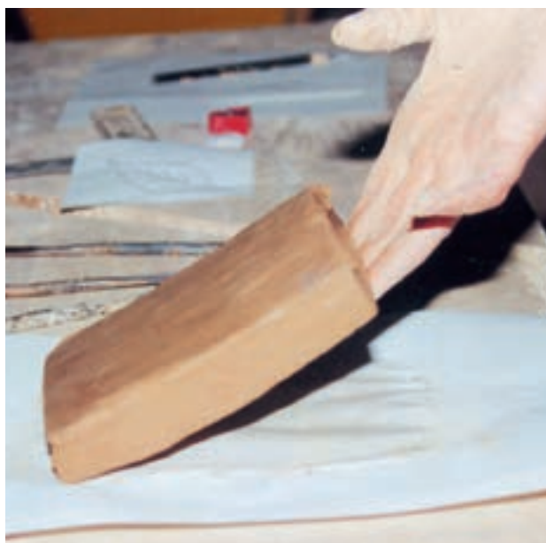
تصویر ۱- ب- مقدار رطوبت لوح برای شروع به کار مناسب است.

پس از آن که لوح گلی آماده کار شد یعنی رطوبت آن به‌اندازه‌ای رسید که به‌هنگام بلند کردن خم نشد، طرح مورد نظر را با ابزار نوک تیزی مانند مداد بر روی آن منتقل نموده و با ابزارهای برش‌دهنده عمق لازم را در خطوط محیطی طرح ایجاد