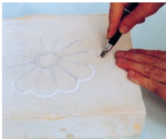
تصویر ۴-ج - جدا کردن طرح از زمینه