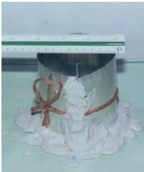
تصویر ۵- الف- اندازه گیری قطر برای محاسبه حجم قالب