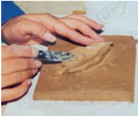
تصویر ۳- ب - شکل دادن حجم گلی

همان گل مرطوب می‌کنیم تا خمیر گل بهتر روی لوح گلی متصل شود. پس از آن لایه خمیر گل بر روی سطح طرح اضافه می‌کنیم تا نقش برجسته به وجود آید. بعد از این که شکل کلی نقش برجسته کامل شد، آن را تا حد چرمینگی خشک کرده و سپس به ایجاد ظرایف و ریزه کاریها می‌پردازیم (تصویر ۳- الف و ب).