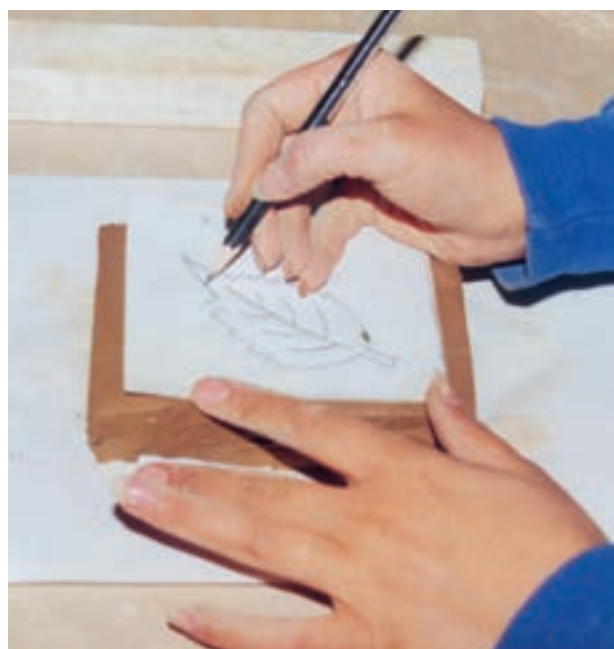
تصویر ۱- ج- انتقال طرح روی لوح