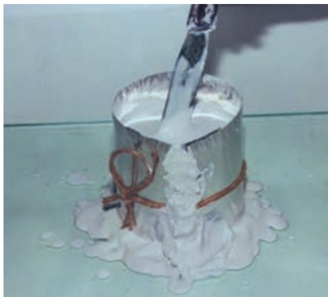
تصویر ۵- ج- خارج ساختن حبابهای هوا از دوغاب گچ