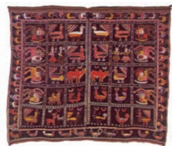
تصویر ۱۶-۲- قلیان‌دان جهت حمل و نگه‌داری قلیان استفاده می‌گردد.