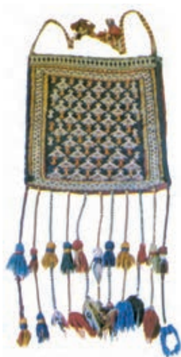
تصویر ۱۳-۲- چنته مانند کیف است و بر دوش حمل می شود.