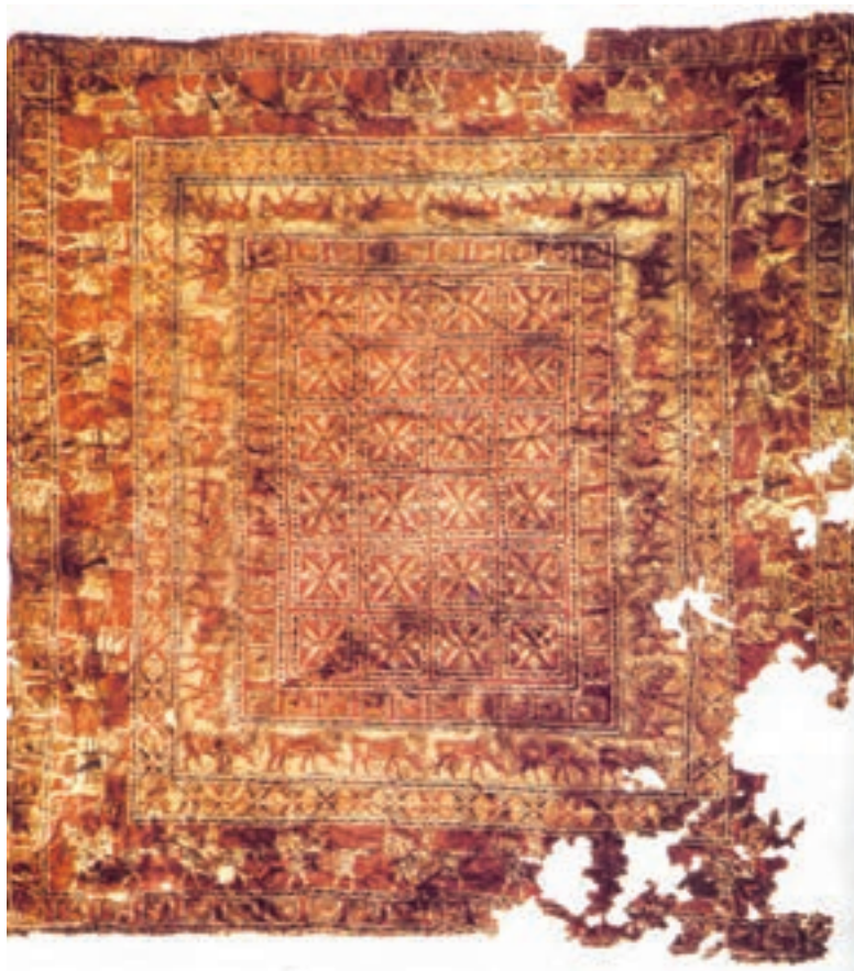
تصویر ۱۱-۱- قالی پازیریک