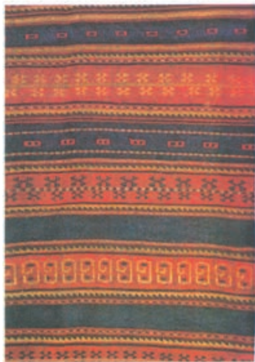
تصویر ۸-۱- نقشی از گلیم کردهای خراسان