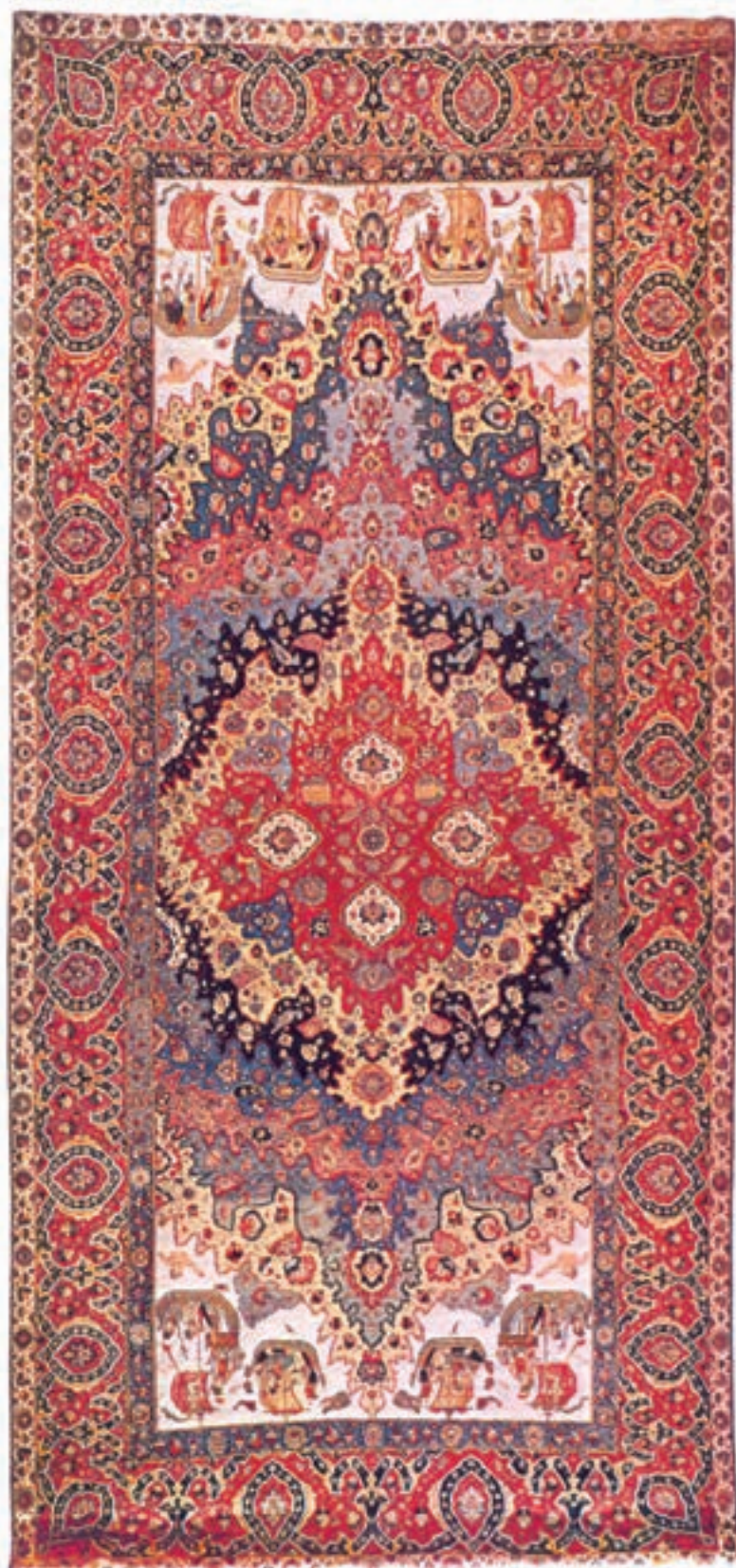
تصویر ۱۷-۱- این قالی عصر صفوی به نام موج دریا شهرت دارد و در موزه‌ی وین اتریش نگهداری می‌شود. طرح قالی به‌خوبی نشانگر ارتباط کشورهای خارجی (پرتغال) با دربار صفوی است. اندازه‌ی قالی ۶۷۷×۳۷۲ سانتی‌متر و محل بافت به اصفهان منتسب می‌باشد.