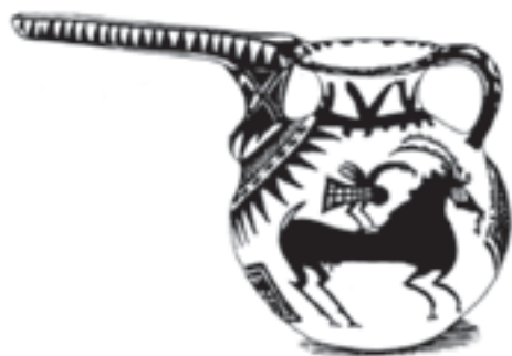
تصویر ۵-۱- نمونه‌هایی از نقش بر سفال