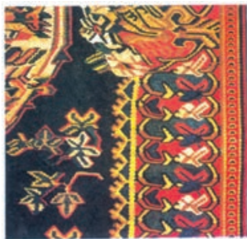
تصویر ۹-۱- نقشی از گلیم بیجار