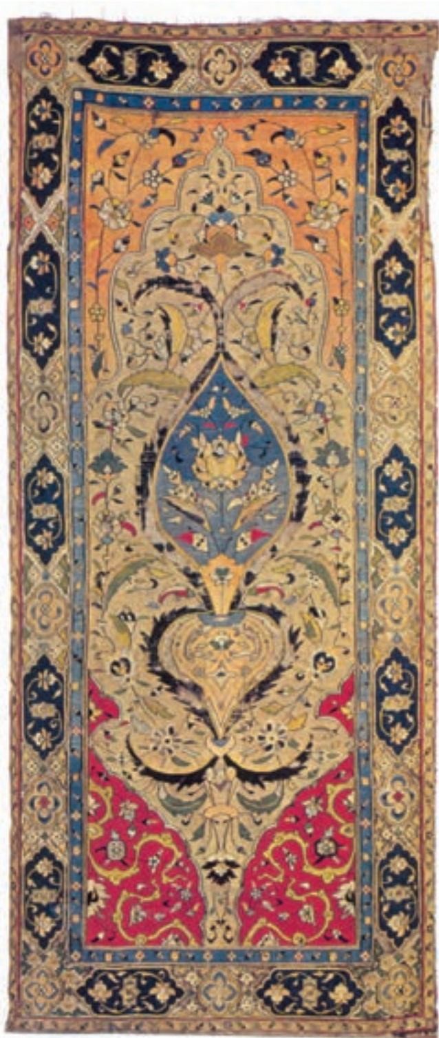
تصویر ۱۰-۱- گلیم متعلق به قرن ۱۰ هجری (موزه ملی ایران)

طرح و نقوش ساده‌ی هندسی به مرور و با کسب تجربیاتی که در بافت گلیم حاصل گردید دچار تغییرات و دگرگونی‌هایی شد. با تغییراتی که به هنگام عبور نخ‌ها از لابه‌لای تارها ایجاد