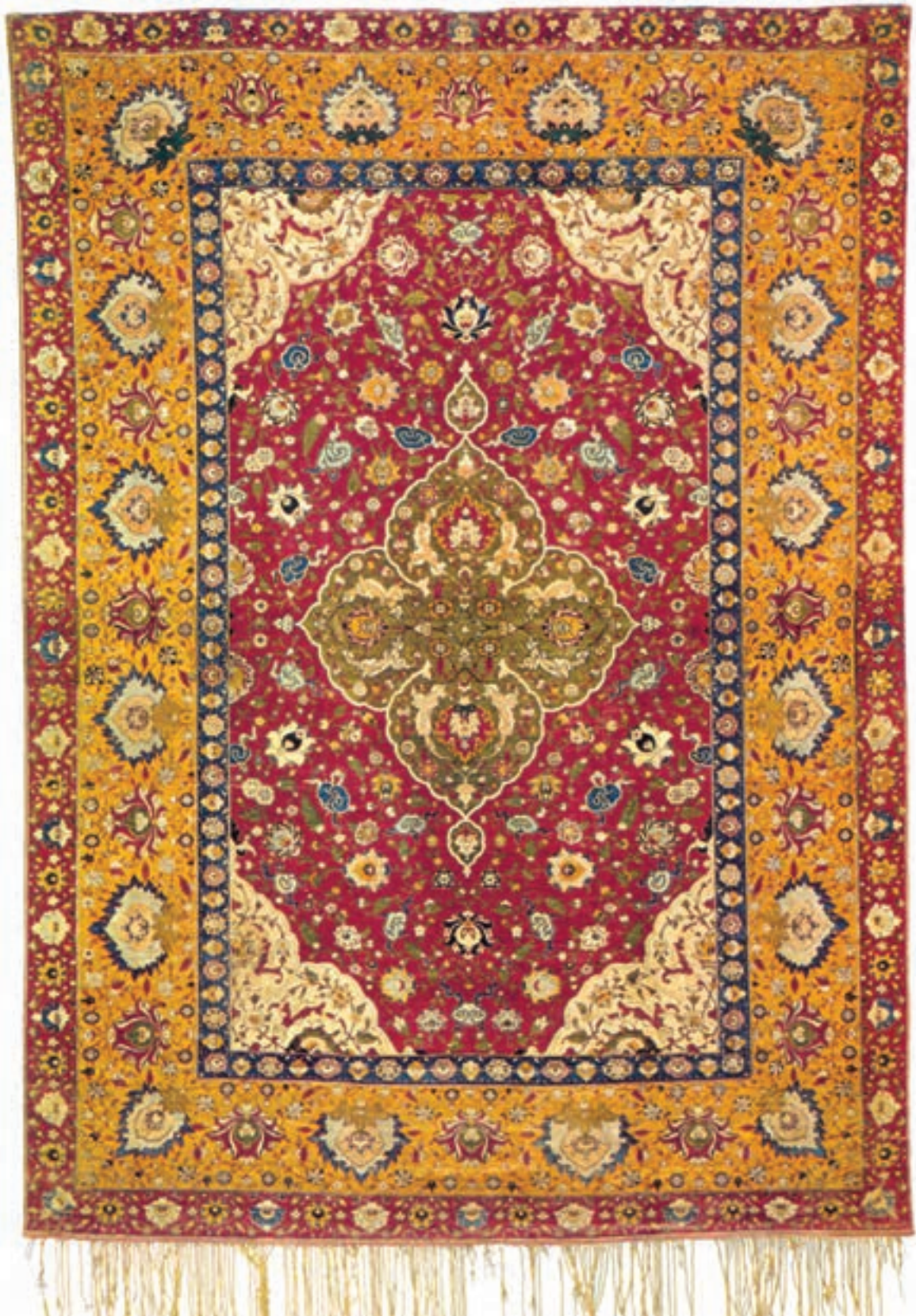
تصویر ۱۹-۱- قالی بافت اصفهان با ابعاد ۲۵۰×۱۵۰ سانتی متر که در قرن دهم هجری بافته شده است. این قالی در موزه‌ی گوبلن پاریس نگهداری می‌شود.