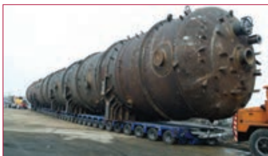
شکل ۴-۱- مخزن پتروشیمی

تکنسین‌ها و مهندسین جوش کاری: تکنسین جوش آرگون، تکنسین نقطه جوش، تکنسین جوش لیزر،