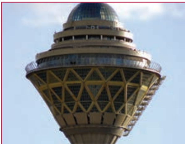
شکل ۱-۱- نقش رشته صنایع فلزی در پروژه‌های عمرانی

رشته صنایع فلزی یکی از رشته‌های بنیادی مورد نیاز کشور است. افراد توانمند و متخصص در این رشته در بخش صنعتی مانند صنایع خودروسازی، پالایشگاه‌های نفت و گاز، ماشین‌سازی و صنایع کوچک صنعتی توانسته‌اند گام مؤثری را در توسعه اقتصاد پایدار کشور بردارند. دانش آموختگان این رشته قادر خواهند بود در تمامی پروژه‌های عمرانی و تأسیساتی و همچنین بازارکار علاوه بر انجام وظایف شهروندی با استفاده از آموخته‌های خویش در مشاغل مرتبط با این رشته در سطوح میانی (کارگر ماهر- تکنسین) به کار اشتغال ورزند. دانش آموختگان با توجه به نیاز بومی، منطقه‌ای و کشوری می‌توانند به رشته‌های مهندسی صنایع، مکانیک جامدات و سیالات راه یابند.