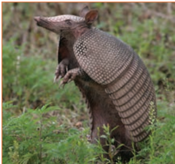
شکل ۹-۱- آرمادیلو

« وَ فِي الْأَرْضِ آيَاتٌ لِلْمُوقِنِينَ وَ فِي أَنْفُسِكُمْ أَفَلَا تُبْصِرُونَ »