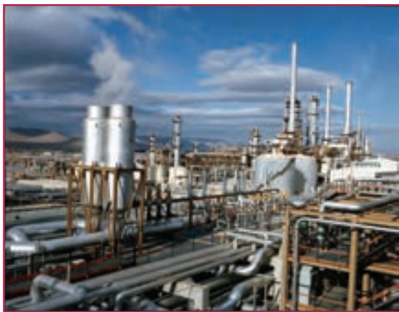
شکل ۱-۳- نقش رشته صنایع فلزی در پتروشیمی