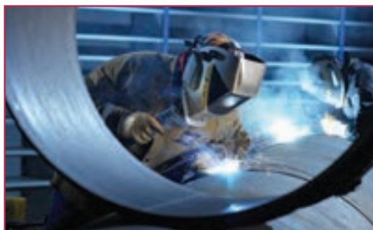
شکل ۵-۱- جوش کاری مخزن فولادی