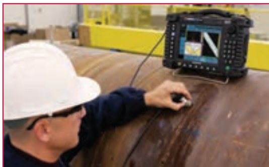
شکل ۶-۱- بازرسی جوش (تست التراسونیک)

تکنسین جوش پلاسما، تکنسین جوش میگ و مگ، بازرسان جوش: تکنسین تست التراسونیک، تکنسین کنترل کیفی جوش، تکنسین تست مایع نافذ و ذرات مغناطیسی برخی از مشاغل رشته صنایع فلزی است که هنرجویان پس از کسب شایستگی‌های لازم در این رشته، می‌توانند در هر یک از این مشاغل‌ها در صنایع نام‌برده مشغول به کار شوند.