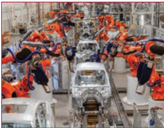
شکل ۱-۲- نقش رشته صنایع فلزی در صنایع خودروسازی