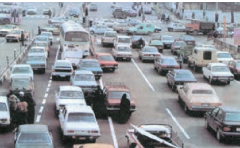
شکل ۱۳-۱- جگونیگی

بررسی عملکرد بنگاه‌های اقتصادی و دولت‌ها، در بسیاری از راهکارهای زیست محیطی در سه دهه‌ی گذشته، حاکی از آن است که آن‌ها به نشانه‌ها و علائم مشکلات زیست محیطی توجه کرده‌اند اما غالباً منشأ و علل اصلی به وجود آمدن این مشکلات و مصائب را نادیده گرفته‌اند. باید دانست که اصلاح آثار و مظاهر امور (توجه به معلول‌ها و نه علت‌ها) یک خصلت بشری و ساده‌نگرانه است که تقریباً در غالب تلاش‌ها و فعالیت‌های انسان دیده می‌شود. در حفاظت محیط زیست نیز نمونه‌های زیادی از این ساده‌نگری‌ها وجود دارد. از آن جمله می‌توان به اسکرابر دودکش ۱ ، مبدل کاتالیزوری ۲ خودرو، زباله‌سوز مواد زاید خطرناک ۳ و دستگاه تصفیه‌ی فاضلاب ۴ اشاره کرد.