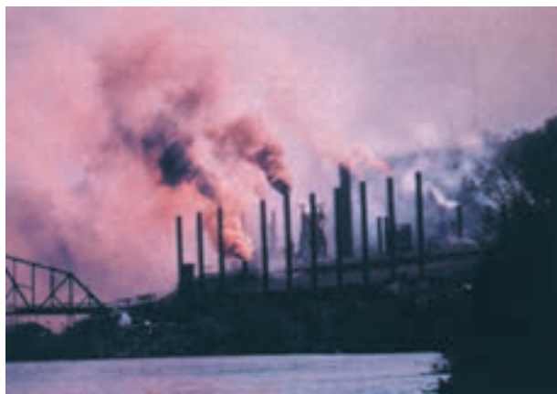
شکل ۱۴-۱- آلودگی صنعتی از کارخانه‌های قدیمی - این گونه صحنه‌ها در کشورهای کم‌تر توسعه یافته دیده می‌شوند و در کشورهای توسعه یافته تا دهه‌های ۱۹۶۰ و ۱۹۷۰ وجود داشتند. پرسش: این تصویر ناقض کدام یک از اصول دهگانه‌ی توسعه‌ی پایدار می‌باشد؟

کشورهای جهان سوم دارای منابع ارزی محدودی هستند؛ با این حال، غالب آن‌ها ارز محدود را صرف وارد کردن ابزارها و ماشین‌آلاتی می‌کنند که فناوری آن‌ها اکثراً قدیمی است و اغلب سبب آلوده کردن محیط زیست می‌شوند و وسایلی نیز که این ماشین‌ها تولید می‌کنند خود مخرب محیط زیست‌اند. ضروری است این گونه جوامع به سراغ پیشرفته‌ترین فناوری‌های سازگار با محیط زیست بروند. فناوری‌هایی مانند فیبرنوری، توربین‌های بادی پیشرفته، بام پوش سیلیکونی مولد برق، سلول‌های فتوولتائیک خورشیدی، سیستم‌های قوس الکتریکی، تولید فولاد از قراضه‌ی آهن، ماشین‌آلات پیشرفته‌ی تولید کاغذ سفید از کاغذ باطله بدون کاربرد کلر، میکروژنراتورهای زباله‌سوز مولد برق، فناوری بازیافت آلومینیوم، قطارها و اتوبوس‌های برقی، مبارزه‌ی بیولوژیک و تلفیقی با آفات نباتی و بالاخره شبکه‌ی اینترنت، نمونه‌ی فناوری‌هایی است که کشورهای جهان سوم از جمله کشور ما می‌توانند روی آن‌ها سرمایه‌گذاری کنند و استفاده از فناوری‌های قدیمی را به طور اکید ممنوع کنند.