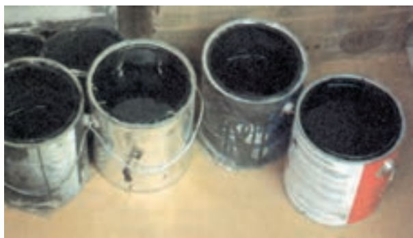
شکل ۱۸-۱- برای جلوگیری از نشت رنگ، باقی مانده‌ی آن در ظروف باید خشک شود و سپس به طریق صحیح دفع گردد.