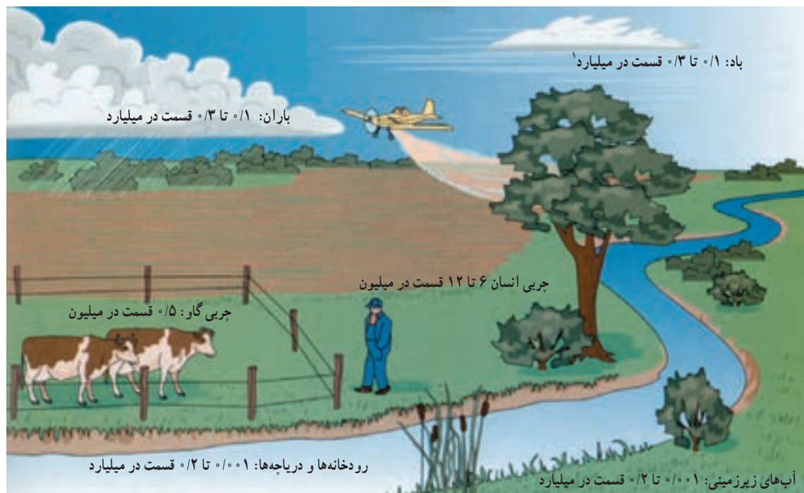
شکل ۱۹-۱- پراکنده شدن آفت‌کش‌ها - آفت‌کش‌های پخش شده توسط هواپیمای سمپاش محیط زیست را آلوده می‌سازد زیرا مقدار زیادی از سموم پراکنده می‌شوند. در این شکل روش‌های مختلف پراکندگی آفت‌کش‌ها دیده می‌شود. میانگین مقدار تجمع د.د.ت بر حسب قسمت در میلیون و میلیارد نشان داده شده است. د.د.ت در چربی بدن حل شده و در قسمت‌هایی که دارای چربی است تجمع پیدا می‌کند.