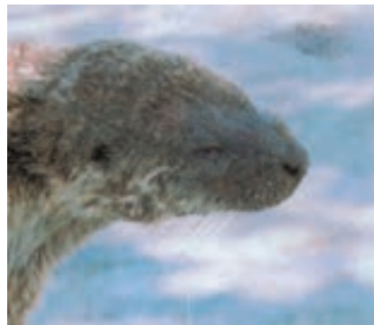
الف — سرسمور آبی (شنگ اروپایی) که در حاشیه‌ی سفیدرود کشته شده است. ب — دو سمور آبی (شنگ) که بر اثر جریان الکتریسیته، در حاشیه‌ی سفیدرود کشته شده‌اند.

شکل ۱۱-۱ — نمونه‌هایی از سمورهای آبی (شنگ) در حاشیه‌ی سفیدرود که معمولاً توسط جریان الکتریسیته، تفنگ، تله‌گذاری و دام‌گذاری کشته می‌شوند. اهالی به بهانه‌ی ماهی‌خوار بودن و همچنین ارزش اقتصادی پوست این حیوان، آن را بی‌رحمانه شکار می‌کنند اما معمولاً جسد خشک شده‌ی این موجود در هر کوی و برزنی در استان‌های شمالی کشور برای فروش دیده می‌شود. اگرچه این حیوان از ماهی و آبزیان مورد نیاز انسان تغذیه می‌کند ولی بررسی‌ها و مطالعات گسترده در اروپا بیانگر این نکته است که شنگ‌ها در بسیاری موارد به نفع ماهی ایفای نقش می‌کنند. بدین ترتیب که از جانوران صیاد آبی یا رقیب غذایی ماهیان تغذیه کرده و جمعیت بسیاری از آن‌ها را در حالت تعادل اکولوژیک قرار می‌دهند.