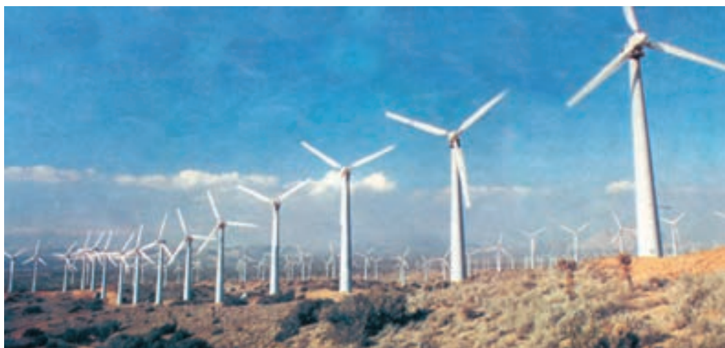
شکل ۱-۱ این توربین‌های بادی بدون ایجاد آلودگی، الکتریسیته تولید می‌کنند و زمین‌های اطراف می‌تواند چراگاه دام باشد.