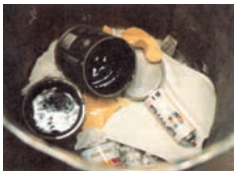
شکل ۱۷-۱- دورریزی نامناسب رنگ. این زائیده‌ی خطرناک خانگی می‌تواند موجب آلودگی آب‌های سطحی و زیرزمینی شود.