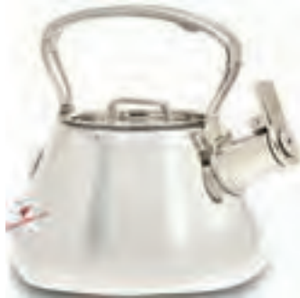
قوری با لوله کم ارتفاع (تصویر ۴-۴)

- طراح تصویر ۴-۴ چه اصلی را در طراحی فراموش کرده است؟ توضیح دهید.