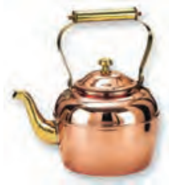
کتری فلزی (تصویر ۴-۵)

- در تصویر یک گلدان سرامیکی را می‌بینید. به نظر شما ساخت این گلدان با چه روشی ممکن است؟ آیا اگر