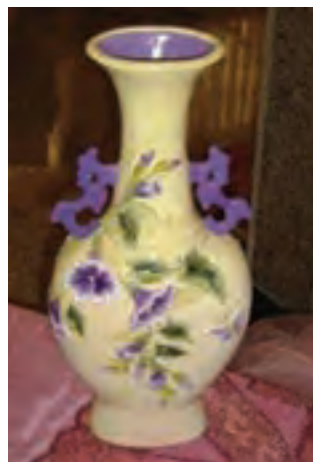
گلدان سرامیکی (تصویر ۴-۶)

قصد داشتیم با قالب دو تکه یک گلدان بسازیم طرح زیر طرح مناسبی بود؟