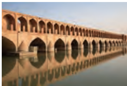
سی و سه پل (تصویر ۴-۱)

- در تصویر ۴-۲ قسمتی از کاشی کاری های یک مکان مذهبی به چشم می‌خورد ، چه ویژگی عمده ای در