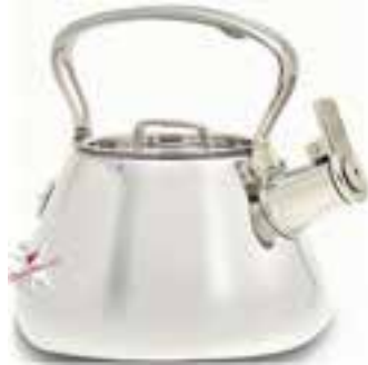
قوری با لوله کم ارتفاع (تصویر ۴-۴)

- طراح تصویر ۴-۴ چه اصلی را در طراحی فراموش کرده است؟ توضیح دهید.