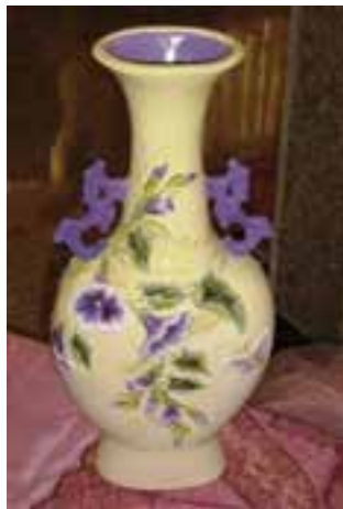
گلدان سرامیکی (تصویر ۴-۶)

قصد داشتیم با قالب دو تکه یک گلدان بسازیم طرح زیر طرح مناسبی بود؟