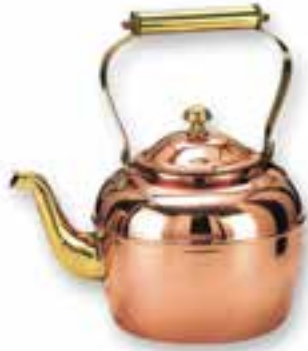
کتری فلزی (تصویر ۴-۵)

- در تصویر یک گلدان سرامیکی را می‌بینید. به نظر شما ساخت این گلدان با چه روشی ممکن است؟ آیا اگر