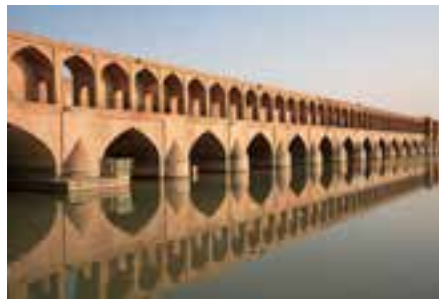
سی و سه پل (تصویر ۴-۱)

- در تصویر ۴-۲ قسمتی از کاشی کاری های یک مکان مذهبی به چشم می‌خورد ، چه ویژگی عمده ای در