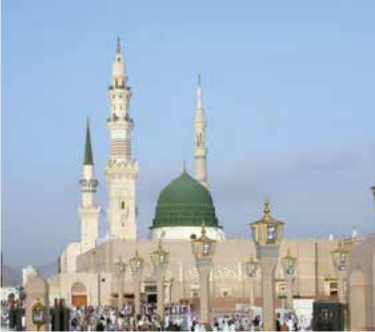
Masjed - al - Nabi : Medina

(Unser Prophet, Mohammad. Friede sei mit Dem Propheten und seinen Nachkommen)