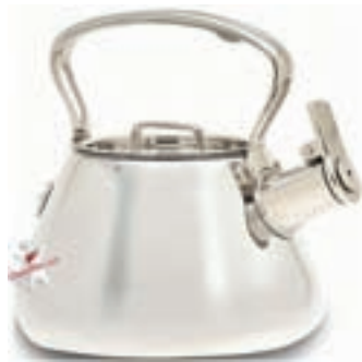
قوری با لوله کم ارتفاع (تصویر ۴-۴)

- طراح تصویر ۴-۴ چه اصلی را در طراحی فراموش کرده است؟ توضیح دهید.