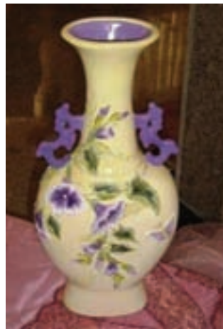
گلدان سرامیکی (تصویر ۴-۶)

قصد داشتیم با قالب دو تکه یک گلدان بسازیم طرح زیر طرح مناسبی بود؟