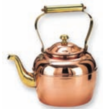
کتری فلزی (تصویر ۴-۵)

- در تصویر یک گلدان سرامیکی را می‌بینید. به نظر شما ساخت این گلدان با چه روشی ممکن است؟ آیا اگر