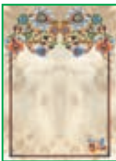
بخش آموزش قرآن ۲۸