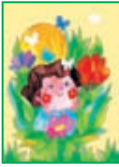
پاداش نیکی ۲۲