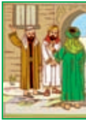
درس ۲۴ عبادت ۲۶