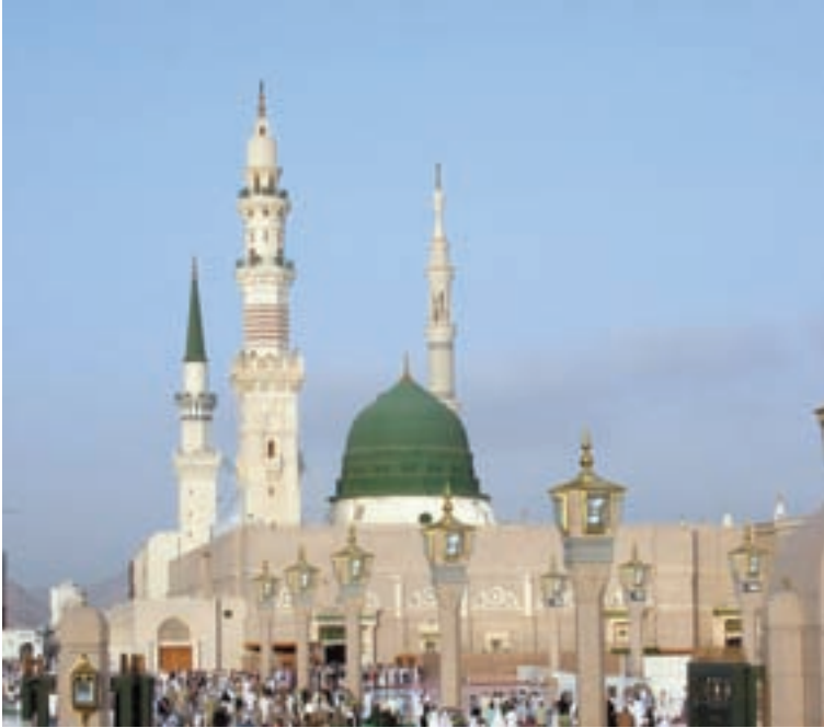
Masjed - al - Nabi : Medina

(Unser Prophet, Mohammad. Friede sei mit Dem Propheten und seinen Nachkommen)