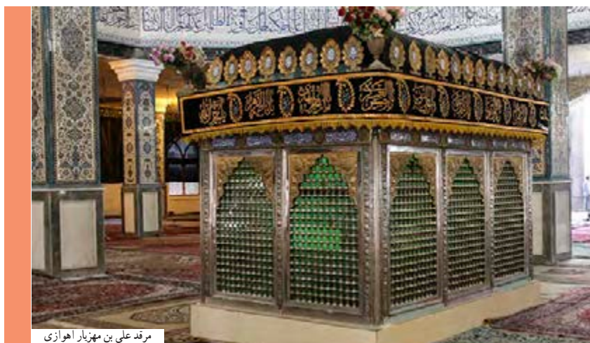
مرقد علی بن مهزیار اهوازی

از این‌رو، امامان، یارانی را تربیت می‌کردند که در عین سخت‌گیری‌های حاکمان، با شجاعت و ایثار به مناطق مختلف می‌رفتند و برای پیشبرد اهداف ائمه اطهار (علیهم‌السلام) تلاش می‌کردند و جایگاه امامان را نیز برای مردم توضیح می‌دادند.