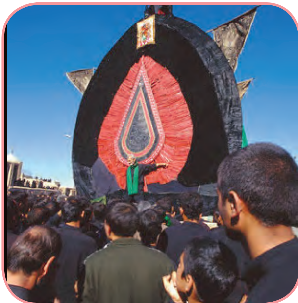
عزاداری ماه محرم

سرزمین ما ایران، کشور پهناوری است که سابقه‌ای بسیار کهن و قدیمی دارد. با مطالعه و بررسی بیشتر متوجه می‌شویم، وسعت و بزرگی ایران باعث شده است، مردم آن دارای زبان و لهجه، آداب و رسوم، لباس‌های محلی و صنایع دستی گوناگون باشند. این امر، به سرزمین ما زیبایی و تنوع داده است.